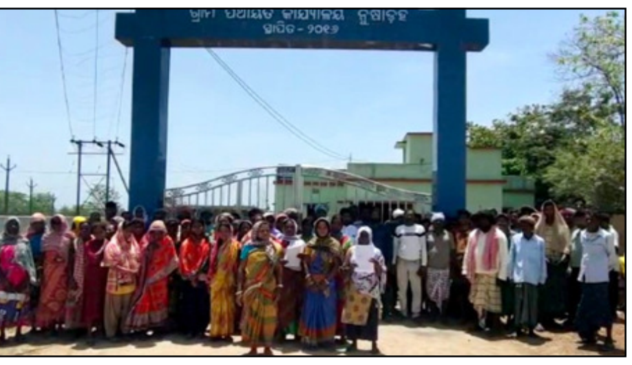
ଅଭିଯୋଗ କଲେ ସୁଧା କେହି କର୍ଷପାତ ନକରିବାରୁ ଗ୍ରାମବାସୀ ଭଟ୍ଟ ବର୍ଜନ କରିବେ ବୋଲି ଆସିକାକୁ ବେଦେ ନାହିଁ । ଯଦି ଗାଁ

ରାଇରଙ୍ଗପୁର, (ମହାଭାରତ) : ମୟୂରଭଞ୍ଜ ଜିଲ୍ଲା ବାବନଘାଟି ଉପଖଣ୍ଡ ବିକାଶକା ବ୍ଲକ ଅଧିନସ୍ଥ ନୂଆଦିଲ୍ଲୀ ଗ୍ରାମପଞ୍ଚାୟତରେ ଫେଲ ମାରିଛି ରାଜ୍ୟ ସରକାରଙ୍କ କୋଟି କୋଟି ଟଙ୍କାର ବସୁଧା ଯୋଜନା, ଏଠାରେ ଲୋକେ ଚପାଏ ପାଣି ହେଉଛନ୍ତି ଉତ୍ତମ ବିକଳ । ଜଳସଂକଟ ଯୋଗୁଁ ପ୍ରାୟ ଏକ କିଲୋମିଟର ଦୂରରେ ପିଇବା ପାଣି ଆଣି ବହୁତ କଷ୍ଟରେ ଚଳୁଛନ୍ତି । ଆଗେ ସ୍କୁଲ ମାନଙ୍କରେ ନଳକୂପରେ ଜଳ ଆଣି ପିଉଥିଲେ ଏବେ ଶିକ୍ଷକ ମାନେ ଛୁଆ ମାନଙ୍କ ଅସୁବିଧା ହେବବୋଲି ଗ୍ରାମବାସୀ ମାନଙ୍କୁ ଜଳ ନେବାପାଇଁ ସିଧାସଳଖ ମାନକରି ଥିଲେ । ଏହି ଜଳସଂକଟ ବିଷୟରେ ବିଡିଓ, ସରପଞ୍ଚ, ଜେଲକୁ ଲିଖିତ