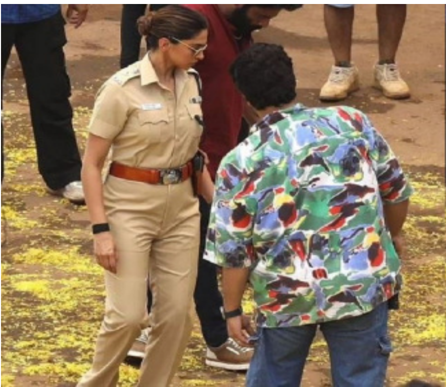
ବଲିଉଡର 'ମସ୍ତାନା' ଅର୍ଥାତ ଦୀପିକା ପାଦୁକୋନ ୨୦୨୪ ସେପ୍ଟେମ୍ବରରେ ମା' ହେବାକୁ ଯାଉଛନ୍ତି । ଏହି ମୁହୂର୍ତ୍ତକୁ ଅନୁଭବ କରିବାକୁ ଉତ୍ତମ ଅଭିନେତା ରଣବୀର ସିଂ ଏବଂ ଦୀପିକା ବହୁତ ଉତ୍ସାହିତ ଅଛନ୍ତି । ଅଧିକାଂଶ ଅଭିନେତ୍ରୀ ଗର୍ଭାବସ୍ଥାରେ

ସମ୍ପୂର୍ଣ୍ଣ ବିଶ୍ରାମ ନେବା ଉପରେ ଧ୍ୟାନ ଦେଉଥିବାବେଳେ ଅଭିନେତ୍ରୀ ଦୀପିକା ପାଦୁକୋନ ଗର୍ଭାବସ୍ଥାରେ ମଧ୍ୟ ନିରନ୍ତର କାର୍ଯ୍ୟ କରୁଛନ୍ତି । ନିକଟରେ ରୋହିତ ଶେଖାବ ନିର୍ଦ୍ଦେଶନାରେ ନିର୍ମିତ ମୁଭି 'ସିଂଘମ ଏଗେନ' ସେଟରୁ ଦୀପିକା ପାଦୁକୋନଙ୍କ କିଛି ଫଟୋ ଲିକ ହୋଇଛି ଯେଉଁଥିରେ ସେ ପୋଲିସ ପରି ପୋଷାକ ପିନ୍ଧିଥିବାର ନଜର ଆସିଛନ୍ତି ଏବଂ ଅଭିନେତ୍ରୀ ଜଣକ ନିଜ କେଶକୁ ବାନ୍ଧି ରଖିଛନ୍ତି । ଲୁକ୍କୁକୁ କମ୍ପ୍ୟୁଟ କରିବା ପାଇଁ ଦୀପିକା ମଧ୍ୟ ଚିନ୍ତା ମା । ପିନ୍ଧିଛନ୍ତି ଫେଟ୍‌ବୁଆରୀରେ ତାଙ୍କ ଗର୍ଭବତୀ ହୋଇଥିବା ଖବର ଘୋଷଣା କରିବା ପରେ ପ୍ରଶଂସକମାନେ ଦୀପିକା ପାଦୁକୋନ କାମ କରୁଥିବା ଦେଖି ଆଶ୍ଚର୍ଯ୍ୟ ହୋଇଯାଇଛନ୍ତି । ଦୀପିକା 'ସିଂଘମ ଏଗେନ'ରେ ଶକ୍ତି ଶେଖାବ ଭୂମି କାରେ ଅଭିନୟ କରିଛନ୍ତି, ଏହି ମୁଭିରେ ଅଜୟ ଦେବଗନ, ରଣବୀର ସିଂ, ଅକ୍ଷୟ କୁମାର ଏବଂ କରୀନା କପୁର ମଧ୍ୟ ଅଭିନୟ କରିଛନ୍ତି । ଏହାପୂର୍ବରୁ ଦୀପିକା ଏବଂ ରୋହିତ ଏକ ପୋଷ୍ଟର ଶେୟାର କରିଥିଲେ ଯେଉଁଥିରେ ଦୀପିକା ଶକ୍ତିଙ୍କ ଚରିତ୍ରରେ ଘୁରି ବୁଲୁଥିବାର ନଜର ଆସିଥିଲେ । ଏହି ମୁଭିରେ ଅକ୍ଷୟ କପୁର ଭିଲେନ ଭୂମିକାରେ ଅଭିନୟ କରିଛନ୍ତି ।