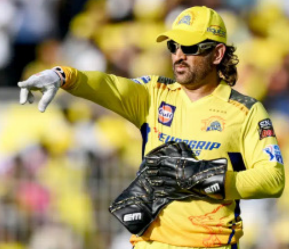
୫୦ତମ ବିକେଟ ଥିଲା । ତିପେଣ୍ଡି ଓମ୍‌କାର ଚେନ୍ନାଇ ୧୩ ମ୍ୟାଚରୁ ୧୪ ପଏଣ୍ଟ ସହ ପ୍ରେମିୟର ଅତି ନିକଟରେ ପହଞ୍ଚି ଯାଇଛି । ଦଳ ୧୮ ତାରିଖରେ

ଚେନ୍ନାଇ, ୧୩୫ (ଏକେଡ଼ି): ଆଇପିଏଲ୍ ୨୦୨୪ ପ୍ରେମିୟର ଖେଳିବା ଦିନରେ ଆଉ ଗୋଟିଏ ପାଦ ଆଗକୁ ବଢ଼ାଇଛି । ଚେନ୍ନାଇ ସୁପର କିଙ୍ଗ୍ସ ରବିବାର ଦଳ ଚେନ୍ନାଇରେ ରାଜସ୍ଥାନକୁ ୫ ଟ୍ରେକେଟରେ ହରାଇ ପରେ ପଏଣ୍ଟ ଟେବୁଲର ୩ୟ ସ୍ଥାନରେ ପହଞ୍ଚି ଯାଇଛି । ଚେନ୍ନାଇରେ ଏହା ଚେନ୍ନାଇର ଶେଷ ଲିଗ ମ୍ୟାଚ୍ ଥିଲା ।