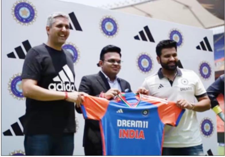
କରିବାକୁ ଥିବା ଜର୍ସି ଲକ୍ଷ୍ କଲେ ପୂର୍ବରୁ ଟି-୨୦ ବିଶ୍ୱକପରେ ଟିମ ଇଣ୍ଡିଆ ପରିଧାନ ଆଡ଼ିତାସ ଫ୍ୟାନ୍ସକୁ ଦେଇ ଯାଉଥିଲା । ହେଲିକପ୍ଟର

ପୁରୀ, ୧୩୫ (ଏକେଡ଼ି): ଟିମ ଇଣ୍ଡିଆର ନୂଆ ଜର୍ସିକୁ ଲକ୍ଷ୍ କଲେ ରୋହିତ ଓ ଜୟ ଶାହ ବିସିସିଆଇର ସାଧାରଣ ସମ୍ପାଦକ ଜୟ ଶାହ ଓ ଟିମ ଇଣ୍ଡିଆର ଅଧିନାୟକ ରୋହିତ ଶର୍ମା ଭାରତୀୟ କ୍ରିକେଟ ଟିମର ନୂଆ ଜର୍ସି ଅନାବରଣ କରିଛନ୍ତି । ଅନୁବାଦନ ନରେନ୍ଦ୍ର ମୋଦି ଉପସ୍ଥିତରେ ଆୟୋଜିତ କାର୍ଯ୍ୟକ୍ରମରେ ଆସନ୍ତା ଟି-୨୦ ବିଶ୍ୱକପରେ ଭାରତୀୟ ଟିମ ପିନ୍ଧିବାକୁ ଥିବା ଜର୍ସିକୁ ମଧ୍ୟ ଲକ୍ଷ୍ କରାଯାଇଛି ।