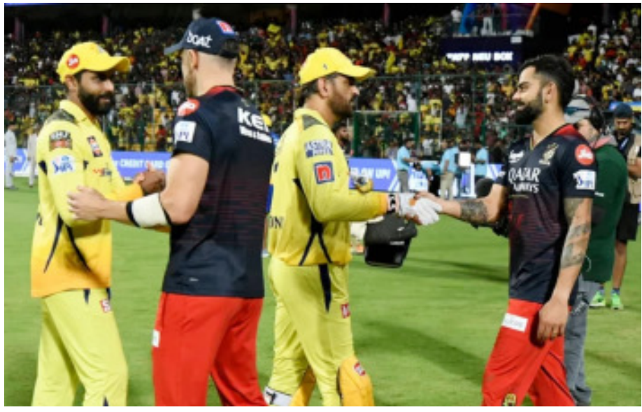
ହାଲତାରେ ବର୍ତ୍ତମାନ ୧୪ ପଏଣ୍ଟ ପାଇଛି । ଦଳ ପାଖରେ ଆହୁରି ୨ଟି ମ୍ୟାଚ ରହିଛି ହାଲତାରେ ତାର ଶେଷ ଦୁଇ ମ୍ୟାଚ ଗୁଜରାଟ ଟାଇଟନ୍ସ ଓ ପଞ୍ଜାବ କିଙ୍ଗ୍ସ ବିପକ୍ଷରେ ଖେଳିବ ଗୋଟିଏ ମ୍ୟାଚ ଜିତିଲେ ମଧ୍ୟ ଦଳ ପ୍ରେମିୟର ପ୍ରବେଶ କରିଯିବ । ଚୌକରେ ଲକ୍ଷ୍ଣୀ ମଧ୍ୟ ରହିଛି । ହେଲେ ଦଳର ରନ ରେଟ ୦.୭୬୯ । ସେହିପରି ଦଳ ତାର ଦୁଇଟି ଯାକ ମ୍ୟାଚ ଜିତିଲେ ସର୍ବାଧିକ ୧୬ ପଏଣ୍ଟ ପାଇପାରିବ । ଗୁଜରାଟ ପାଖରେ ୨ଟି ଓ ଦିଲ୍ଲୀ ପାଖରେ

ନୂଆଦିଲ୍ଲୀ, ୧୩୫: ଚଳିତ ଆଇପିଏଲ୍‌ର ପ୍ରେମିୟର ରବିବାର ମ୍ୟାଚରେ ଚେନ୍ନାଇ ରୟାଲ ଚ୍ୟାଲେଞ୍ଜର୍ସ ବେଙ୍ଗାଲୁରୁ (ଆରସିବି) କ୍ରମାଗତ ୫ମ ବିକେଟ ହାସଲ କରିଛି । ଦିଲ୍ଲୀ କ୍ୟାପିଟାଲ୍ସ ୪୭ ରନରେ ହରାଇବା ପରେ ପ୍ରେମିୟର ଚୌକରେ ନିଜର ସ୍ଥାନକୁ ଆହୁରି ମଜବୁତ କରି ନେଇଛି ଦଳ ।