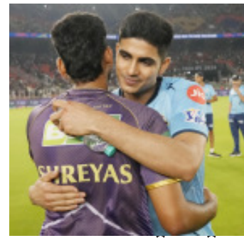
ଆରପିଏଲ୍‌ରୁ ବିବାହ ନେଲା ଗୁଜରାଟ ଗାନ୍ଧି