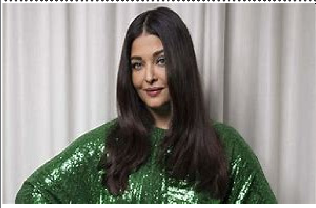
ବଳିଉଡ଼ ଲୋକପ୍ରିୟ ଅଭିନେତ୍ରୀ ଐଶ୍ଵର୍ଯ୍ୟା ନିକର ସୌନ୍ଦର୍ଯ୍ୟ ଓ ବ୍ୟକ୍ତିତ୍ଵ ପାଇଁ ସର୍ବଦା ଚର୍ଚ୍ଚାରେ ରହି ଆସିଥିଲା ଯେତେବେଳେ ସେ 'ବକନ' ନାମରେ ଆଲୋଚନା

କିଛି ଦିନ ଧରି ଅଭିଷେକ ଓ ଐଶ୍ଵର୍ଯ୍ୟାଙ୍କ ମଧ୍ୟରେ ଛାଡ଼ପତ୍ର ହେବା ନେଇ ଚର୍ଚ୍ଚା ଜୋର ଧରିଛି । ଏହା ମଧ୍ୟରେ ଐଶ୍ଵର୍ଯ୍ୟାଙ୍କ ଏକ ଭିଡିଓ ସୋସିଆଲ ମିଡିଆରେ ବେଶ ଭାଇରାଲ ହେଉଛି । ଯାହାକୁ ଦେଖିବା ପରେ ପ୍ରଶଂସକଙ୍କ ମଧ୍ୟରେ ପୁଣି ଥରେ ଛାଡ଼ପତ୍ରକୁ ନେଇ ଅନେକ ପ୍ରଶ୍ନ ଉଠୁଛି । କାଣକୁ ସମ୍ପୂର୍ଣ୍ଣ ଘଟଣା । ଅଭିନେତ୍ରୀ ଦୁବାଇରେ ଆୟୋଜିତ ଗ୍ଲୋବାଲ ଟ୍ଵିମେନ୍, ଫୋ ମ ଚେ ଅଂଶଗ୍ରହଣ କରିଥିଲେ । ଏହି ସମୟରେ ଏପରି କିଛି ଘଟିଥିଲା ଯାହା ସୋସିଆଲ ପ୍ରଶଂସା କରିଛନ୍ତି ।