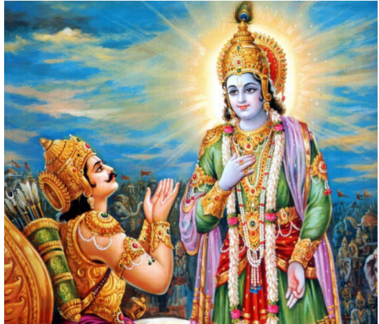
ହେଉଛି ଅସତ୍ୟ, ଯାହାର ତିନି ଲୋକରେ କେଉଁଠି ହେଲେ ଅସ୍ଥିତ ନାହିଁ ତେଣୁ ରୁମେ ଯୁଦ୍ଧ

କୌରବମାନଙ୍କୁ ବଧ କରିବା ଲାଗି ପାଣ୍ଡୁପୁତ୍ରଙ୍କୁ କହୁଛନ୍ତି । ପାଣ୍ଡବ ପକ୍ଷରେ ମଧ୍ୟ ଶରୀର ଅଛନ୍ତି । ପାଣ୍ଡବଙ୍କ ଶରୀର କ’ଣ ଅବିନାଶୀ? ଯଦି ଶରୀର ଅବିନାଶୀ, ତା’ହେଲେ ଶ୍ରୀକୃଷ୍ଣ କାହାର ସୁରକ୍ଷା ପାଇଁ ଛିଡ଼ା ହୋଇଥିଲେ? ଅର୍ଜୁନ କ’ଣ ଅ ୪ ୬ କୀ ଶ ସ ଶରୀରଧାରୀ ଥିଲେ? ଶରୀର ଯାହା ଅସତ୍ୟ, ଯାହାର ଅସ୍ଥିତ ନାହିଁ, ଯାହାକୁ ସୁରକ୍ଷା କରି ରଖିବା ସମ୍ଭବ ନୁହେଁ, କ’ଣ ଜ୍ଞାନ ନଥିଲା? ଏହି ପ୍ରଶ୍ନର ଉତ୍ତର ଶ୍ରୀକୃଷ୍ଣ ନିଜେ ହିଁ କହିଛନ୍ତି । ସେ କହିଛନ୍ତି, ଯଦି କେବଳ ଶରୀର ପାଇଁ ପରିଶ୍ରମ କରିଥାଏ, ସେ ଅବିନେକୀ ଏବଂ ମୃତ୍ୟୁ ବୁଝି ପାରେନା? ଯଦି ଅର୍ଜୁନ ଅଟେ, ଅନୁରାଗୀ ବ୍ୟକ୍ତି ପାଇଁ ଇଷ୍ଟଦେବ ସର୍ବଦା ରଥା ହୋଇ ଛିଡ଼ା ହୋଇ ରହିଥା’ନ୍ତି । ମନୁଷ୍ୟ ଖାଲି ଶରୀର ନୁହେଁ, ଶରୀର ତ’ ବାହ୍ୟ ଆବରଣ । ଏହି ଶରୀର ଭିତରେ ଚାଲିଯିବ, ଆତ୍ମା ଆଉ ଏକ ଶରୀର ଧାରଣ କରିବ । ଏହି ସମ୍ପର୍କରେ ଶ୍ରୀକୃଷ୍ଣ ଗୀତାରେ କହିସାରିଛନ୍ତି- ଯେପରି ବାଲ୍ୟକାଳରୁ ଯୁବାବସ୍ଥା ଏବଂ ପରେ ବୃଦ୍ଧାବସ୍ଥା ଆସିଥାଏ, ସେହିପରି ଦେହାନ୍ତର (ମୃତ୍ୟୁ)ର ପ୍ରାପ୍ତି ମଧ୍ୟ ହୋଇଥାଏ । ଏ ଶରୀର ଚାଲିଗଲେ, ଜୀବାତ୍ମା ନୂଆ ବସ୍ତ୍ର ଧାରଣ କରିବ ।