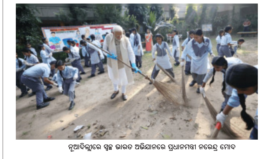
ନୂଆଦିଲ୍ଲୀରେ ସ୍ୱଳ୍ପ ଭାରତ ଅଭିଯାନରେ ପ୍ରଧାନମନ୍ତ୍ରୀ ନରେନ୍ଦ୍ର ମୋଦି

ସେ କହିଛନ୍ତି, ଇସ୍ରାଏଲ ପରେ ଭାରତର ପୁଣି ଆକ୍ରମଣକୁ ପୂର୍ଣ୍ଣସ୍ୱୀକାର ପ୍ରାୟ ସମସ୍ତ ଦେଶ ନିନ୍ଦା କରିଛନ୍ତି। କିନ୍ତୁ ଯଦି ଏହି ଆକ୍ରମଣକୁ ସ୍ୱୀକାର କରାଯାଏ ତେବେ ନିନ୍ଦା କରିପାରିବେ ନାହିଁ, ତାଙ୍କର ଇସ୍ରାଏଲର ମାଟିରେ ପାଦ ପକାଇବାର ଅଧିକାର ନାହିଁ। ଯେଉଁ ମହାସଭାରେ ହଜିବ, ହେକ୍ଟରଙ୍କୁ ଓ ହାଉଡିର ଆିତକବାଦୀ, ଦୁର୍ଘର୍ଣ୍ଣକାରୀ ଓ ହତ୍ୟାକାରୀ ଏବଂ ବିଶ୍ୱ ଆତଙ୍କର ମା ଭାରତକୁ ସମର୍ଥନ କରନ୍ତି, ସେ ଜାତିସଂଘ ଜଡ଼ିତହାସରେ ଏକ କଳଙ୍କ ଭାବେ ମନେ ରହିବେ। ଆିଷ୍ଟୋନିଓ ଗୁଡ଼େରସଙ୍କ ସହଯୋଗ କରନ୍ତୁ ତା ନ କରନ୍ତୁ ଇସ୍ରାଏଲ ତାର ନାଗରିକଙ୍କୁ ସୁରକ୍ଷା ଯୋଗାଇ ଦେବ ଓ ଏହାର ଜାତୀୟ ସମ୍ମାନକୁ ଅସ୍ୱୀକାର ରଖିବ ବୋଲି କହିଛନ୍ତି ଇସ୍ରାଏଲ କ୍ୟାଙ୍ଗ୍।