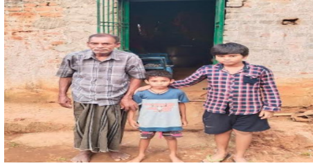
(୭)କୁ ଧରି ନିଜର ପୁଅର ଶୁଣି କୁଣ୍ଡା ସମାପନ କରି ବସ୍ତିବ ସେଥିପାଇଁ ବୋଧ ଉପରେ ନିଜର ବିତା ସଦୃଶ ହୋଇଛି ତାଙ୍କର ଜୀବନରେ । ତେଣୁ ଏହି ସମସ୍ୟା ପ୍ରତି ଦୃଷ୍ଟି ଦେଇ ସମାଜ ସେବା, ସ୍ୱଚ୍ଛତା ସେବା ସଂଗଠନ ଓ ସରକାରଙ୍କୁ ସହାୟତା ପାଇଁ ଅନୁରୋଧ କରି ଛତି ଜଣେ ଯୁବକ ସେଠୀ ।

ଘଟଣାରେ କିଛି ଲୋକ ମାନଙ୍କୁ ବିଧାତା ଦାଉ ସାଧୁକା ପରି ଦୁଃଖ ଉପରେ ଦୁଃଖ ଦେଇ ଉଲଗଲେ । ଏହି ପରି କନ୍ଧମାଳ ଜିଲ୍ଲାର ଖଜୁରାପଡ଼ା ବ୍ଲକ୍ ଅନ୍ତର୍ଗତ ଦୁଡ଼ା ମେଣ୍ଡି ପଞ୍ଚାୟତ ମଲିକ ସାହି ଗ୍ରାମର ଜଣେ ଯୁବକ ସେଠୀଙ୍କ ପରିବାରରେ ଦେଖିବାକୁ ମିଳିଛି । ସୂଚନା ପ୍ରକାରେ ଜଣେ ଯୁବକ ଜଣେ ଦିନ ମୃତ୍ୟୁର ଶୋକ ଥିବା ବେଳେ ତାଙ୍କର ବୟସ ୮୦ ବର୍ଷ ହେବ ନିକେ ଚଳିବା ପାଇଁ ଅସମର୍ଥ ତାଙ୍କର ସ୍ତ୍ରୀ ମାସେ ପୂର୍ବରୁ ତଳେ ମୃତ୍ୟୁ ବରଣ କରି