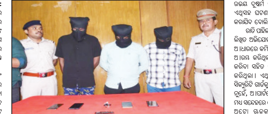
ଭୁବନେଶ୍ୱର ଲଜ୍ଜା ଘଟଣାରେ ୩ ଅଭିଯୁକ୍ତ ଗିରଫ ହେଲା ଇଣ୍ଡିଆନ ନେସ୍ ସେବା

ଭୁବନେଶ୍ୱର, ୨୧୧୦ (ମହାଭାରତ): ଭୁବନେଶ୍ୱର ଲଜ୍ଜା ଘଟଣାରେ ୩ ଅଭିଯୁକ୍ତ ଗିରଫ ହେଲା ଇଣ୍ଡିଆନ ନେସ୍ ସେବା