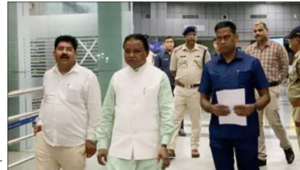
ଶିଳ୍ପ ବିକାଶ କ୍ଷେତ୍ରରେ ଓଡ଼ିଶାକୁ ଉତ୍କଳ ଆଣିବେ। ରାଜ୍ୟବାସୀଙ୍କ ପକ୍ଷରୁ ଏହି କାମର ଶୁଭାରମ୍ଭ କରିବାକୁ ଯାଉଛି ଓ ରାଜ୍ୟବାସୀଙ୍କ ଆଶୀର୍ବାଦ ଲୋଡ଼ି ବୋଲି ମୁଖ୍ୟମନ୍ତ୍ରୀ ଶ୍ରୀ ମାଝି କହିଛନ୍ତି।

ଭୁବନେଶ୍ୱରରେ ଯିବା ପୂର୍ବରୁ ଆଜି ଭୁବନେଶ୍ୱର ବିମାନ ବନ୍ଦରରେ ଗଣମାଧ୍ୟମକୁ ପ୍ରତିକ୍ରିୟା ଦେଇ ମୁଖ୍ୟମନ୍ତ୍ରୀ ଶ୍ରୀ ମାଝି କହିଛନ୍ତି ଯେ, ସେ ଭୁବନେଶ୍ୱର ପାଇଁ ଦିଲ୍ଲୀ ଗସ୍ତରେ ଯାଉଛନ୍ତି। ଦିଲ୍ଲୀରେ ନିବେଶକ ସମ୍ମିଳନୀରେ ଯୋଗ ଦେଇ ଓଡ଼ିଶା ଆସିବା ପାଇଁ ମଧ୍ୟ ପୁଞ୍ଜିନିବେଶକ ନିବେଦନ କରିବେ। ଓଡ଼ିଶାକୁ ବହୁ ସଂଖ୍ୟାରେ ପୁଞ୍ଜିନିବେଶକଙ୍କୁ ଆକୃଷ୍ଟ କରିବା ପାଇଁ ସେ ଉଦ୍ୟମ କରିବେ। ବିଭିନ୍ନ ପୁଞ୍ଜିନିବେଶକଙ୍କ ସହ ସ୍ୱାଗତ୍ୟୁତ୍ସା ଆଲୋଚନା ମଧ୍ୟ କରିବେ। ଏହାସହ ବିଶେଷକରି ପୂର୍ବ ପ୍ରୋସେସିଂ, ଆଇଟି, କେମିକାଲ, ପେଟ୍ରୋ କେମିକାଲ କ୍ଷେତ୍ରରେ ପୁଞ୍ଜିନିବେଶ ଉପରେ ପ୍ରାଥମିକତା ଦିଆଯିବ। ଏବିଗରେ ବିଭିନ୍ନ ପୁଞ୍ଜିନିବେଶକଙ୍କ ସହ ଆଲୋଚନା କରାଯିବ। ଓଡ଼ିଶାରେ ପୁଞ୍ଜିଲଗାଣ ତଥା ଶିଳ୍ପ ପ୍ରତିଷ୍ଠା ସମ୍ବନ୍ଧରେ ଥିବା ସକରାମ୍ପକ