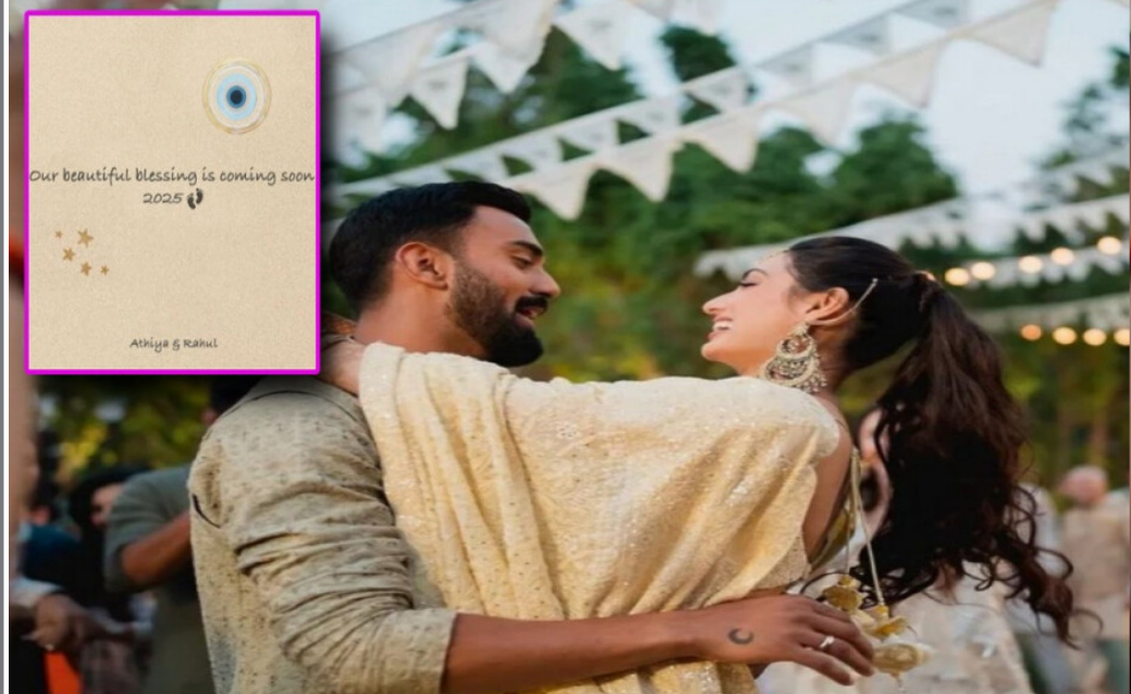
ବଲିଉଡ୍ ଅଭିନେତ୍ରୀ ଆୟୁଷା ସେଣା ଓ କ୍ରିକେଟର କେ.ଏଲ୍ ରାହୁଲଙ୍କ ଘରୁ ଆସିଛି ଖୁସି ଖବର। ଖୁବଶୀଘ୍ର ଏହି ଷ୍ଟାର ଦମ୍ପତି ନିଜ ଖବର ଶୁଣି ଚାକର ପରିବାର ଓ ପ୍ରଶଂସକ ସେମାନଙ୍କୁ ଶୁଭେଚ୍ଛା ଜଣାଇଛନ୍ତି। ଆୟୁଷାଙ୍କ ଭାଇ, ଅର୍ଥାତ୍ ସୁନୀଲ ସେଣାଙ୍କ ପୁଅ ଭାବେ ଏହି ଘୋଷଣା କଲେ କିଛି ଉତ୍ତମକୁ ଶୁଭେଚ୍ଛା ଜଣାଇଛନ୍ତି। ଅନ୍ୟପଟେ ପ୍ରଶଂସକମାନେ ମଧ୍ୟ ଏହି ଘୋଷଣାକୁ ବହୁତ ପସନ୍ଦ କରିଛନ୍ତି। ଖୁବଶୀଘ୍ର କୁନି କେଏଲ୍ ରାହୁଲ ଦୁନିଆକୁ ଆସିବାକୁ ଯାଉଥିବା ଯୁକର୍ଯ୍ୟମାନେ କଲେକ୍ କରିଛନ୍ତି। ପ୍ରକାଶ ଥାଉ, କ୍ରିକେଟର କେଏଲ୍ ରାହୁଲ ଏବଂ ବଲିଉଡ୍ ଅଭିନେତ୍ରୀ ଆୟୁଷା ସେଣା ଦାମ୍ପତି ଦିନ ତେଜ କରିବା ପରେ ଶେଷରେ ୨୩ ଜାନୁଆରୀ ୨୦୨୫ରେ ବିବାହ କରିଥିଲେ ଉତ୍ତମ ପରିବାର ଓ ବନ୍ଧୁବାନ୍ଧବଙ୍କ ଉପସ୍ଥିତିରେ ସୁନୀଲ ସେଣାଙ୍କ ଫାଉମ ହାଉସରେ ଯୁମାଧାନରେ ଏହି ବିବାହ ଅନୁଷ୍ଠିତ ହୋଇଥିଲା। ଏବେ ଏହି ଷ୍ଟାର ଦମ୍ପତି ବାପା-ମାଆ ହେବାକୁ ଯାଉଛନ୍ତି।