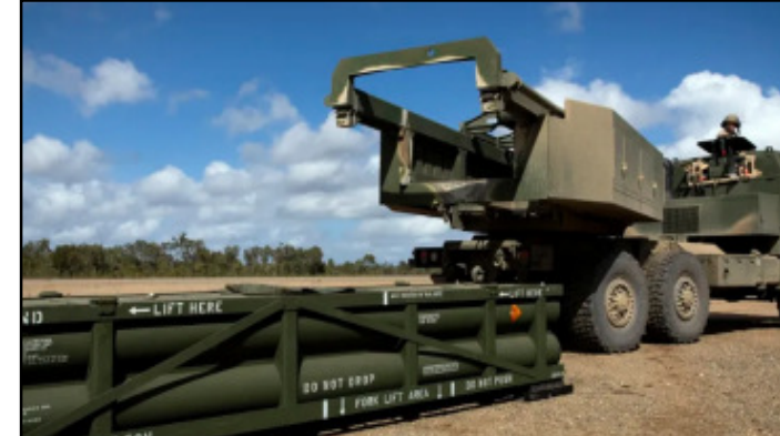
ସିଷ୍ଟମ (ଏଟିଏସିଏଏଏଏ) ବ୍ୟବହାର କରିଛି । ଇଣ୍ଟରଫୋସ୍ ନ୍ୟୁକ୍ ଏକେନ୍ଦ୍ର ରୁଷିଆର ପ୍ରତିରକ୍ଷା ମନ୍ତ୍ରାଳୟକୁ ଉଦ୍ଧୃତ କରି କହିଛି ଯେ ୟୁକ୍ରେନ୍ ପଶ୍ଚିମ ଦ୍ୱାରା ନିକ୍ଷେପଣ କରାଯାଇଥିବା ଏକ ଆମେରିକୀୟ କ୍ଷେପଣାସ୍ତ୍ର ଉପରେ ଆକ୍ରମଣ କରିବା ପାଇଁ ଏଟିଏସିଏଏଏଏ କ୍ଷେପଣାସ୍ତ୍ର ବ୍ୟବହାର କରିଥିଲା, ଯାହା ୟୁକ୍ରେନ୍କୁ ସାମାନ୍ତର ଉପାୟରେ ଏହି ଅସ୍ତ୍ରଶସ୍ତ୍ର ବ୍ୟବହାର କରିବାକୁ ଅନୁମତି ଦେବା ପରେ ପ୍ରଥମ ଆକ୍ରମଣ ।

ମସ୍କୋ, ୨୦୧୧ (ଏକେନ୍ଦ୍ର) : ଯାହା ଭୟ କରାଯାଉଥିଲା ଶେଷରେ ତାହା ହେଲା । ରୁଷ ସହିତ ଗଠିଥିବା ୟୁକ୍ରେନ୍ ୟୁକ୍ରେନ୍ ଆମେରିକୀୟ କ୍ଷେପଣାସ୍ତ୍ର ପ୍ରୟୋଗ କରିଛି । ଏଥିପାଇଁ କିଛିଦିନ ତଳେ ବାଲଟେନ ପ୍ରଶାସନ ଏହି ଘଟଣା ତଳେ ୟୁକ୍ରେନ୍ ମୋଡ଼ ବଦଳାଇଦେବ ବୋଲି ଆଶଙ୍କା କରାଯାଉଛି । କାରଣ ରୁଷ ପୂର୍ବରୁ ଏ ନେଇ ଚେତାବନୀ ଶୁଣାଇସାରିଛି । ୟୁକ୍ରେନ୍ ମଙ୍ଗଳବାର ଏକ ଆମେରିକୀୟ କ୍ଷେପଣାସ୍ତ୍ର ବ୍ୟବହାର କରି ରୁଷିଆ ଉପରେ ଆକ୍ରମଣ କରିଥିଲା ଯାହାକୁ ଭ୍ଲାଦିମିର ପୁଟିନ ପରମାଣୁ ୟୁକ୍ ପାଇଁ ଚେତାବନୀ ଦେଇଥିଲେ । ବାସ୍ତବରେ, ଏକ ରିପୋର୍ଟରେ ଦାବି କରାଯାଇଛି ଯେ ୟୁକ୍ରେନ୍ ସେନା ରୁଷିଆ ବିରୋଧରେ ଆର୍ମି ୱାକ୍ସାଲ୍ ମିସାଇଲ