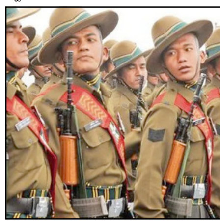
ଗୌରବୋଜ୍ଜଳ ପରମ୍ପରାର ଅନ୍ତ ଯଦି ବ । ଭାରତୀୟ ସେନାକୁ ଭାରତୀୟ ସେନାରେ କୌଣସି ନେପାଳୀ ଗୋଷ୍ଠୀ ନଆସିବାର କାରଣ

ଲାଗିଛି ଓ କୁହାଯାଉଛି ଯେ ଆସବା ୧୦ ବର୍ଷରେ ଭାରତୀୟ ସେନାରେ କୌଣସି ନେପାଳୀ ଗୋଷ୍ଠୀ ନଥିବେ ଏହା ସହିତ ଗତ ୨୦୦ ବର୍ଷର ଏକ ହେଉଛି ଭାରତୀୟ ସେନାରେ ଅର୍ଜୁନୀର ଝିଅ । ଏତେ କମ ସମୟ ପାଇଁ ଭାରତୀୟ ସେନାରେ ଯୋଗ ଦେବାକୁ ଉତ୍ସାହୀ ହେବାକୁ ନେପାଳୀ ଯୁବକ । ସେମାନେ ପୂର୍ବର ବ୍ୟବସ୍ଥା ଅନୁସାରେ ଭାରତୀୟ ସେନାରେ ଯୋଗ ଦେବାକୁ ଉତ୍ସାହୀ । ଏଥିପାଇଁ ଅର୍ଜୁନୀର ଝିଅ ଆରମ୍ଭ ହେବା ପରଠାରୁ ନେପାଳରେ ଭାରତୀୟ ସେନାର କୌଣସି ନିୟୁତ୍ତ ରାଜି ଆୟୋଜନକୁ ନେପାଳ ସରକାର ଅନୁମତି ଦେଉନାହାନ୍ତି । ଗୋଟିଏ ପଡ଼େ ନେପାଳକୁ କୌଣସି ଗୋଷ୍ଠୀ ଆସୁନଥିବାବେଳେ ବର୍ଗ ମାନ ସେବାରତ ଗୋଷ୍ଠୀମାନେ ଅବସର ନେବାରେ ଲାଗିଛନ୍ତି । ଏପରି ସ୍ଥିତି ଲାଗିରହିଲେ ଆସବା ୧୦ ବର୍ଷରେ ଯଦି ବ । ଭାରତୀୟ ସେନାକୁ ଭାରତୀୟ ସେନାରେ କୌଣସି ନେପାଳୀ ଗୋଷ୍ଠୀ ନଆସିବାର କାରଣ ନେପାଳୀ ଗୋଷ୍ଠୀ ନଥିବେ ।