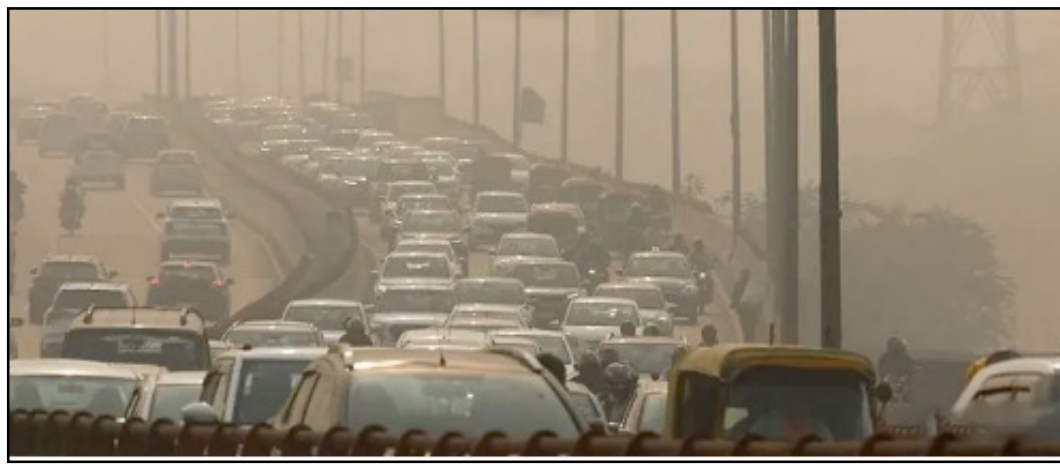
ଆମେରିକୀୟ ମହାକାଶ ଏଜେନ୍ସି ନାସା ଏକ ସାଟେଲାଇଟ୍ ଫଟୋ ଜାରି କରିଛି, ଯେଉଁଠି ଭାରତ ଓ ପାକିସ୍ତାନର ଏକ ବଡ଼ ଅଂଶ କଳା ଧୂଆଁରେ ଆଚ୍ଛନ୍ଦିତ ହୋଇଛି । ଶୀତଦିନେ ଭାରତର ୭୨

ନୂଆଦିଲ୍ଲୀ, ୨୦୧୧ (ଏକେନ୍ଦ୍ର) : ଦେଶର ରାଜଧାନୀ ଦିଲ୍ଲୀର ଅବସ୍ଥା ଅତ୍ୟନ୍ତ ଗମ୍ଭୀର ରହିଛି । ଦିଲ୍ଲୀ ଏବଂ ଏହାର ଆଖପାଖ ଅଞ୍ଚଳରେ ବାୟୁ ପ୍ରଦୂଷଣ ଅତ୍ୟନ୍ତ ବିପଜ୍ଜନକ ଧରଣରେ ପହଞ୍ଚିଛି । ଅନ୍ୟପକ୍ଷରେ ପାକିସ୍ତାନର ଦୁଇଟି ସହର ଲାହୋର ଓ ମୁଲତାନରେ ବାୟୁ ଗୁଣବତ୍ତା ସୂଚକାଙ୍କ (ଏକ୍ସଆଇ) ୨୦୦୦ ଅତିକ୍ରମ କରିଛି । ଏହାକୁ ଦୃଷ୍ଟିରେ ରଖି ପାକିସ୍ତାନ ସରକାର ଏହି ଦୁଇ ସହରରେ ସମ୍ପୂର୍ଣ୍ଣ ଲକଡାଉନ ଲାଗୁ କରିଛନ୍ତି । ଭାରତ-ଗାଙ୍ଗେସ ଯମତଳ ଅଞ୍ଚଳରେ ବାୟୁ ପ୍ରଦୂଷଣ ପ୍ରତି ଶୀତଦିନେ ବିପଜ୍ଜନକ ଧରଣ ଅତିକ୍ରମ କରିଥାଏ । ପ୍ରତିବର୍ଷ ଦୀର୍ଘକାଳ ପରେ ଉତ୍ତର ଓ କେନ୍ଦ୍ରୀୟ ଭାରତରେ ଋଷ ଜମିରେ ନିଆଁ ଲାଗିଥାଏ । ଯାହା ଫଳରେ ଦିଲ୍ଲୀ ସମେତ ଏହାର ଆଖପାଖ ଅଞ୍ଚଳରେ ପ୍ରଦୂଷଣ ହୁଏ ଗତିରେ ବଢ଼ିବାରେ ଲାଗିଛି । ନିକଟରେ