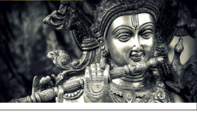
ଅଶୁଭାମା ହୋଇଗଲେ। ଏହାର କିଛିଦିନ ପରେ ଦ୍ରୋଣାଚାର୍ଯ୍ୟଙ୍କ ପତ୍ନୀ କୃପା ଏକ ଅତ୍ୟନ୍ତ ଚେକସ୍ତା ପୁତ୍ରକୁ ଜନ୍ମ ଦେଲେ। ଅଶୁଭାମାର ମସ୍ତକରେ ଏକ ଅମୂଲ୍ୟ ମଣି ଥିଲା। ଶକ୍ତିଶାଳୀ ଦୈତ୍ୟ, ବାନଦ, ଶିଷ୍ୟ, ବ୍ୟାଧି, ଦେବତା, ନାଗର ମଣି ଭଳି ତାହା ଦେଖାଯାଉଥିଲା। ଅଶୁଭାମା ଜନ୍ମ ସମୟରେ ତାଙ୍କ ମୁଖରୁ ଘୋଡ଼ା ଭଳି 'ହୁଁ ହୁଁ' ଶବ୍ଦ ବାହାରୁଥିଲା। ଏହି କାରଣରୁ ତାଙ୍କ ନାମ 'ଅଶୁଭାମା' ରଖାଗଲା। ମହାଭାରତରେ ଉଲ୍ଲେଖ ରହିଛି ଯେ

ପାଖର ଏବଂ କୌରବଙ୍କ ଗୁରୁ ଦ୍ରୋଣାଚାର୍ଯ୍ୟ ଏବଂ କୃପାଙ୍କ ପୁତ୍ର ଥିଲେ ଅଶୁଭାମା। ମହାଭାରତ ଯୁଦ୍ଧ ପୂର୍ବରୁ ଦ୍ରୋଣାଚାର୍ଯ୍ୟ ଅନେକ ସ୍ଥାନ ଭ୍ରମଣ କରୁଥିଲେ। ଅଧିକ ସେ ହିମାଳୟରେ ପହଞ୍ଚିଲେ। ସେଠାରେ ତମସା ନଦୀ ତଟରେ ଥିବା ଏକ ଦିବ୍ୟ ଗୁମ୍ଫାରେ ସେ ତପସ୍ୟା କଲେ। ଭଗବାନ ଶିବ ତାଙ୍କ ତପସ୍ୟାରେ ସନ୍ତୁଷ୍ଟ ହୋଇ ପ୍ରକଟ ହେଲେ। ଗୁରୁ ଦ୍ରୋଣାଚାର୍ଯ୍ୟ ଭଗବାନ ଶିବଙ୍କୁ ପୂଜା ପ୍ରାର୍ଥନା କରି ବରଦାନ ମାଗିଲେ। ଶିବ