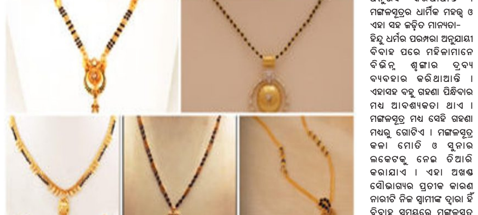
କାରଣରୁ ନାଗାମାନଙ୍କ ରକ୍ତତପ ସଠିକ୍ ରହିଥାଏ । ମଙ୍ଗଳସୂତ୍ରରେ ଥିବା କଳା ମୋତି ବାୟୁକୃମିତ ରୋଗରୁ ରକ୍ଷା କରିବା ପାଇଁ ଶକ୍ତି ପ୍ରଦାନ କରିବା ଦ୍ୱାରା ମହିଳାଙ୍କୁ ଶକ୍ତି ମିଳିଥାଏ । ମଙ୍ଗଳସୂତ୍ରରେ ଥିବା କଳା ମୋତି ବାୟୁକୃମିତ ରୋଗରୁ ରକ୍ଷା କରିବା ପାଇଁ ଶକ୍ତି ପ୍ରଦାନ କରିଥାଏ । ମଙ୍ଗଳସୂତ୍ର ଧାରଣ କରିବା ଦ୍ୱାରା ମହିଳାଙ୍କ ଶରୀରରେ ସକରାତ୍ମକ ଶକ୍ତି ରହିବା ସହ ସେ ନିଜକୁ ଶକ୍ତିଶାଳୀ କରିଥାଏ ।

ଅନୁଭବ କରିଥାଆନ୍ତି । ମଙ୍ଗଳସୂତ୍ର ଧାର୍ମିକ ମହତ୍ତ୍ୱ ଓ ଏହା ସହ ଜଡ଼ିତ ମାନ୍ୟତା-ହିନ୍ଦୁ ଧର୍ମର ପରମ୍ପରା ଅନୁଯାୟୀ ବିବାହ ପରେ ମହିଳାମାନେ ବିଭିନ୍ନ ଶୁଣ୍ଠା ଓ ବ୍ୟବ ବ୍ୟବହାର କରିଥାଆନ୍ତି । ଏହାସହ ବହୁ ଗହଣା ପିନ୍ଧିବାର ମଧ୍ୟ ଆବଶ୍ୟକତା ଥାଏ । ମଙ୍ଗଳସୂତ୍ର ମଧ୍ୟ ସେହି ଗହଣା ମଧ୍ୟରୁ ଗୋଟିଏ । ମଙ୍ଗଳସୂତ୍ର କଳା ମୋତି ଓ ସୁନାର ଲକେଟକୁ ନେଇ ତିଆରି କରାଯାଏ । ଏହା ଅଖଣ୍ଡ ସୌଭାଗ୍ୟର ପ୍ରତୀକ କାରଣ ନାଗାଟି ନିଜ ସ୍ୱାମୀଙ୍କ ଦ୍ୱାରା ହିଁ ବିବାହ ସମୟରେ ମଙ୍ଗଳସୂତ୍ର ପିନ୍ଧିଥାଏ । ମଙ୍ଗଳସୂତ୍ରରେ ଥିବା କଳା ମୋତି ନାଗାମାନଙ୍କୁ ନକରାତ୍ମକ ଦୃଷ୍ଟିରୁ ରକ୍ଷା କରିଥାଏ ।