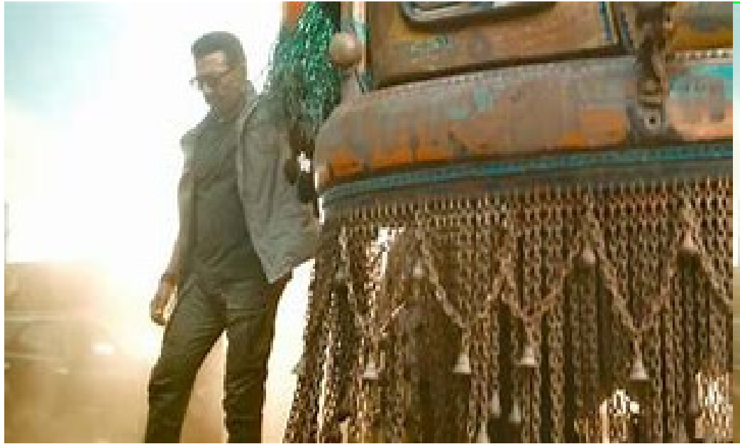
ଆସୁଛି ସନି ଦେଓଲ ଅଭିନୀତ ଫିଲ୍ମ ‘ଜାଟ୍’ । ଏହି ଚଳଚ୍ଚିତ୍ର ଆସନ୍ତା ମାସ ପ୍ରେକ୍ଷାଳୟକୁ ଆସିବ । ଏହା ପୂର୍ବରୁ ଅଛନ୍ତି ଏବଂ ଖୁବ୍ ଶୀଘ୍ର ଏହି ଅପେକ୍ଷାର ତାରିଖ ବିଷୟରେ ସୂଚନା ଦେଇଛନ୍ତି ।

ନିମାତା ଫିଲ୍ମର ଏକ ପ୍ରୋମୋ ଶେୟାର କରନ୍ତୁ , ସେଇଥିରେ ସନି ଦେଓଲଙ୍କ ଗର୍ଜନ ଶୁଣିବାକୁ ମିଳିଛି । ଏହି ପ୍ରୋମୋରେ ଟ୍ରେଲର ରିଲିଜ୍ ତାରିଖ ସୋଶାଲ୍ କରାଯାଇଛି । ଏହି ପ୍ରୋମୋରେ ଟ୍ରେଲର ରିଲିଜ୍ ତାରିଖ ସୋଶାଲ୍ କରାଯାଇଛି । ଏହି ପ୍ରୋମୋରେ ଟ୍ରେଲର ରିଲିଜ୍ ତାରିଖ ସୋଶାଲ୍ କରାଯାଇଛି । ଏହି ପ୍ରୋମୋରେ ଟ୍ରେଲର ରିଲିଜ୍ ତାରିଖ ସୋଶାଲ୍ କରାଯାଇଛି ।