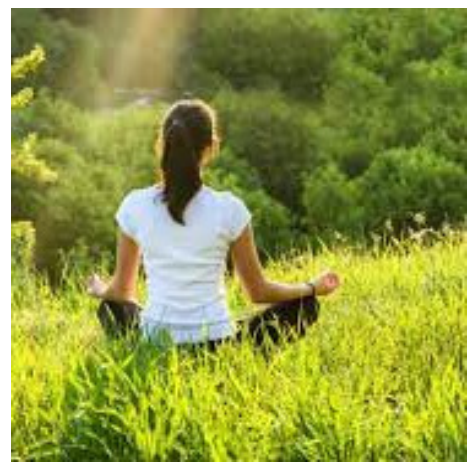
ପ୍ରଭୁ ରହିଥାଏ, ଯାହାଦ୍ୱାରା କ୍ରୋଧର ପ୍ରଭାବ ମଧ୍ୟ କମିଯାଇଥାଏ। ଏହି ଆସନ କରାଯାଇ ପାରେ।

ଆମମାନଙ୍କ ମଧ୍ୟରୁ ଅନେକ ଲୋକ ନିଜର ରାଗ ଉପରେ ନିୟନ୍ତ୍ରଣ କରିପାରନ୍ତି ନାହିଁ। ଏହା ରାଗ ତାକୁ ଶାନ୍ତିରାଜ ଏବଂ ମାନସିକ କ୍ଷେତ୍ରରେ ଅନେକ କ୍ଷତି କରିଥାଏ।