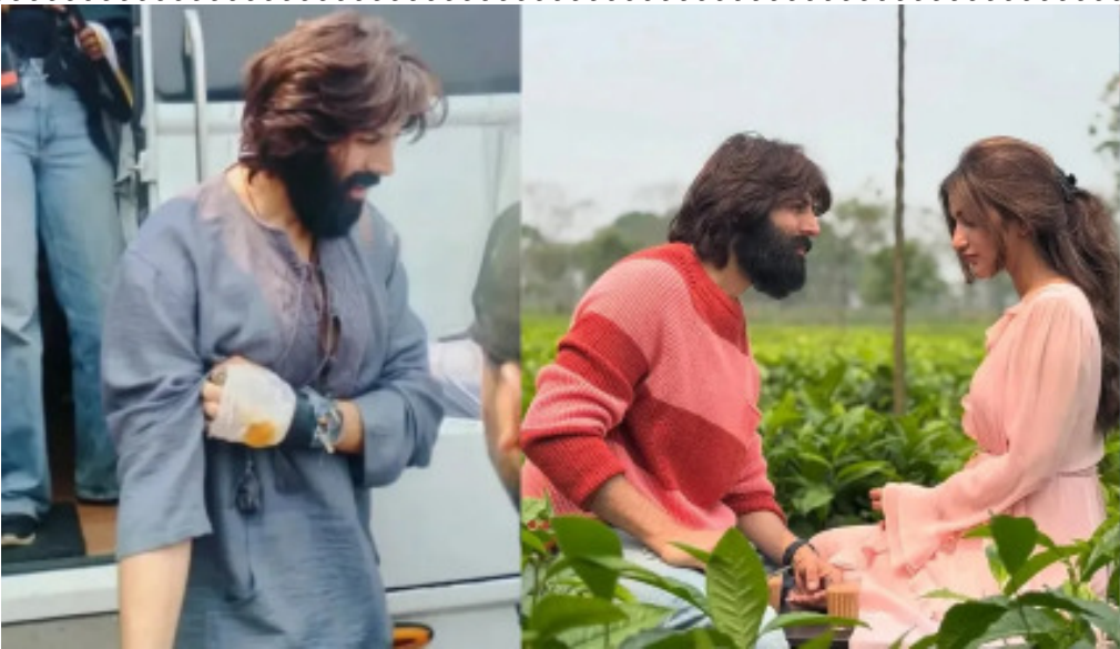
ବଲିଉଡ଼ ଫିଲ୍ମ ଉତ୍ସର୍ଗର ଲୋକପ୍ରିୟ ଅଭିନେତା କାର୍ତ୍ତିକ ଆର୍ୟନ ଦକ୍ଷିଣ ଅଭିନେତ୍ରୀ ଶ୍ରୀଲୀଳାଙ୍କ ସହ ଅନୁରାଗ ବସୁଙ୍କ ନୂତନ ରୋମାଞ୍ଚିକ ଥ୍ରାଲର ସୁଚିତ୍ରେ ବ୍ୟସ୍ତ ଅଛନ୍ତି । ସମ୍ପ୍ରତି କାର୍ତ୍ତିକ ଆର୍ୟନଙ୍କ ଏକ ଫଟୋ ହୋଇପଡ଼ିଛନ୍ତି । କେହିକେହି ଫଟୋରେ ଆଘାତ ସହିତ

ସେ। ସିଏ ଆଲର୍ଟ ଅଟେ । ଭାଇ ଭଉଣୀ ହେଉଛନ୍ତି । ଯେଉଁଥିରେ ତାଙ୍କ ହାତରେ ଆଘାତ ଲାଗିଥିବା ସ୍ଵପ୍ନ ଭାବେ ଦେଖିବାକୁ ମିଳୁଛି । ହାତରେ ଆଘାତ ଲାଗିବା ସହିତ ସୁଚିତ୍ ଜାରି ରଖିଛନ୍ତି । କାର୍ତ୍ତିକ ଏହି ଫଟୋକୁ ଦେଖି ତାଙ୍କୁ ଫଟୋ ସାମ୍ବାଦିକ ଆସିଥିଲା । ଯେଉଁଥିରେ ତାଙ୍କ ହାତରେ ଲାଗିଥିବା ଆଘାତର ପରିବନ୍ଧା ଥିବା ସମସ୍ତ ଦେଖିବାକୁ ପାଇଥିଲେ ।