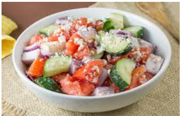
ପାଚନ କ୍ରିୟା ସମୟରେ ପ୍ରତ୍ୟେକ ଖାଦ୍ୟ ଭିନ୍ନ ଭିନ୍ନ ଭାବେ ଚିଆକୁ କରିଥାଏ । କିଛି ଆହାର ସହଜରେ ହଜନ ହୋଇଯାଇଥାଏ । କିନ୍ତୁ ଆଉ କିଛି ଆହାର ହଜନ ହେବାକୁ ବହୁତ ଅଧିକ ସମୟ ନେଇଥାନ୍ତି । ଦୁଇଟି ଆହାରର ମିଶ୍ରଣ ମଧ୍ୟ ହଜନ ହେବାକୁ ଅଲଗା ଅଲଗା ସମୟ ନେଇଥାଏ । ଏହାଦ୍ଵାରା ପେଟରେ ଯତ୍ନଶୀଳ, ଗ୍ୟାସ, ଅକାପଣ ଦେଖାଦେଇଥାଏ । ସାଲାଡ଼, ସୁପ୍, ମିଠା, ତରକାରୀ ଆଦି ରୋଷେଇ କରିବା ସମୟରେ ବିଭିନ୍ନ ପ୍ରକାର ପରିପରିବା

କାକୁଡ଼ି ଓ ଚମାଟୋ ବିନା ସାଲାଡ଼ର କଳ୍ପନା ମଧ୍ୟ କରାଯାଇ ପାରିବ ନାହିଁ । ଶରୀର ପାଇଁ ସାଲାଡ଼ ବହୁତ ହିତକର ବିଶେଷକରି ଗରମ ଦିନରେ ସାଲାଡ଼ କହୁତ ଉପାଦେୟ । ପ୍ରତିଦିନ ଭୋଜନରେ ସାଲାଡ଼ ଖାଇଲେ ଶରୀର ସୁସ୍ଥ ରହେ । ତେବେ ଆପଣ ଜାଣିଛନ୍ତି ସାଲାଡ଼ର ପ୍ରଭାବ ଯାତନ ଚକ୍ଷୁ ଉପରେ ମଧ୍ୟ ପଡ଼ିପାରେ । ସାଲାଡ଼ରେ କାକୁଡ଼ି, ଫିଆକ, ଚମାଟୋ, ମୂଳା ଆଦି ମିଶ୍ରଣ ଆକର୍ଷଣୀୟ ହୋଇଥାଏ । କିନ୍ତୁ ସ୍ଵାସ୍ଥ୍ୟ ଦୃଷ୍ଟିରୁ ଏହା ହାନିକାରକ ବିଶେଷତଃ କହିବାନୁପାୟୀ, କାକୁଡ଼ିର ପୋଷାକ ତତ୍ତ୍ଵ ରହିଛି । ଯାହା ଶରୀରକୁ ହାଇଡ୍ରୋଜେନ୍ ରଖୁଥାଏ । କାକୁଡ଼ିରେ ଏମିତି ଏକ ଗୁଣ ମଧ୍ୟ ରହିଛି । ଯାହା ଭିତାମିନ-ସି ଅବଶୋଷଣ ସହ ହସ୍ତକ୍ଷେପ କରିଥାଏ । ସେଥିପାଇଁ ଚମାଟୋ ଓ କାକୁଡ଼ିକୁ ଏକାସଙ୍ଗେ ଖାଇବାକୁ ବାରଣ କରାଯାଇଥାଏ । ଚମାଟୋ ଓ କାକୁଡ଼ି ଅଲଗା ଅଲଗା ଭାବେ ହଜନ ହୋଇଥାଏ । ଯେଉଁଥିପାଇଁ ମିଶେଇ ଖାଇବାକୁ ବାରଣ କରାଯାଇଥାଏ । ବିଶେଷତଃ ଅନୁପାୟୀ, କାକୁଡ଼ି ଓ ଚମାଟୋ ଏକାସଙ୍ଗେ ଖାଇଲେ ଏସିଡ୍ ଫରମେସନ ଓ କ୍ଲୋରିନ୍ କାରଣ ହୋଇଥାଏ ।