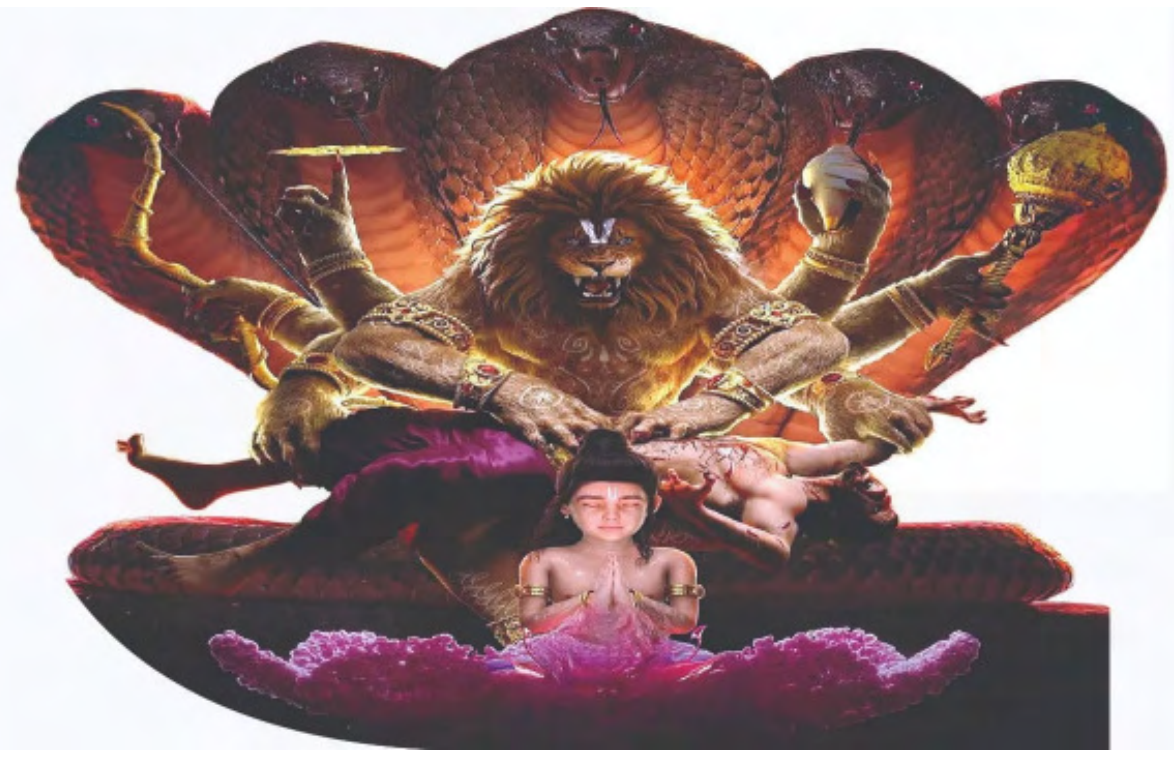
'ସେୟାରା' ଝଡ଼କୁ ଅମାଲ ଦେଲେ ଆନିମେଟେଡ଼ ଫିଲ୍ମ 'ମହାବତାର ନରସିଂହ' । ରିଲିଜ୍ ପୂର୍ବରୁ ଫିଲ୍ମର କେଶସି ପ୍ରଚାର କରାଯାଇ ନଥିବା ବେଳେ ରିଲିଜ୍ ପରେ ଦର୍ଶକ ଏବେ ଏହାର ପ୍ରଚାର ଆରମ୍ଭ କରିଛନ୍ତି । ଫଳସ୍ୱରୂପ ଦିନକୁ ଦିନ ଫିଲ୍ମର ଆୟ ଓ ଲୋକପ୍ରିୟତା ବିବାରେ ଲାଗିଛି । ଦୂର ସପ୍ତାହ ସୁଦ୍ଧା ଏହାର ବକ୍ସ ଅଫିସ୍ ଆୟ ୧୦୦ କୋଟି

'ସେୟାରା' ଆଗରୁ ରିଲିଜ୍ ହୋଇ ନିଜର ଆଧୁପତ୍ୟ ବିସ୍ତାର କରିଥିବା ବେଳେ 'ମହାବତାର ନରସିଂହ' କୁଲାଇ ୨୫ରେ ରିଲିଜ୍ ହୋଇଥିଲା । ତଥାପି ଫିଲ୍ମଟି ବକ୍ସ ଅଫିସରେ ନିଜର ସ୍ଥାନ ତିଆରି କରିଛି । 'ସେୟାରା' ଏବଂ 'ମହାବତାର ନରସିଂହ' ସମ୍ପୂର୍ଣ୍ଣ ଭିନ୍ନ ଧାରାର ହୋଇଥିଲେ ହେଁ ପ୍ରେକ୍ଷାଳୟରେ ୨ଟିଯାକ ଫିଲ୍ମ ଧମାକା କରୁଛନ୍ତି । ଦୂରଦିନୀୟ ଫିଲ୍ମ ଭଳି ରୋଜଗାର କରୁଛନ୍ତି । ଧାର୍ମିକ କାହାଣୀ ଆଧାରିତ ସିନେମା ହୋଇଥିବାରୁ ଲୋକେ ପାଦରୁ କୋଡ଼ା କାଁ ପ୍ରେକ୍ଷାଳୟକୁ ଯାଉଥିବା ଦେଖିବାକୁ ମିଳୁଛି । ସୋସିଆଲ୍ ମିଡିଆରେ ଭାଇଭାଇ ହେଉଥିବା ଭିଡିଓରୁ ଏହା ଜଣାପଡ଼ିଛି । କୋଡ଼ା କାଢ଼ିବା ସହ ଦର୍ଶକ ସଂକୀର୍ତ୍ତନ ମଧ୍ୟ କରୁଥିବା ଦେଖାଯାଇଛି । ଲୋକପ୍ରିୟତା ସହ ଆୟ ବଢ଼ିବା ପରେ 'ମହାବତାର ନରସିଂହ' ଏବେ ଅନ୍ୟ ସବୁ ବଡ଼ ବଜେଟ୍ ଆନିମେଟେଡ଼ ଫିଲ୍ମକୁ ପଛରେ ପକାଇ ଭାରତରେ ଅଧିକ ଆୟ କରିଥିବା ଆନିମେଟେଡ଼ ଫିଲ୍ମ ହୋଇପାରିଛି । ଫିଲ୍ମର ଶେଷ ୨୦ ମିନିଟ୍ ଦର୍ଶକଙ୍କୁ ଅଧିକ ପ୍ରଭାବିତ କରୁଛି । ଏହି ଫିଲ୍ମରେ ଭଗବାନ ବିଷ୍ଣୁଙ୍କ ନରସିଂହ ଅବତାର ବିଷୟରେ ଦେଖାଯାଇଛି । ଏହାପରେ ଭଗବାନଙ୍କର ଆଉ ୯ଟି ଅବତାରକୁ ନେଇ ଆନିମେଟେଡ଼ ଫିଲ୍ମ ନିର୍ମାଣ କରିବ ବୋଲି ଘୋଷଣା କରିଛି ହୋଇଲେ ଫିଲ୍ମସ୍ । 'ମହାବତାର ନରସିଂହ'ର ନିର୍ଦ୍ଦେଶନା ଅଶ୍ୱିନ କୁମାର ଦେଉଥିବା ବେଳେ ଏହାର ନିର୍ମାଣ ଦାୟିତ୍ୱରେ ଅଛନ୍ତି ଶିଳ୍ପା ଧାଢ଼ନ, କୁଶଲ ଦେଶାଇ ଓ ଚେତନ୍ୟ ଦେଶାଇ । କଲିମ୍ ପ୍ରଡକ୍ସନ୍ ଅଧୀନରେ ଏହାର ନିର୍ମାଣ କରାଯାଇଛି ।