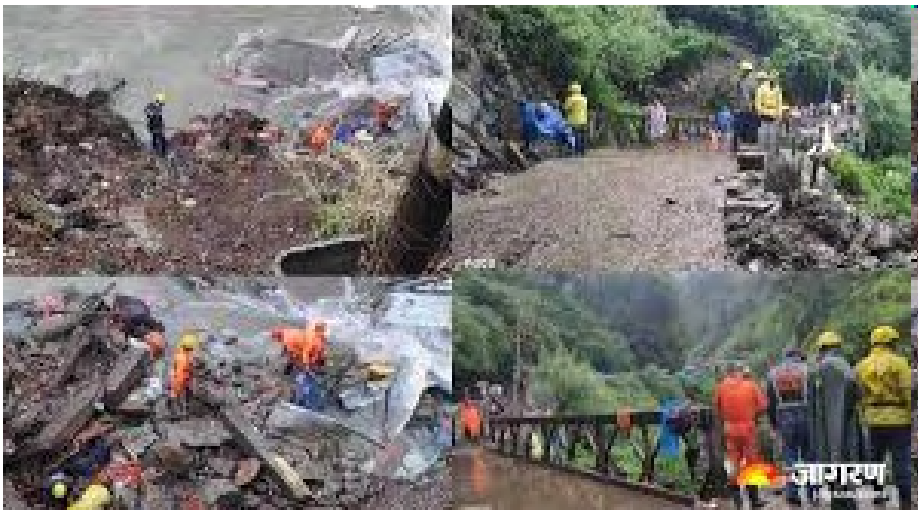
ଏକ ଯୁବିଏଟିଏ ( ଉତ୍ତରାଖଣ୍ଡ ସିଲିଲ ଏଭିଏସଏନ ଡେଭେଲପମେଣ୍ଟ ଅଥୋରିଟି ) ମୃତଦେହ ହୋଇଛି । ପ୍ରଭାବିତ ଅଞ୍ଚଳକୁ ହେଲିକପ୍ଟରରେ ଯୋଗାଯୋଗ ଖାବ୍ୟ ସାମଗ୍ରୀ ମଧ୍ୟ ପଠାଯାଇଛି । ଉଦ୍ଧାର କାର୍ଯ୍ୟ ତଦାରଖ ପାଇଁ ମୁଖ୍ୟମନ୍ତ୍ରୀ ପୁଷ୍ପର ସିଂହ ଧାମୀ ଉତ୍ତରକାଶୀ ଜିଲ୍ଲା ମୁଖ୍ୟାଳୟରେ ଶିବିର ପକାଇ ରହିଛନ୍ତି । ଆଜି ସକାଳେ

ନୂଆଦିଲ୍ଲୀ : ଉତ୍ତରକାଶୀ ଧରାଲି ଗାଁରେ ଧୂ-ସଲାନା ରଚିଛି ଦାଦଳଫଟା ବର୍ଷା । ଦେବଭୂମିରେ ପ୍ରକୟ ଆଣିଛି ପ୍ରକୃତି । ଦୁର୍ଘଟଣାକୁ ୩ଦିନ ପୂରିଯାଇଛି ଆଉ କାତୁଅ ମାଟି ଭିତରୁ ଝଲିଛି ଜୀବନର ସନ୍ଧାନ । ଦେବଦୂତ ସାଜି ଧୂ-ସଲାନାକୁ ସୁରକ୍ଷିତ ଉଦ୍ଧାର କରାଯାଇଥିବା ବେଳେ ଆହୁରି ୩୩୫ ଜଣ ଫସି ରହି ଥିବା ଆଶଙ୍କା କରାଯାଇଛି । ସୂଚନା ଅନୁଯାୟୀ ଉତ୍ତରକାଶୀର ବିପର୍ଯ୍ୟୟଗ୍ରସ୍ତ ଧରାଲି ଗ୍ରାମରେ ଶୁକ୍ରବାର ଉଦ୍ଧାର ଅପରେସନ୍ ଉଦ୍ଧାରୀତ ହୋଇଛି । ଆଜି ସନ୍ଧ୍ୟା ସୁଦ୍ଧା ଆଉ ୫୬୬ ଜଣଙ୍କୁ ସୁରକ୍ଷିତ ଉଦ୍ଧାର କରାଯାଇଛି ବୋଲି ଅଧିକାରୀମାନେ କହିଛନ୍ତି । ଗଙ୍ଗୋତ୍ରୀ ଜାତୀୟ ରାଜପଥ ଏବଂ ଅନେକ ରାଷ୍ଟ୍ର ସମ୍ପୂର୍ଣ୍ଣ ନଷ୍ଟ ହୋଇଯାଇଥିବାରୁ ଏବେ ପ୍ରାଥମିକ ପର୍ଯ୍ୟାୟରେ କେବଳ ଆକାଶ ମାର୍ଗରୁ ଉଦ୍ଧାର ଏବଂ ରିଲିଫ୍ ଅପରେସନ୍ ଚଳିଛି । ଉଦ୍ଧାର ଅପରେସନ୍ ତତ୍ପର୍ଯ୍ୟ ଦିନରେ ମୋଟ ୮୪୦ ଜଣଙ୍କୁ ଉଦ୍ଧାର କରାଗଲାଣି । ତେବେ ୬୦ ଲୋକ ଏବେ ବି ନିଖୋଜ ଅଛନ୍ତି । ସେମାନଙ୍କର କେଶସି ପରା ମିଳୁନାହିଁ । ସେମାନଙ୍କ ମଧ୍ୟରେ ୯ ଜଣ ସେନା ସବାନ ଏବଂ ୬ ଜଣ ସାଧାରଣ ନାଗରିକ ଅଛନ୍ତି । ଜିଲ୍ଲା ପ୍ରଶାସନ ମଙ୍ଗଳବାର କହିଛି ଯେ ଅନେକ ବନ୍ୟାରେ ୪ ଜଣଙ୍କ ମୃତ୍ୟୁ ହୋଇଯାଇଛି । କିନ୍ତୁ ଏଯାବତ ୨ ଜଣଙ୍କ ମୃତଦେହ ମିଳିଛି । ଶୁକ୍ରବାର ସକାଳେ ୫୬୬ ଲୋକଙ୍କୁ ସୁରକ୍ଷିତ ଭାବେ ଆଇଟି ବିପିର ମଡ଼ିଲି ହେଲିପ୍ୟାପୁ ଅଣାଯାଇଛି । ଆହୁରି ୩୦୦ରୁ ଅଧିକ ଲୋକ ଉଦ୍ଧାର ଅପରେସନ୍ ଅଛନ୍ତି ବୋଲି ଅଧିକାରୀମାନେ କହିଛନ୍ତି । ଉଦ୍ଧାର ଅପରେସନ୍ ତତ୍ପର୍ଯ୍ୟ ଦିନରେ କେବଳ ଆକାଶ ମାର୍ଗରୁ ଉଦ୍ଧାର ଏବଂ ରିଲିଫ୍