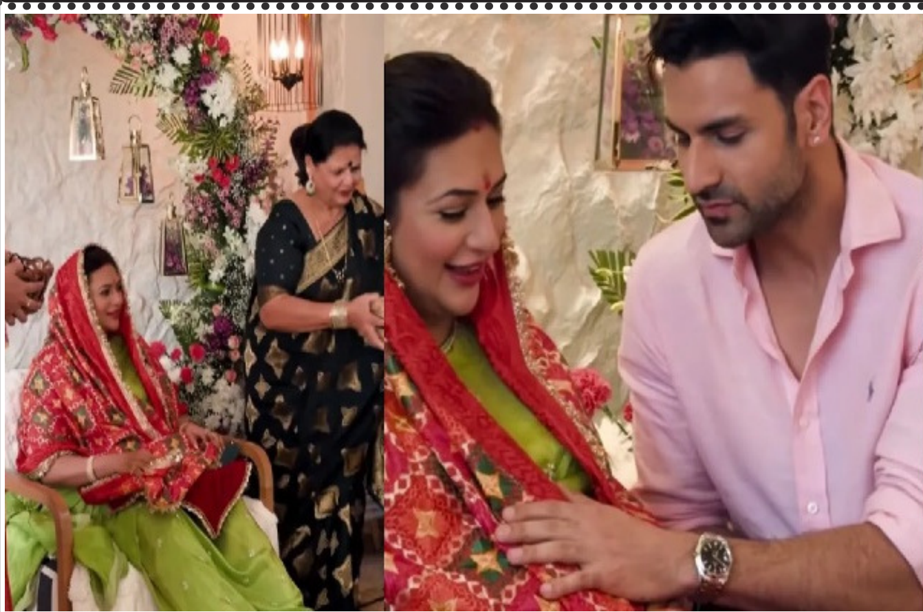
ଚିତ୍ତି ଲକ୍ଷ୍ମଣୀର ଲୋକପ୍ରିୟ ନାୟିକା ଦିବ୍ୟାଙ୍କା ତ୍ରିପାଠୀଙ୍କ ଘରକୁ ଖୁବଶୀଘ୍ର କୁନି ଅତିଥି ଆସିବେ । ବିବାହର ୧୦ ବର୍ଷ । ଦିବ୍ୟାଙ୍କାଙ୍କୁ ନୀଳ

ପରେ ଦିବ୍ୟାଙ୍କା ମା' ହେବେ । ଆଉ ଏଥିପାଇଁ ଦିବ୍ୟାଙ୍କାଙ୍କ ଖୁସି କହିଲେ ନ ସରେ । ଦିବ୍ୟାଙ୍କା ଏବଂ ବିବେକ ଆସିବାକୁ ଥିବା କୁନି ଅତିଥିକୁ ନେଇ ବେଶ୍ ଉତ୍ସାହିତ ରହିଛନ୍ତି । ଆଉ ଏଥିପାଇଁ ବେବି ଶାଝୁର ସେ ରି ମ ନି ଦିବ୍ୟାଙ୍କା ଶ୍ରୀମ କଲର ଶାଢ଼ି ପିନ୍ଧି ଲାଲ ରଙ୍ଗର ଓଡ଼ଣା ପକାଇଛନ୍ତି । ରଙ୍ଗର ରୁଚି ପିନ୍ଧାଉଛନ୍ତି । ଅନ୍ୟ ଅତିଥିମାନେ ଅଭିନେତ୍ରୀକୁ ଉପହାର ଦେଉଛନ୍ତି । ଦିବ୍ୟାଙ୍କାଙ୍କ ଉପରେ ତାଙ୍କର ଘର ଲୋକ ପଇସା ବର୍ଷା କରିଛନ୍ତି । କୁନି ପିଲାକୁ ନେଇ ବିବେକ ବେଶ୍ ଖୁସି ରହିଛନ୍ତି । ଉତ୍ସବରେ ସବୁ ଲୋକ ନାଚୁଥିବାର ନଜର ଆସିଛନ୍ତି । ଦିବ୍ୟାଙ୍କା ବେବିବନ୍ଧୁ ଅରି ତ୍ୟାନ୍ତୁ କରୁଛନ୍ତି । ଏହି ଭିତ୍ତି ଓ ସେୟାର କରି ଅଭିନେତ୍ରୀ ଜଣକ ଲେଖୁଛନ୍ତି, କ'ଣ ହେବ ଯେତେବେଳେ ଆପଣଙ୍କ ପରିବାର, ଭଲପାଇବା ଏବଂ ପାଗଳପଣ ସବୁକିଛି ମିଶ୍ର ହୋଇଯିବ । ଦିବ୍ୟାଙ୍କା ଏବଂ ବିବେକ ୨୦୧୬ରେ ବିବାହ କରିଥିଲେ । ୪୧ ବର୍ଷ ବୟସରେ ମା' ହେବାକୁ ଯାଉଛନ୍ତି ଦିବ୍ୟାଙ୍କା । ଦିବ୍ୟାଙ୍କା ଦୀର୍ଘଦିନକୁ କୌଣସି ଶୋରେ ନଜର ଆସିନାହାନ୍ତି । କାମରୁ ବ୍ରେକ ନେଇ ଦିବ୍ୟାଙ୍କା ଏବେ ମାତୃତ୍ୱ ଉପରେ ଯୋଜ୍ୟ କରୁଛନ୍ତି ।