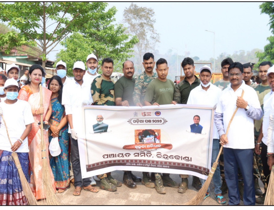
ମାଲକାନଗିରିକୁ ଏକ ନିର୍ମଳ ଓ ପାଇଁ ଜିଲ୍ଲାପାଳ ସମସ୍ତଙ୍କୁ ଆହ୍ୱାନ ସୁନ୍ଦର ଜିଲ୍ଲାରେ ପରିଣତ କରିବା କରିଛନ୍ତି । ଏହି ଅଭିଯାନ ଅଧୀନରେ ଶ୍ରୀ ମଲ୍ଲିକେଶ୍ୱର ମନ୍ଦିର ପରିସରରେ ଅତିରିକ୍ତ