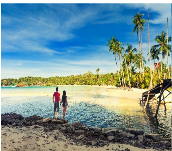
ପର୍ଯ୍ୟଟନସ୍ଥଳ ମଧ୍ୟରେ ଗୋଆ, ନୈନିତାଲ, ରଷିକେଶ, ଗ୍ୟାଙ୍ଗଟକ ଓ ମାଉଣ୍ଡାକୁ ସାମିଲ ରହିଛି । ଗୋଆ ଦୃଷ୍ଟିକୋଣରୁ ଏହା ପ୍ରମାଣିତ ହେଉଛି କି ପାହାଡ଼

ବର୍ତ୍ତମାନ ସମସ୍ତେ ବାହାରି ନିଜ ବ୍ୟସ୍ତତାରୁ ସମୟ ବାହାର କରି ଘର ବାହାରେ ଚିକେ ସମୟ ବିତାଇବା । କିନ୍ତୁ ଅନେକଙ୍କୁ ଜଣାନାହିଁ କି ସେମାନେ କେଉଁଠାକୁ ଯିବେ ବା ଯିବା ଭବିଷ୍ୟତ । ତଳତ ବର୍ଷ ଖରା ସିନିନର ଛୁଟିରେ ପରିବାର ସହ ଚାଲିବା ପାଇଁ ଗୋଆ, ନୈନିତାଲ, ରଷିକେଶ, ଗ୍ୟାଙ୍ଗଟକ ଓ ମାଉଣ୍ଡାକୁ ଏବେ ଟପ ଫାଇଭ ପସନ୍ଦର ପର୍ଯ୍ୟଟନ ଭାବରେ ସାମନାକୁ ଆସିଛି । ଗୁଡ଼ ହସିଟାଲିଟି ଦେଉଥିବା କମ୍ପାନୀ ଓୟାର ଏକ ସଭେରେ ଏହି ଦାବି କରାଯାଇଛି । ଏହି ସଭିଏ ଗ୍ରାହକମାନଙ୍କ ଅବକାଶ ସୁଧ ସୂଚକାଳ ପାରିବାରିକ ସଂସ୍କରଣ ୨୦୨୨ ନାମରେ