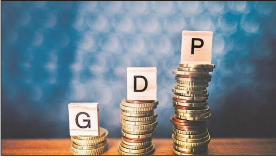
ବିକାଶ ଆକଳନରେ କମିଯାଇଛି । ଭାରତୀୟ ଅର୍ଥନୀତି ପ୍ରତି ରହିଥିବା ବିପଦ ସମ୍ପର୍କରେ ଆଲୋଚନା କରି ଏଡିବି କମିଶନ ଯୁକ୍ତ ଭଳି ଭୂଗୋଳନୈତିକ ସମ୍ପଦ, ଟେକ୍ନୋଲୋଜିରେ ବୃଦ୍ଧି, ଦୁର୍ବଳ ଆର୍ଥିକ ସ୍ଥିତି ଓ ରାଜ୍ୟ ନିୟମ ପାଇବା ଦ୍ୱାରା ଦେଶର ଅର୍ଥନୀତି ପ୍ରଭାବିତ ହେବା ଆଶଙ୍କା ରହିଛି । ତେବେ ୨୦୧୫-୧୬ରେ ଭାରତର ଅଭିବୃଦ୍ଧି

ନୂଆଦିଲ୍ଲୀ: ଏସିଆନ ଡେଭେଲପମେଣ୍ଟ ବ୍ୟାଙ୍କ (ଏଡିବି) ୨୦୧୬-୧୭ ପାଇଁ ଭାରତର ଅଭିବୃଦ୍ଧି ଆକଳନକୁ ୭.୩ ପ୍ରତିଶତକୁ ବୃଦ୍ଧି କରିଛି । ଏହା ଗତ ଡିସେମ୍ବରରେ କରାଯାଇଥିବା ୬.୫ ପ୍ରତିଶତ ଆକଳନ ତୁଳନାରେ ପ୍ରାୟ ୮୦ ପଏଣ୍ଟ ପ୍ରତିଶତ ଅଧିକ । ଅର୍ଥନୈତିକ ସଂସ୍କାର, ସୁରୋପ ସହ ବାଣିଜ୍ୟ ରାଜିନୀମା ଓ ସରକାରୀ କର୍ମଚାରୀଙ୍କ ବେତନରେ ବୃଦ୍ଧି ହେବାକୁ ଯାଉଥିବା ଭାରତରେ ଉପଯୋଗିତା ବୃଦ୍ଧି । ତାହାର ପ୍ରଭାବରେ ଅର୍ଥନୀତିର ଗତି ଉତ୍ତମ ହେବ ବୋଲି ଏଡିବି କହିଛି । ଦ୍ରୁତ ଘରୋଇ ଉତ୍ପାଦନ, ସାବିଜନୀନ ଭିତ୍ତିକ ନିର୍ମାଣରେ ନିବେଶ ଓ ଉନ୍ନତ କର୍ଯ୍ୟାଳୟ ବ୍ୟବସାୟ ପ୍ରଭାବରେ ଭାରତ ବିଶ୍ୱର ଅନ୍ୟତମ ଦ୍ରୁତ ଅଭିବୃଦ୍ଧିଶୀଳ ଅର୍ଥନୀତି ହୋଇ ରହିବ ବୋଲି ଏଡିବି ଏହାର ୨୦୧୬-୧୭ ଏହାର