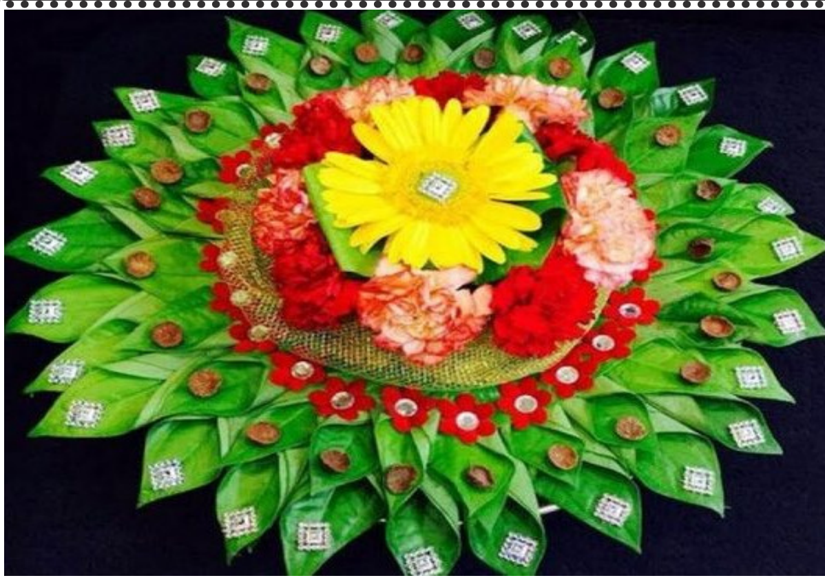
ପାନପତ୍ରକୁ ଖୁବ ଶୁଭ ବୋଲି କୁହାଯାଏ । ଏହାର ପ୍ରୟୋଗ ବିଭିନ୍ନ ଔଷଧ ରୂପରେ ମଧ୍ୟ ବ୍ୟବହାର କରାଯାଏ ।

ଏହା ପାଚନତନ୍ତ୍ରକୁ ସୁସ୍ଥ ରଖୁଥାଏ । ବହୁ ପ୍ରାଚୀନ କାଳରୁ ଏହା ଖୁବ ପବିତ୍ର ବୋଲି ମାନ୍ୟତା ରହିଛି । ବେଦରେ ମଧ୍ୟ ଏହାର ଉଲ୍ଲେଖ ରହିଛି । ପ୍ରତ୍ୟେକ ପୂଜାର୍ଚ୍ଚନାରେ ଏହାକୁ ବ୍ୟବହାର କରାଯାଏ । ପ୍ରତି ଶୁଭକାର୍ଯ୍ୟର ଆରମ୍ଭରୁ ଏହାକୁ ବ୍ୟବହାର କରାଯାଏ । ଦେବୀଙ୍କର ଉପାସନାରେ ପାନ ପତ୍ର ବ୍ୟବହାରର ଏକ ବିଶେଷ ମହତ୍ତ୍ୱ ରହିଛି । ଯାହା ଦ୍ୱାରା ସମସ୍ତ ମନଃମାନା ପୂରଣ ହୋଇଥାଏ । କାଶକୁ, ଗୋଟା ପାନ ପତ୍ର ହେବା ସହ ଏଥିରେ ଏହାର ନାଶି ଲାଗିବା ଆବଶ୍ୟକ । ସାମାନ୍ୟ କଟା କିମ୍ବା ଫଟା ହୋଇନଥିବ ପୂଜାରେ ସମ୍ପୂର୍ଣ୍ଣ ସତେଜ ଓ ସବୁଜ ରଙ୍ଗର ପାନ ପତ୍ର ବ୍ୟବହାର କରିବେ । ଶୀତ୍ର ବିବାହ ପାଇଁ - ସିନ୍ଦୂରରେ ଘିଅ ମିଶାଇ ଦିଅନ୍ତୁ । ପାନପତ୍ରର ଚିକ୍କଣ ଅଂଶ ଉପରେ ଏହି ସିନ୍ଦୂରରେ ନିଜ ନାମ ଲେଖନ୍ତୁ । ମା'ଙ୍କୁ ଅର୍ପଣ କରନ୍ତୁ । ଏହି ଉପାୟ ନବରାତ୍ରରେ ନଅ ଦିନ ଯାଏଁ କରନ୍ତୁ ଶୁଭଫଳ ପ୍ରାପ୍ତି ହେବ । ଧନଲାଭ ପାଇଁ - ନବରାତ୍ର ସମୟରେ ପ୍ରତ୍ୟେକ ଦିନ ସନ୍ଧ୍ୟାରେ ମା'ଲକ୍ଷ୍ମୀଙ୍କୁ କର୍ପୂରରେ ଆଳତୀ କରନ୍ତୁ । ଏହାପରେ ପାନ ପତ୍ରରେ ଗୋଳାପ ଫୁଲର ପାଖୁଡ଼ା ରଖି ମା'ଙ୍କୁ ଅର୍ପଣ କରନ୍ତୁ । ନବରାତ୍ରପରେ ପ୍ରତ୍ୟେକ ପୂର୍ଣ୍ଣିମା ଦିନ ସନ୍ଧ୍ୟା ସମୟରେ ଏହି ଉପାୟ କରନ୍ତୁ । ଏହାଦ୍ୱାରା ଧନସମ୍ପତ୍ତି ବୃଦ୍ଧି ପାଇଥାଏ ।