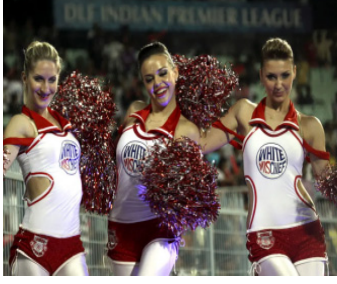
ଏହା ମଧ୍ୟ ଦେଖାଯାଏ ଏବଂ ପ୍ରାଣଜାଳ ସହ ରୁଚି ସ୍ୱାକ୍ଷରିତ ହୋଇଥାଏ । ତେବେ ଅଧିକାଂଶ ଏକେନିଂମାନେ ବିଦେଶୀ ନୃତ୍ୟଶିଳ୍ପୀଙ୍କୁ ଏଥିରେ ସ୍ଥାନ ଦିଅନ୍ତି । ଯଦିଓ କିଛି ଭାରତୀୟ ସ୍ଥାନ ପାଆନ୍ତି ତଥାପି ବିଦେଶୀଙ୍କ ଉପରେ ଧ୍ୟାନ ଦିଆଯାଏ । ମିଳିଥିବା ଏକ ସୂତ୍ରକୁ ଯଦି ବିଶ୍ୱାସ କରିବା ତାହେଲେ ଜଣେ ଚିୟରଗାର୍ଲ ହେବା ପାଇଁ ଦରମାର ଗୋଟିଏ ମ୍ୟାଚ୍ରେ ୧୨ଲୁ ୨୫ ହଜାର ଟଙ୍କା । ଏହାସହ ସେମାନଙ୍କ ଛେତେଲ ଖର୍ଚ୍ଚ, ଯତ୍ନ କର୍ତ୍ତା ଏବଂ ଅନ୍ୟାନ୍ୟ ସୁଧିଧି ମଧ୍ୟ ପ୍ରାଣଜାଳପୋଷାକ । ତେବେ ଏଥିରେ କେଣିଏ ସ୍ଥାୟୀ ନିୟୁତ ହୋଇନାହିଁ । ପ୍ରତିବର୍ଷ ବିଦେଶୀଙ୍କ ଉପରେ ଧ୍ୟାନ ଦିଆଯାଏ । ମିଳିଥିବା ଏକ ସୂତ୍ରକୁ ଯଦି ବିଶ୍ୱାସ କରିବା ତାହେଲେ ଜଣେ ଚିୟରଗାର୍ଲ ହେବା ପାଇଁ

ନୂଆଦିଲ୍ଲୀ ୧୬/୪: ଛକା-ଚୋକା ହେଉ କି ଆଉଟ, ଯେତେବେଳେ ଏକଲି ହୁଏ ନାଟୁଡ଼ି ଚିୟରଗାର୍ଲ । ଆଇପିଏଲ୍ରେ ଏହି ଚିୟରଗାର୍ଲର ଉପରେ ରହିଥାଏ କ୍ୟାମେରା । ମ୍ୟାଚ୍ ସମୟରେ ଏମାନେ ଆକର୍ଷଣୀୟ କେନ୍ଦ୍ରବିନ୍ଦୁ ପାଲଟିଥାନ୍ତି । ତେବେ ଏଥିରେ ବହୁ ବିଦେଶୀ ସୁଦତାମାନେ ଦେଖିବାକୁ ମିଳନ୍ତି । ତେବେ ଏମାନଙ୍କୁ କେମିତି ମିଳେ ସୁଯୋଗ ଯେ କେହି ଜାଣିବେ ସେ କଣ ପ୍ରାଣଜାଳ ସହ କରି ପାରିବ କି ତୁଚ୍ଛ ଏମିତି ଅନେକ ପ୍ରଶ୍ନ ସାଧାରଣତଃ ସମସ୍ତଙ୍କ ମନରେ ଉଠିଥାଏ । ତେବେ ଚିୟରଗାର୍ଲ ହେବା ପାଇଁ କେଣିଏ ଫର୍ମ କିମ୍ବା ବିଶ୍ୱସ୍ତ ପ୍ରକାଶ ପାଇନାହିଁ । ଏବଂ ଏଥିରେ ବିସିସିଆଇ କେଣିଏ ହସ୍ତକ୍ଷେପ ମଧ୍ୟ କରେ ନାହିଁ । ତେବେ ଏହି ଚିୟରଗାର୍ଲ ହେବା ଏତେ ସହଜ ମଧ୍ୟ ନୁହେଁ । ଏହା କେଣିଏ ରିଆଲିଟି ଶୋ'ଠାରୁ ମଧ୍ୟ କମ୍ ନୁହେଁ । ଏହା ଏକ ଏକେନିଂ ମାଧ୍ୟମରେ ଅନଲାଇନରେ କାଷ୍ଟିଂ କିମ୍ବା ଆବେଦନ କରାଯାଏ । ଏହାସହ ନୃତ୍ୟ ଅଭିଯାନ, ଜିତିଓ ଦାଖଲ, ଫିଟନେସ୍ ଏବଂ ସାମିନା ମଧ୍ୟ ପରୀକ୍ଷା କରାଯାଏ । କ୍ୟାମେରା ଆଗରେ କେମିତି ପ୍ରଦର୍ଶନ କରିପାରୁଛନ୍ତି