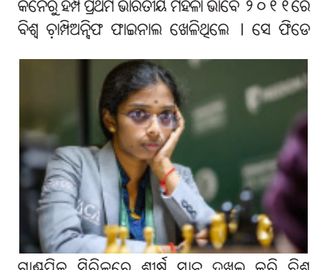
ଗ୍ରାଣ୍ଡପ୍ରିକ୍ ସିରିଜରେ ଶୀର୍ଷ ସ୍ଥାନ ଦଖଲ କରି ବିଶ୍ୱ ଚାମ୍ପିଅନସିପ୍ ଫାଇନାଲ୍ ଯୋଗ୍ୟତା ଅର୍ଜନ କରିଥିଲେ ।

ନୂଆଦିଲ୍ଲୀ, ୧୬/୪: ସାରା ଭାରତ ଆଇପିଏଲ୍ ରୋମାଞ୍ଚରେ ମସଗୁଲ ରହିଥିବାବେଳେ ସବୁ ଆଲୋଚନା ପୂରରେ ରହି ଇତିହାସ ରଚିଛନ୍ତି ଭାରତୀୟ ଚେସ୍ ଖେଳାଳି ତଥା ଗ୍ରାଣ୍ଡମାଷ୍ଟର ଆର ବୈଶାଳୀ । ସାଧୁପ୍ରସାରେ ଚାଲିଥିବା କ୍ୟାଶିଡ଼େଟ୍ ଚେସ୍ ଚାମ୍ପିଅନସିପରେ ମହିଳା ବର୍ଗରେ ଚାମ୍ପିଅନ ହୋଇ ବୈଶାଳୀ ବିଶ୍ୱ ଚେସ୍ ଚାମ୍ପିଅନସିପ୍ ଫାଇନାଲ୍ ଯୋଗ୍ୟତା ଅର୍ଜନ କରିଛନ୍ତି । ଗାଜେଲ ଲଡ଼େଜରେ ସେ ଡିଫେଣ୍ଡିଂ ଚାମ୍ପିଅନ ଚାମ୍ପିୟନ୍ କୁ ଡେଫିଏଟ୍ କରିଛନ୍ତି । ପ୍ରଥମ ଭାରତୀୟ ମହିଳା ଚେସ୍ ଖେଳାଳି ଭାବେ ବୈଶାଳୀ କ୍ୟାଶିଡ଼େଟ୍ ଚେସ୍ ଚାମ୍ପିଅନ ଆଖ୍ୟା ଅର୍ଜନ କରିଛନ୍ତି ଓ ଦ୍ୱିତୀୟ ଭାରତୀୟ ମହିଳା ଖେଳାଳି ଭାବେ ବିଶ୍ୱ ଚାମ୍ପିଅନସିପ୍ ଗାଜେଲ ପାଇଁ ଯୋଗ୍ୟତା ଲାଭ କରିଛନ୍ତି । ତାଙ୍କ ପୂର୍ବରୁ ଗ୍ରାଣ୍ଡ ମାଷ୍ଟର କନେନ୍ଦ୍ର ହାମ୍ପି ପ୍ରଥମ ଭାରତୀୟ ମହିଳା ଭାବେ ୨୦୧୧ରେ ବିଶ୍ୱ ଚାମ୍ପିଅନସିପ୍ ଫାଇନାଲ୍ ଖେଳିଥିଲେ । ସେ ଫିଡ଼େ