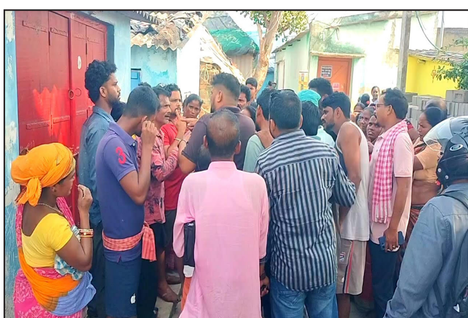
ପରେ ବାହାରେ ସାଇକେଲ ରଖି ଭିତରୁ କବାଟ ଦେଇଦେଇଥିଲେ । ନାବାଳିକାର ମା' ଝିଅ ଘରକୁ ଆସିବା ତେର ହେବା କାରଣରୁ ସାରା ବର୍ଷ ଖୋଜାଖୋଜି କରିବା ପରେ ଶିବମନ୍ଦିର ନିକଟରେ ସାଇକେଲ ଥିବା ଦେଖିବା ସହ ସମସ୍ତଙ୍କୁ ଘଟଣା ବିଷୟରେ ପଚାରି ଥିଲେ । ମୋ ଝିଅକୁ କେହି ଦେଖୁ

ପାରାଦୀପ, (ମହାଭାରତ) : ପାରାଦୀପ ଷଷ୍ଠକୂର୍ ବର୍ଷର ୧୮ ନମ୍ବର ଖୁର୍ଡ ଶିବମନ୍ଦିର ନିକଟରେ ଘଟିଯାଇଛି ଏକ ଅଭାବନୀୟ ଘଟଣା । ଜଣେ ନାବାଳିକାଙ୍କୁ ଘରକୁ ଡାକି ଘର ଭିତରେ ଲୁଚାଇ ରଖିବା ଘଟଣାରେ ଜଣେ ଯୁବକଙ୍କୁ ସ୍ଥାନୀୟ ଲୋକ ନିର୍ଧୁମ ଛେଡ଼ିବା ସହିତ କଟାଧାର ସାମୁଦ୍ରିକ ଥାନା ପୋଲିସକୁ ହସ୍ତଗତ କରିଛନ୍ତି । ସୂଚନା ଅନୁଯାୟୀ ଆଜି ଦିନ ପାଖାପାଖି ଏଗାରଟା ସମୟରେ ଏହି ନାବାଳିକା ଜଣକ ଘରୁ ସାଇକେଲ ନେଇ ଯାଉଥିବା ସମୟରେ ସାଇକେଲରେ ପଟ୍ଟ କମ ଥିବାରୁ ଏକ ଦୋକାନରେ ପଶ ଦେଉଥିଲା । ଏହି ସମୟରେ ଶିବମନ୍ଦିର ନିକଟରେ ପାନ ଦୋକାନ କରି ଥିବା ଜଣେ ଯୁବକ ଏହି ନାବାଳିକା ସହିତ କଥା ହୋଇ ନିଜ ଘରକୁ ଡାକିଥିଲା । ଘରେ ପହଞ୍ଚିବା