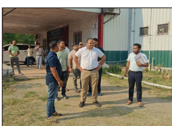
ଦେଖିବା ସହ ପିଲାମାନେ କିଭଳି ପାଠପଢ଼ିବା ପଦ୍ଧତିରୁ ଉର୍ଦ୍ଧ୍ୱକୁ ଯାଇ ଉଚ୍ଚକୋଟୀର ଶିକ୍ଷା ଏବଂ ଅତ୍ୟାଧୁନିକ ସୁବିଧା ସୁଯୋଗ ପାଇଁ ଗୁରୁତ୍ୱ ଦିଆଯାଇଛି । ଏହି ପରିପ୍ରେକ୍ଷାରେ ଜିଲ୍ଲାପାଳ ପ୍ରଥମେ ଅରବିନ୍ଦ ରାଜଶିଳ୍ପ ସ୍ଥାନୀୟ ଏକଲବ୍ୟ ଆଦର୍ଶ ଆଦାସିକ ବିଦ୍ୟାଳୟ ପରିଦର୍ଶନ କରିବା ସହ ସେଠାକାର ଶିକ୍ଷାଦାନ ପଦ୍ଧତି ଓ ବିଦ୍ୟାଳୟର ସାମଗ୍ରିକ ସ୍ଥିତିର ପୂର୍ଣ୍ଣାଙ୍ଗ ପରୀକ୍ଷା କରିଛନ୍ତି । ବିଦ୍ୟାଳୟର ସର୍ବାଙ୍ଗୀନ ବିକାଶ ଏବଂ ଉପାଦାନ ପାଇଁ ଏକ ସ୍ୱତନ୍ତ୍ର କୁ-ପ୍ରିକ୍ସ ବା କାର୍ଯ୍ୟକ୍ରମ ପ୍ରସ୍ତୁତ କରିବାକୁ ସେ ସମର୍ଥନ ଦେଇଛନ୍ତି । ଆଦିବାସୀ ଉନ୍ନୟନ ସଂସ୍ଥାର ପ୍ରକଳ୍ପ ପ୍ରଶାସକଙ୍କୁ କୃତ୍ୱା ନିର୍ଦ୍ଦେଶ ଦେଇଛନ୍ତି । ଜିଲ୍ଲାପାଳ ନିଜ ପରିଦର୍ଶନ ସମୟରେ ବିଦ୍ୟାଳୟର ପ୍ରତିଟି ବିଭାଗକୁ ବୁଲି

ମାଲକାନଗିରି, (ମହାଭାରତ) : ଜିଲ୍ଲାରେ ଆଦିବାସୀ ଛାତ୍ରଛାତ୍ରୀଙ୍କୁ ମିଳିବ ଉଚ୍ଚକୋଟୀର ଶିକ୍ଷା ଏବଂ ଅତ୍ୟାଧୁନିକ ସୁବିଧା ସୁଯୋଗ । ଶିକ୍ଷାର ମାନ ବୃଦ୍ଧି ଏବଂ ଭିତ୍ତିଭୂମିର କାର୍ଯ୍ୟକ୍ରମ ପାଇଁ ଗୁରୁତ୍ୱ ଦିଆଯାଇଛି । ଏହି ପରିପ୍ରେକ୍ଷାରେ ଜିଲ୍ଲାପାଳ ପ୍ରଥମେ ଅରବିନ୍ଦ ରାଜଶିଳ୍ପ ସ୍ଥାନୀୟ ଏକଲବ୍ୟ ଆଦର୍ଶ ଆଦାସିକ ବିଦ୍ୟାଳୟ ପରିଦର୍ଶନ କରିବା ସହ ସେଠାକାର ଶିକ୍ଷାଦାନ ପଦ୍ଧତି ଓ ବିଦ୍ୟାଳୟର ସାମଗ୍ରିକ ସ୍ଥିତିର ପୂର୍ଣ୍ଣାଙ୍ଗ ପରୀକ୍ଷା କରିଛନ୍ତି । ବିଦ୍ୟାଳୟର ସର୍ବାଙ୍ଗୀନ ବିକାଶ ଏବଂ ଉପାଦାନ ପାଇଁ ଏକ ସ୍ୱତନ୍ତ୍ର କୁ-ପ୍ରିକ୍ସ ବା କାର୍ଯ୍ୟକ୍ରମ ପ୍ରସ୍ତୁତ କରିବାକୁ ସେ ସମର୍ଥନ ଦେଇଛନ୍ତି । ଆଦିବାସୀ ଉନ୍ନୟନ ସଂସ୍ଥାର ପ୍ରକଳ୍ପ ପ୍ରଶାସକଙ୍କୁ କୃତ୍ୱା ନିର୍ଦ୍ଦେଶ ଦେଇଛନ୍ତି । ଜିଲ୍ଲାପାଳ ନିଜ ପରିଦର୍ଶନ ସମୟରେ ବିଦ୍ୟାଳୟର ପ୍ରତିଟି ବିଭାଗକୁ ବୁଲି