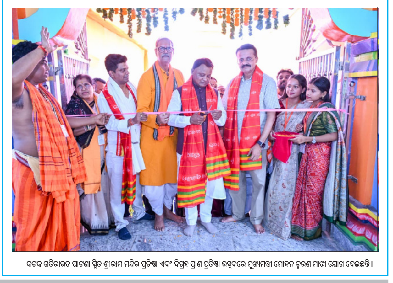
କଟକ ଗତିରାଉତ ପାଖେ ସ୍ଥିତ ଶ୍ରୀମାତା ମନ୍ଦିର ପ୍ରତିଷ୍ଠା ଏବଂ ବିଗ୍ରହ ପ୍ରାଣ ପ୍ରତିଷ୍ଠା ଉତ୍ସବରେ ମୁଖ୍ୟମନ୍ତ୍ରୀ ମୋହନ ଚରଣ ମାଝୀ ଯୋଗ ଦେଇଛନ୍ତି ।

ନିଜର ହକ୍ ପାଉନାହାନ୍ତି ଏବଂ ସେମାନଙ୍କ ସ୍ଥିତି ଦିନକୁ ଦିନ ବିପର୍ଯ୍ୟୟ ହେବାରେ ଲାଗିଛି । ଶ୍ରୀ ପ୍ରଧାନ ଅଭିଯୋଗ କରିଛନ୍ତି ଯେ, ମମତା ବାନାର୍ଜୀଙ୍କ ସରକାର କେବଳ ଭୋଟ୍ ବ୍ୟାଙ୍କ ରାଜନୀତି ପାଇଁ ବାହାର ଦେଶର ଅନୁପ୍ରବେଶକାରୀଙ୍କୁ ପ୍ରଶ୍ନ ସେତେଇଛି, ଯାହା ସ୍ଥାନୀୟ ଲୋକଙ୍କ ଅଧିକାରକୁ ଖୁଣ୍ଟି କରୁଛି । ସେ ଜନସାଧାରଣଙ୍କୁ ଆହ୍ୱାନ ଦେଇ କହିଛନ୍ତି ଯେ, ଆଗାମୀ ନିର୍ବାଚନରେ ବିଜେପି ପ୍ରଥମ ଶ୍ରୀ ବିଜ୍ଞାପ ଯୋଷ୍ଟି ବିପୁଳ ସଂଖ୍ୟାରେ ଭୋଟ୍ ଦେଇ ଜୟଯୁକ୍ତ କରନ୍ତୁ, ଯାହାଦ୍ୱାରା ବଙ୍ଗଳାରେ ପରିବର୍ତ୍ତନର ଲହରୀ ଆସିପାରିବ । ପଶ୍ଚିମବଙ୍ଗର ଜନସାଧାରଣ ଏହି ଅନୁରୋଧ ଓ ଭୟର ଶାସନକୁ ସମାପ୍ତ କରିବା ପାଇଁ ମନସ୍ତୁ କରିସାରିଛନ୍ତି । ଚଳିତ ନିର୍ବାଚନରେ ଜନତା ଭୋଟ୍ ମାଧ୍ୟମରେ ଏହାର ଉଚିତ ଜବାବ ଦେବେ ବୋଲି ଶ୍ରୀ ପ୍ରଧାନ ପ୍ରତ୍ୟକ୍ଷ କରିଛନ୍ତି ।