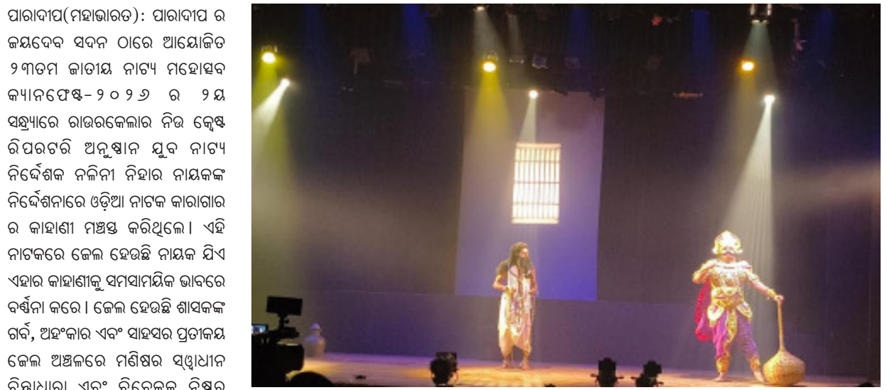
ନୃତନ ଉପାୟର ଉତ୍ସାହୀନାମକ ଉପାୟାୟା ଶାସକ ନିର୍ଦ୍ଦେଶରେ ଅକ୍ତକାର୍ଯ୍ୟ ହୁଏ । କେଳ ଏବଂ ମୁକ୍ତି ମନର ଅଞ୍ଚଳର ଅନ୍ତ କେଳଗୁଡ଼ିକ ତିଆରି ଏବଂ ହେଉଛି ଗୋଟିଏ ମୁହାଁର ଦୁଇଟି ପାର୍ଶ୍ୱ

। ଉପକ ଭାବରେ କହିବାକୁ ଗଲେ, ପ୍ରକୃତ କେଳ ବାହରେ ଅନେକ କେଳ ଅଛି । ଏଗୁଡ଼ିକ ଅଧିକ ଭୟଙ୍କର ଏବଂ ବିଚଳିତକାରୀ । ଏଠାରେ ମଣିଷ ରୂପରେ ଶୟତାନ ବାସ କରନ୍ତି । ମଣିଷର ସ୍ୱାଧୀନ ଚିନ୍ତାଧାରା ସମ୍ପୂର୍ଣ୍ଣ ଭାବରେ ହଜିଯାଇଛି । ଇତିହାସ ଏବଂ ନୀତି ଶାସ୍ତ୍ରରେ କେଳରେ ଲୀନାଯାଇଥିବା ବିପ୍ଳବ ଏବଂ ପରିବର୍ତ୍ତନର ବାକ ଚିତ୍ରିତ ହୋଇଛି ।