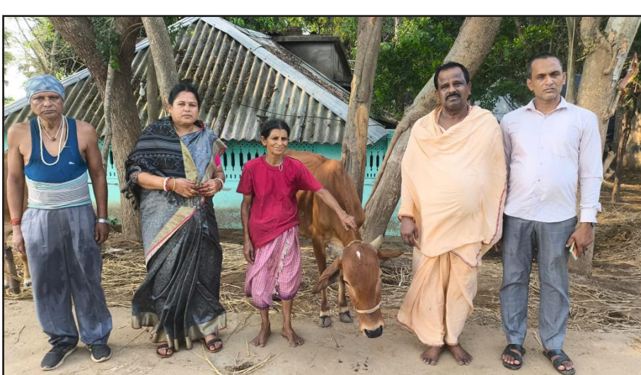
ପ୍ରଶାସନକୁ ଗୋ ଶାଳା ଓ ଅନୁଦାନ ନିମେତ୍ତ ଗୁହାରୀ କରି ଥିଲେ ମଧ୍ୟ ସମ୍ଭବ ହୋଇପାରିନି । ମାଆ ଅନେକ ଦିନ ହେବ ନିରାହାରୀ ଅଛନ୍ତି । ଗୋ ସେବା ଅବହେଳା ପରିଣତି କେତେ ଭୟଙ୍କର ତାହା ର ଅନେକ ଦୃଷ୍ଟାନ୍ତ ରହିଛି । ତେବେ ଶ୍ରୀୟା ମାଆ କ ଆବର୍ତ୍ତମାନରେ ଏହି ୩୦ ଟି ଗୋ ମାତା କ ଦାୟିତ୍ଵ

କରିଥିଲେ । ଗୁରୁଙ୍କ ଉପହାର କୁ ଜୀବନ ର ସର୍ବସ୍ଵ ଭାବେ ଗ୍ରହଣ କରି ଗୋ ସେବା ରେ ମନୋନିବେଶ କଲେ ଶ୍ରୀୟା ମାଆ । ଇତି ମଧ୍ୟରେ ମାଆ କ ଗୋ ଶାଳା ନନ୍ଦିନୀ କ ଉପହାର ରେ ୩୦ ଟି ଗୋ ମାତା ରେ ପରିପୂର୍ଣ୍ଣ । ମାଆ ମଧ୍ୟ ଇତି ମଧ୍ୟରେ ଅତିକ୍ରାନ୍ତ ବୟସ ରେ ଉପନୀତା ନିଜ କାର୍ଯ୍ୟ କରିବାକୁ ତାଙ୍କ ଶରୀର ତାଙ୍କ ସାଥ ଦେଉନାହିଁ । ଗୋ ସେବା ରୁ ମନକୁ ବିତ୍ୟୁତ କରି ପାରୁ ନାହାନ୍ତି ମାଆ । ଆଧୁନିକ ସ୍ତରରୁ ଗୋ ମାତା କ ପୋଖରୀ ନିମେତ୍ତ ଭିକ୍ଷା ବୃଦ୍ଧି କରି ମାଆ । ଗୋ ମାତା ମାନଙ୍କୁ କାହାକୁ ଦେଇ ଦେବା, ବିକ୍ରି କରିବା ସପକ୍ଷରେ ନାହାନ୍ତି ମାଆ । କାରଣ କଂସେଇ ଖାନା କୁ ତାଙ୍କର ଭୟ । ଯା ମଧ୍ୟରେ ଅନେକଙ୍କ ଜରିଆରେ