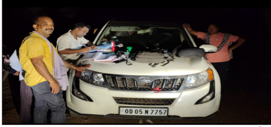
କି ପୁ ନାଏକ (୨୫) ଘର ଚେପିଟିଗାଡ଼ିଆ ବୋଲି ସୂଚନା ମିଳିଛି । ମହିତ୍ର ଏକ୍ସପ୍ଲୋ ୫୦୦ ଓଡ଼ି ୦୫ ଏନ୍ ୭୭୫୭) ଗାଡ଼ିରେ ଫୁଲବାଣୀରୁ ବେକ୍ ରୁକ୍ମାଙ୍କ ଗଞ୍ଜେଇ ନେଇ ହିନ୍ଦୋଳ ଥାନା କଂସରା ଗ୍ରାମ ପଞ୍ଚାୟତ ଆମ୍ବୁଟି ବନଦୁର୍ଗା ମନ୍ଦିର ରାସ୍ତାରେ ଚଢ଼ାଉ କରି ଥିଲେ ।

ହିନ୍ଦୋଳ, (ମହାଭାରତ) : ବେଆଇନ୍ ଗଞ୍ଜେଇ ଚାଲାଣ ବେଳେ ମାଡ଼ି ବସିଲା ଏସଟିଏପ୍ ସିଆଇଟି କ୍ରାଇମ୍ ବ୍ରାଞ୍ଚ ଟିମ୍ । ଦୁଇ ଜଣ ଇନ୍ସପେକ୍ଟରଙ୍କ ସମେତ ମୋଟ୍ ସାତ ଜଣ ଏହି ଚଢ଼ାଉରେ ସାମିଲ ହୋଇଥିଲେ । ହିନ୍ଦୋଳ ଅଞ୍ଚଳର ଦୁଇ ଜଣ ସରକାରୀ କର୍ମଚାରୀଙ୍କୁ ସାକ୍ଷୀ ରଖି ଏହି ଚଢ଼ାଉ କରି ଥିଲେ । ସନ୍ଧ୍ୟା ସାତଟା ସମୟରେ ଆମ୍ବୁଟି ବନଦୁର୍ଗା ମନ୍ଦିର ରାସ୍ତାରେ ଗଞ୍ଜେଇ ଅନଳୋଚିତ ହେଉଥିବା ବେଳେ ବିଶ୍ଵସ୍ଥ ପୁରୁ ଖବର ପାଇ ଟିମ୍ ଚଢ଼ାଉ କରି ଥିଲେ । ଦୁଇ ଜଣ ଘଟଣା ସ୍ଥଳରୁ ଫେରାର ଥିବା ବେଳେ ଟିମ୍ ଜଣଙ୍କୁ ଅଟକ ରଖି ପରାହରଣା କରି ରଖିଛି । ଅଟକ ବ୍ୟକ୍ତିଙ୍କ ନାମ