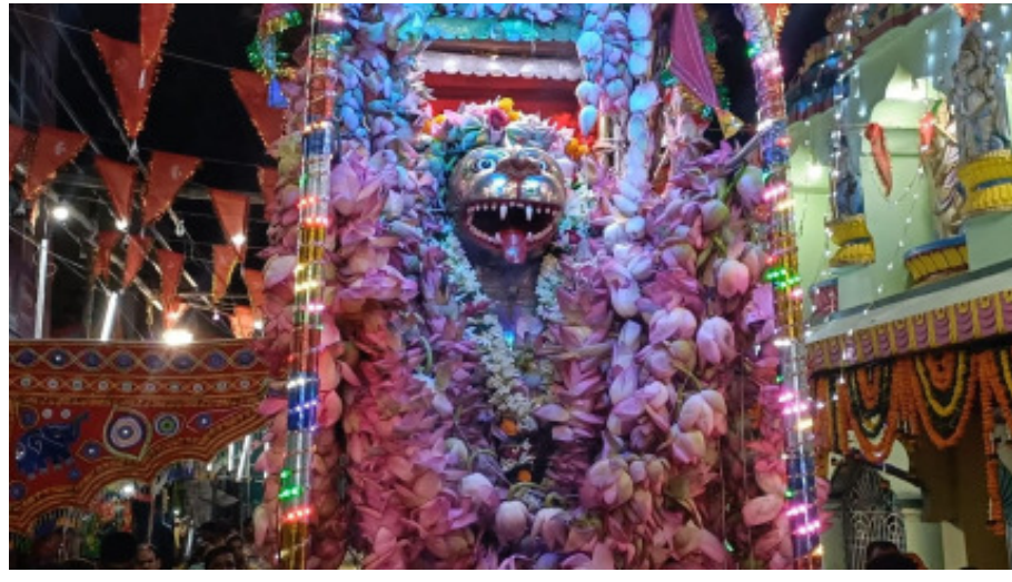
ଶନିବାର ଦିନ ମା ଖମ୍ବେଶ୍ୱରୀଙ୍କ ପକ୍ଷରୁ କାର୍ଯ୍ୟକ୍ରମ ଘଣ୍ଟ, ପୁରୁଣା, ଯାତ୍ରାର ଶେଷ ପର୍ବୁଆର ନଗରବାସୀ ବାଘ ଶକ୍ଷ ଯୋଗା ନାଚ ବିଭିର ଚରିତ୍ର

ଆସିକା(ମହାଭାରତ):ଆସିକା ଅଧିକାଂସ୍ତ୍ରା ଦେବୀ ବିଳେ ମା ଖମ୍ବେଶ୍ୱରୀ ଠାକୁରାଣୀଙ୍କ ଦୈଶାଖ୍ୟ ଯାତ୍ରା ଶେଷ ପର୍ଯ୍ୟାୟରେ । ଏହି ଅବସରରେ ମା ଖମ୍ବେଶ୍ୱରୀ ଘାଟ ନମ୍ବର ୪ ଶରତ ପଞ୍ଚାଙ୍କ ଘର ସମ୍ମୁଖରେ ଅସ୍ତ୍ରାୟୀ ମଣ୍ଡପରେ ସର୍ବସାଧାରଣଙ୍କୁ ଦର୍ଶନ ଦେଇଛନ୍ତି । ମାଙ୍କ ଯାତ୍ରାର ଶେଷ ତଥା ରବିବାର ଦିନ ଅନେକ ସଂସ୍କୃତିକ ଓ ସାମାଜିକ ନାଟକ ଅନୁଷ୍ଠିତ ହୋଇ ୧୫ଦିନିଆ ଦୈଶାଖ୍ୟ ଯାତ୍ରା ସମାପ୍ତ ହୋଇଛି । ରବିବାର ଦିନ ଅସ୍ତ୍ରାୟୀ ମଣ୍ଡପକୁ ମା ବିଳେ କରିବା ପୂର୍ବରୁ ଶନିବାର ରାତ୍ର ତମାମ ଭକ୍ତଙ୍କ ମାନଙ୍କ ସହ ବାଦ୍ୟ ,ବାଣ,ବାଜଣାରେ ମା ଭକ୍ତଙ୍କ ଘର ସମ୍ମୁଖରେ ପୂର୍ଣ୍ଣକ୍ରମ ଦ୍ୱାରା ନିମନ୍ତ୍ରିତ ହୋଇ ଭୋଗ ଓ ପୂଜା ପୂଜା ପାଇଥିଲେ । ମା ମନ୍ଦିର ସମ୍ମୁଖରେ ନାରୀ ସମାଜସେବା ସୁଦାସ୍ତା ଦାଣ୍ଡ ଭକ୍ତଙ୍କୁ ପଣା ବନ୍ଧନ କରିଥିଲେ । ନଗର ପରିକ୍ରମା କରି ମା ଅସ୍ତ୍ରାୟୀ ମଣ୍ଡପରେ ମା ବିଳେ ହେଲା ପରେ ଘର ପ୍ରହାର ପୂଜା ବିଧି କରା ଯାଇଥିଲା । ରବିବାର ଦିନ ତମାମ ବିଭିର ରଙ୍ଗା ରଙ୍ଗ କାର୍ଯ୍ୟକ୍ରମ ମଧ୍ୟରେ ସାମାଜିକ ଓ ସଂସ୍କୃତିକ ଗୀତ ନାଚ ରେ ମା କମ୍ପିଥିଲା । ପୌରାଣିକ ନାଟକ ଯୋଗୁଁ ପ୍ରଶଂସ, ପ୍ରହଲ୍ଲାଦ ନାଟକ ଏବଂ ସାମାଜିକ ନାଟକ ମଧ୍ୟ ମଞ୍ଚସ୍ଥ ହୋଇ ଲୋକଙ୍କୁ ଅଧିକ ମନୋରଞ୍ଜନ କରିଥିଲା ।