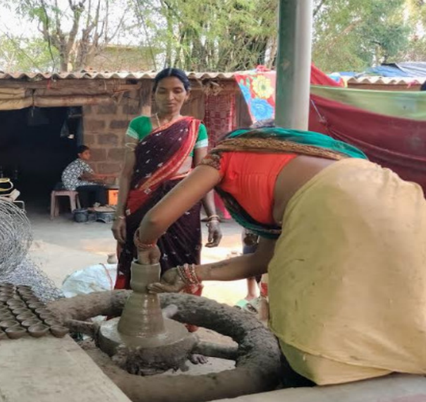
ସେମାନଙ୍କ ବ୍ୟବହାର ସାମଗ୍ରୀ ଯେପରିକି ଏବେ ଅଲୋଡ଼ା ହେଇଯାଇଛି । ସମୟ ର ଚକ୍ର ରେ ଏବେ ମାଟି ପାତ୍ର ସୁରେଇ ର ସ୍ଥାନ ନେଇଛି ଭଲେଲୋଡ଼ି କସ୍ତ ଉତ୍ପାଦନ । ମାଟି ଦାପ ଜାଗାରେ ଭଲେଲୋଡ଼ି ବଳବ ଆଉ ମାଟି ଚୁଲା ଜାଗାରେ ଗାଏବ ଚୁଲା । ଏ ସବୁ ଭିତରେ କିନ୍ତୁ ନିଜର କୌଳିକ ବୃଦ୍ଧି

ଉମରକୋଟ (ମହାଭାରତ)ଦିନ ଥିଲା ତହ ତହ ଗ୍ରାଣ୍ଟ ଦିନରେ ଲୋକେ ଘରେ ଘରେ ମାଟି ରେ ନିର୍ମିତ ସୁରେଇ(ମାଟି ରେ ନିର୍ମିତ ମାଠିଆ ) ବ୍ୟବହାର କରୁଥିଲେ । ଅଥା ପାଣି ପିଇବା ର ତାହା ଥିଲା ମଧ୍ୟ ବିତ ପରିବାର ଠାରୁ ସାଧାରଣ ଲୋକ କ ପ୍ରଥମ ପସନ୍ଦ । ଅଧିକ ପାଣି ଭରିଲେ ଦିନ ତମାମ ପାଣି କୁ ଅଥା ରଖୁଥିଲା ଏହି ମାଟି ପାତ୍ର । ଲୋକେ ସ୍ଥାନୀୟ କୁମ୍ଭୀର ମାନଙ୍କ ହାତ ତିଆରି ମାଠିଆ ପାଇଁ ହାତ ବଢ଼ାଇ ଓ ସେମାନଙ୍କ ଘରୁ କିଣି ଆଣୁଥିଲେ । ଖାଲି ସେତିକି ନୁହେଁ କୁମ୍ଭୀର ମାନଙ୍କ ହାତ ତିଆରି ମାଟିରେ ନିର୍ମିତ ମାଟି ହାଡି, କଳସୀ, ଦାପ ଶିଖା,ଚୁଲା, ପଇସା ସଂଚଳ କୁପି, ପରି ଅନେକ ସାମଗ୍ରୀ ର ବଜାର ରେ ବେଶ ଚାହିଦା ଥିଲା । ଘରେ ପୂଜା ହେଉ ଅଥବା ବିଭାଗର ସବୁଠି ଖୋଳା ପଡୁଥିଲା କୁମ୍ଭୀର ମାନଙ୍କ ର ମାଟି ପାତ୍ର ସାମଗ୍ରୀ । ହେଲେ ଆଗପରି ଆଉ