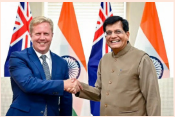
ପ୍ରଧାନମନ୍ତ୍ରୀ ନରେନ୍ଦ୍ର ମୋଦି ଏବଂ ନ୍ୟୁଜିଲାଣ୍ଡର ପ୍ରଧାନମନ୍ତ୍ରୀ କ୍ରିଷ୍ଟିଆନ୍ ହିପିନ୍ସ ଚୁକ୍ତିସ୍ୱାକ୍ଷରଣ କରୁଥିବା ସମୟରେ