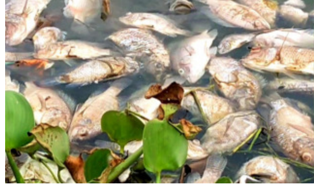
ପାରାଦୀପ(ମହାଭାରତ) ପାରାଦୀପ ବିଭିନ୍ନ ପ୍ରକାର ଚିକିତ୍ସା କୁଡ଼ କୁଡ଼ ମାଛ ବଟନଦୀ ରେ ମାଛ ମଡ଼କ, ଭାସୁଛନ୍ତି । ମାଛ ମଡ଼କ ର କାରଣ ଅକ୍ଷୟ

ରହିଥିବା ବେଳେ କିଛିଦିନ ମଧ୍ୟରେ ପାରାଦୀପ ଅଞ୍ଚଳ ରେ ରହିଥିବା ବିଭିନ୍ନ ନଦୀରେ ମାଛ ମଡ଼କ କୁ ନେଇ ଚିନ୍ତା ପ୍ରକାଶ କରିଛନ୍ତି ପରିବେଶବିତ । ବିଭିନ୍ନ ନଦୀରେ ହେଉଥିବା ମାଛ ମଡ଼କ ସମୟରେ ସ୍ଥାନୀୟ ଆଞ୍ଚଳିକ ପ୍ରଦୂଷଣ ବୋର୍ଡ଼ ଅଧିକାରୀ ହୁଅନ୍ତୁ କିମ୍ବା କର୍ମଚାରୀ ମାନେ ପହଂଚି ପାରିବ ନାହିଁ । କିନ୍ତୁ ଅତ୍ୟଧିକ ଦୂର୍ଗନ୍ଧ କାରଣରୁ ରାସ୍ତାରେ ବାଟ ଝଲିବା କଷ୍ଟକର ହୋଇପଡ଼ିଥିବା ଦେଖି ଅଭିଯୋଗ ଆଣିଛନ୍ତି ସ୍ଥାନୀୟ ବାସିନ୍ଦା ।