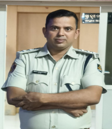
ଅଭିଯୋଗରେ ୬ ଅଭିଯୁକ୍ତଙ୍କୁ ବ୍ୟବସ୍ଥାକୃ କଡାକଡି କରିବାରେ କୃଷ୍ଣପ୍ରସାଦ ପୋଲିସ୍ ଗିରଫ

କୃଷ୍ଣପ୍ରସାଦ, (ମହାଭାରତ) : ପୁରୀ ଜିଲ୍ଲା କୃଷ୍ଣପ୍ରସାଦ ଥାନାରେ ନୂତନ ଅଧିକାରୀ ଭାବେ ବିଡିପ୍ରାନ୍ତର ପ୍ରଧାନ ଯୋଗଦେବା ପର ଠାରୁ ସ୍ଥାନୀୟ ଅଞ୍ଚଳରେ ଆଇନ ଶୁଖିଲା ପରିସ୍ଥିତି ସୃଷ୍ଟିକରିବାରେ ଲାଗିଛି । ଚୋରି, ରାହାଜାନି ଓ ନିଶାଖୋରଣ କାର୍ଯ୍ୟ କଳାପରେ ଏକ ରକମ ପୂର୍ଣ୍ଣହେବ ପଡିଥିବା ବେଳେ ଥାନା ଅଧିକାରୀଙ୍କ କାର୍ଯ୍ୟକଳାକୁ ନେଇ ସାଧାରଣରେ ଚର୍ଚ୍ଚା କୋର ଧରିଛି । କୃଷ୍ଣପ୍ରସାଦ ଥାନା ଅଧିକାରୀଙ୍କୁ ଗୁଲି ମାଡ଼ ମାମଲାର ପର୍ଦାଫାଶ କରି ଘଟଣାରେ ସମ୍ପୃକ୍ତ ଥିବା