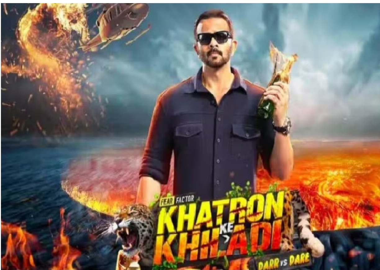
ରୋହିତ ସେନାଙ୍କ ଲୋକପ୍ରିୟ ଶୋ 'ଖତରୋ କେ ଖୁଲାତି' ସିକନ୍ ୧୫ ଖୁବ୍ ଶୀଘ୍ର ଆରମ୍ଭ ହେବାକୁ ଯାଉଛି । କିନ୍ତୁ ଅତିସିଆଲ ଭାବେ ଏପର୍ଯ୍ୟନ୍ତ ସୁଦ୍ଧା ଶୋ'ର ପ୍ରତିଯୋଗୀଙ୍କ ନାଁ ଘୋଷଣା କରାଯାଇନାହିଁ । ହେଲେ କିଛି ସେଲିବ୍ରିଟି ଏବେ ସୋସିଆଲ