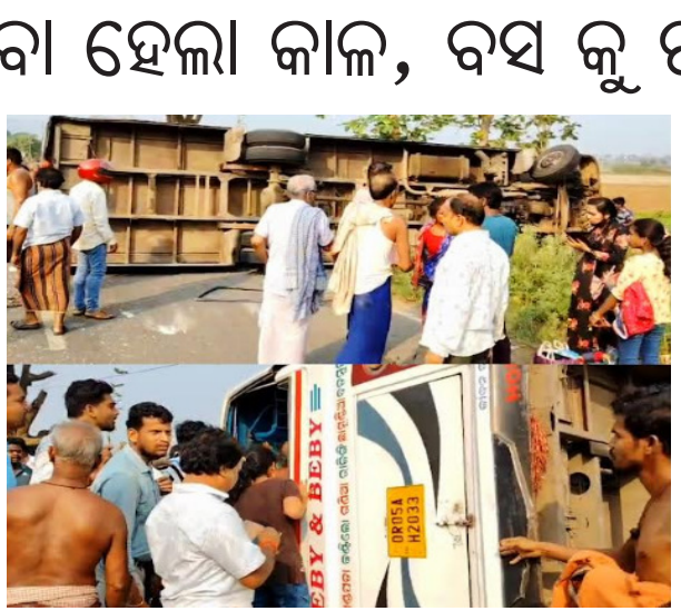
ଦୁର୍ଘଟଣା ପରେ ଘଟଣା ସ୍ଥଳରୁ ଟ୍ରାକଭର ଫେରାର ହେଇଯାଇଛି । ବସ ନିକଟ ରେ ଏକ ସାଲକେଲ ପଡ଼ିଥିବାରୁ ଅନୁମାନ କରାଯାଉଛି କି ସାଲକେଲ ଝଲକ କୁ ବଞ୍ଚାଇବା କୁ ଯାଇ ବସ ଟି ଭାରସାମ୍ୟ ହରାଇ ଓଲଟି ପଡ଼ିଛି । କିନ୍ତୁ ବସ ରେ ବସିଥିବା ଯାତ୍ରୀ କୁ ଟ୍ରାକଭର ଫେରାର ହେଇଯାଇଛି । ବସ ନିକଟ ରେ ଏକ ସାଲକେଲ ପଡ଼ିଥିବାରୁ ଅନୁମାନ କରାଯାଉଛି କି ସାଲକେଲ ଝଲକ କୁ ବଞ୍ଚାଇବା କୁ ଯାଇ ବସ ଟି ଭାରସାମ୍ୟ ହରାଇ ଓଲଟି ପଡ଼ିଛି ।

ନୟାଗଡ଼, ( ମହାଭାରତ ) : ନୟାଗଡ଼ରେ ଯାତ୍ରୀବାହୀ ବସ ଓଲଟି ୨୦ ରୁ ଉର୍ଦ୍ଧ ଆହାତ । ନୟାଗଡ଼ ଖଣ୍ଡପଡ଼ା ରାସ୍ତାର ଖେତପଡ଼ା ଗାଁ ନିକଟରେ ବସ ଓଲଟି ୨୦ ରୁ ଉର୍ଦ୍ଧ ଯାତ୍ରୀ ଆହତ ହୋଇଛନ୍ତି । ଆହତ ମାନଙ୍କୁ ସ୍ଥାନୀୟ ଲୋକ ମାନେ ଉଦ୍ଧାର କରି ୧୦୮ ଆମ୍ବୁଲାନ୍ସ ଓ ଦମକଳ ବାହିନୀ ମଧ୍ୟରେ ନୟାଗଡ଼ ଜିଲ୍ଲା ମୁଖ୍ୟ ଚିକିତ୍ସାଳୟରେ ଭର୍ତ୍ତି କରିଛନ୍ତି । ଆହତ ମାନଙ୍କ ମଧ୍ୟରେ ୩ ଜଣ ଗୁରୁତର ହୋଇଛନ୍ତି । ଗୁରୁତର ଆହତ ମାନଙ୍କୁ ନୟାଗଡ଼ ଜିଲ୍ଲା ମୁଖ୍ୟ ଚିକିତ୍ସାଳୟ ରୁ ଭୁବନେଶ୍ୱର ଏମ୍. କୁ. ସ୍ଥାନାନ୍ତର କରାଯାଇଛି । ସୂଚନା ଅନୁଯାୟୀ ଭାପୁର ବୃକ୍ଷ ରାଜମା ରୁ ଯାତ୍ରୀ ବାହୀ ବସ ଟି ସ୍ଥାନୀୟ ଅଞ୍ଚଳର ପାଖାପାଖି ୫୦ ଜଣ ଯାତ୍ରୀ କୁ ନେଇ ନୟାଗଡ଼ ଆସୁଥିବା ବେଳେ ଘଟଣା ଘଟିବା ନିମନ୍ତେ ନାମକ ବସ ଟି ବାଲୁଗାଁ ନିକଟ ଖେତପଡ଼ା ନିକଟ ରେ ଭାରସାମ୍ୟ ହରାଇ ରାସ୍ତା ପାର୍ଶ୍ୱକୁ ଓଲଟି ପଡ଼ିଲା । ବସ ରେ ଥିବା ୫୦ ରୁ ଅଧିକ ଯାତ୍ରୀ ଉଦ୍ଧାର ହୋଇଥିବା ବେଳେ ୨୦ ରୁ ଅଧିକ ଯାତ୍ରୀ ଗୁରୁତର ଆହତ ହୋଇଛନ୍ତି । ସ୍ଥାନୀୟ ବାସିନ୍ଦା କ ସହାୟତା ରେ ସମସ୍ତ ଯାତ୍ରୀ କୁ ଉଦ୍ଧାର କରାଯାଇଛି । ଆମ୍ବୁଲାନ୍ସ ଯୋଗେ ନୟାଗଡ଼ ଜିଲ୍ଲା ମୁଖ୍ୟ ହସିଡ଼ାଲ କୁ ପଠା ଯାଇଛି ।