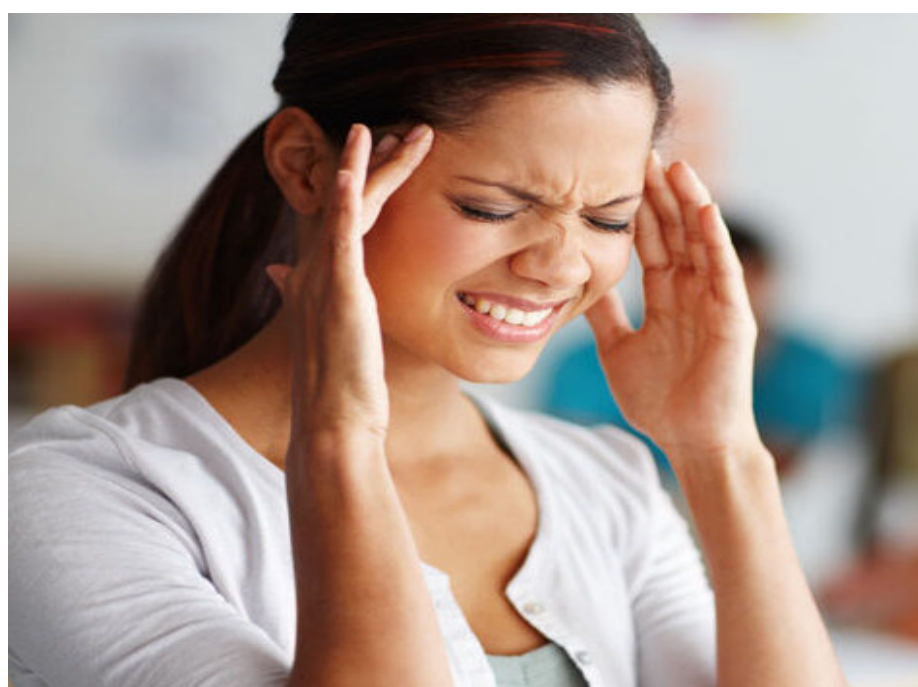
କରିପାରିବା । ମୁଣ୍ଡବିନ୍ଧା ସମସ୍ୟା ଲାଗି ଅଦାଠାରୁ ଆଉ କୌଣସି ଭଲ ଜିନିଷ ନାହିଁ । ଏଥିପାଇଁ ଆପଣଙ୍କୁ ଅଦାକୁ ନେଇ ତାହାକୁ ପାଣିରେ ମିଶାଇ ଭଲ ଭାବରେ ପୂଜାଇବାକୁ ହେବ । ଏହାପରେ ଆପଣ ଏହାକୁ ଛାଣିକରି ଏହାର ପାଣିକୁ ସେବନ କରନ୍ତୁ । ଯଦି ଆପଣ ମୁଣ୍ଡବିନ୍ଧାଜନିତ ସମସ୍ୟା ପାଇଁ ଚିନ୍ତିତ ରହୁଥାନ୍ତି, ତେବେ ଆପଣ କିଛି ଅଦାର ରସ ସହିତ ଲେୟୁ ରସକୁ ମିଳାଇ ଏହାକୁ ଦିନକୁ ଦୁଇ ଥର ଭାବରେ ସେବନ କରନ୍ତୁ । ତୁରନ୍ତ ଆପଣ ମୁଣ୍ଡବିନ୍ଧା ସମସ୍ୟାରୁ ମୁକ୍ତି ପାଇଯିବେ । ଏଥିସହିତ ଯେତେବେଳେ ଆପଣ ମୁଣ୍ଡବିନ୍ଧା ହେଉଥିବାର ଅନୁଭବ କରୁଛନ୍ତି, ସେତେବେଳେ ଆପଣ ଯୋଡିନା ପତ୍ରର ରସକୁ ମୁଣ୍ଡରେ ଲଗାଇ ଦିଅନ୍ତୁ । ଏହା କରିବା ଦ୍ୱାରା ମୁଣ୍ଡବିନ୍ଧା ଦୂର ହୋଇଯିବ । ଏସବୁ ଘରରେ ଉପଚାର ଦ୍ୱାରା ନିର୍ଦ୍ଧିତ ଭଲ ମିଳିବ ।

ଅନେକ ଲୋକ ଅବସାଦ, ନିଦ୍ରାଜନିତ ସମସ୍ୟା ଓ ମୁଣ୍ଡବିନ୍ଧା ଭଳି ଯୁଦ୍ଧ ହେଉଛନ୍ତି । ଅବଶ୍ୟ ଏହା ଖୁବ୍ ସାଧାରଣ ଅଟେ । ଏଥିଲାଗି ଆମେ ଅନେକ ପ୍ରକାରର ସମାଧାନ ପଦ୍ଧତ ଗ୍ରହଣ କରିଥାଉ । ଖାଲି ସେକ୍ସଟିକି ନୁହେଁ, ଆମେ ଔଷଧ ବି ସେବନ କରିଥାଉ । ହେଲେ ଆମେ ଭୁଲି ଯାଇଥାଉ ଯେ ଏଥିରୁ ମୁକ୍ତି ପାଇବା ଲାଗି ଆମ ରୋଷେଇ ଘରେ ଏମିତି ଜିନିଷ ଅଛି ଯାହା ଅବସାଦ, ନିଦ୍ରାଜନିତ ସମସ୍ୟା ଓ ମୁଣ୍ଡବିନ୍ଧା ଭଳି ପୀଡ଼ାରୁ ରକ୍ଷା କରିବ ।