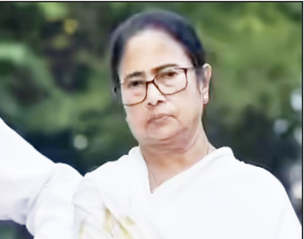
ଉଭୟ କେନ୍ଦ୍ର ସରକାର ଏବଂ ନିର୍ବାଚନ କମିସନଙ୍କୁ ଚାରେଟ କରି ଟିଏମ୍ପି କହିଛି ଯେ ନିର୍ବାଚନ କମିସନ୍ ଏବେ ନିରବଦ୍ୱନ୍ଦ୍ୱ ସାଜିଛନ୍ତି । ବିଜେପି ପଶ୍ଚିମବଙ୍ଗ ପାଇଁ ଏହି ପରିବର୍ତ୍ତନ ଆଣିଛି । ବିଜେପି ପଶ୍ଚିମବଙ୍ଗକୁ 'ଗୋଲି ମାଗେ' ଏବଂ 'ଠୋକ୍ ଦୋ' ସଂସ୍କୃତି ଆଣିବାକୁ ଚେଷ୍ଟା