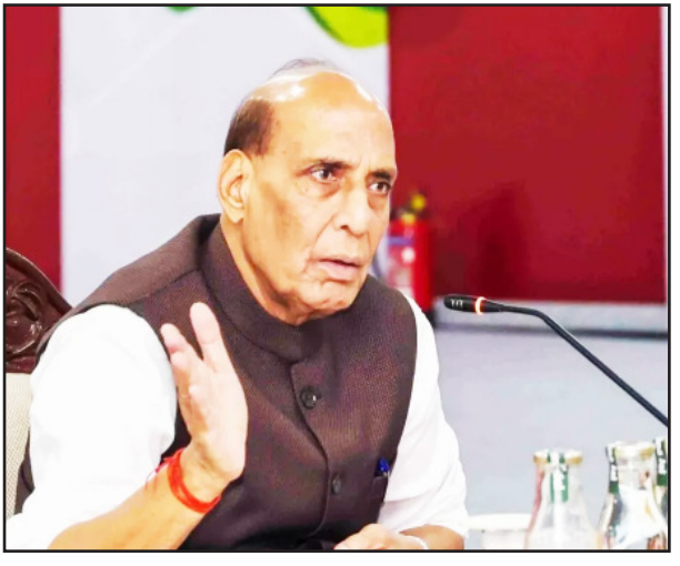
ପରିଶାମ ନୁହେଁ ଆବଶ୍ୟକ ହେଲେ ଭାରତ ଏକ ଦାୟିତ୍ୱାଳୀନ ସଂଘର୍ଷ ପାଇଁ ସମ୍ପୂର୍ଣ୍ଣ ପ୍ରସ୍ତୁତ ଥିଲା । ପ୍ରତିରକ୍ଷା ମନ୍ତ୍ରୀ କହିଛନ୍ତି, ମୁଁ ଏଠାରେ ପୁଣି ଥରେ ଉଷ୍ଣ

ନୂଆଦିଲ୍ଲୀ : ପ୍ରତିରକ୍ଷା ମନ୍ତ୍ରୀ ରାଜନାଥ ସିଂହ ପାକିସ୍ତାନକୁ ଏକ ଉଷ୍ଣ ଏବଂ କଡ଼ା ବାର୍ତ୍ତା ଦେଇଛନ୍ତି ଯେ ଭାରତ କୌଣସି ଆକ୍ରମଣକାରୀ କାର୍ଯ୍ୟକ୍ରମକୁ ସହ୍ୟ କରିବ ନାହିଁ । ସେ କହିଛନ୍ତି, ଅପରେସନ ସିନ୍ଦୂରକୁ ବର୍ଷେ ପୂରଣ ହୋଇଛି ଏବଂ ନୂତନ ବିଶ୍ୱ କ୍ରମରେ ଏହା ଭାରତର ପରିବର୍ତ୍ତନ ନୀତିର ପ୍ରତୀକ ଭାବରେ ଉଭା ହୋଇଛି । ଭାରତ ଆଉ ଏପରି ଏକ ଦେଶ ନୁହେଁ ଯେ, ଆକ୍ରମଣ ଆକ୍ରମଣ ପରେ କେବଳ କୂଟନୈତିକ ବିଦ୍ରୁତ କରି କରିବ । ଅପରେସନ ସିନ୍ଦୂର ବିଶ୍ୱକୁ ଏକ ଉଷ୍ଣ ସଙ୍କେତ ଦେଇଛି ଯେ, ଭାରତ ଏହାର ସୁରକ୍ଷା ପ୍ରସଙ୍ଗରେ ନିର୍ଣ୍ଣାୟକ କାର୍ଯ୍ୟାନୁଷ୍ଠାନ ଗ୍ରହଣ କରିବାକୁ ପଛପୁଆ ଦେବ ନାହିଁ । ପ୍ରତିରକ୍ଷା ମନ୍ତ୍ରୀ ରାଜନାଥ ସିଂହ ପାକିସ୍ତାନକୁ ଚାରେଟ କରି କହିଛନ୍ତି ଯେ ଆଜି ଯେତେବେଳେ ଭାରତ ବିକାଶର ନୂତନ ମାନଦଣ୍ଡ ସ୍ଥାପନ କରୁଛି ଏବଂ ସାରା ବିଶ୍ୱରେ ସୁତନା ପ୍ରସ୍ତୁତିବିଦ୍ୟା (ଆଇଟି) କ୍ଷେତ୍ରରେ ଏକ ବିଶ୍ୱସ୍ତରୀୟ ପରିଚୟ ସୃଷ୍ଟି କରିଛି, ପାକିସ୍ତାନ 'ଦ୍ୱିତୀୟ ଆଇଟି' ଅର୍ଥାତ୍ ଅନ୍ତର୍ଜାତୀୟ ଆତଙ୍କବାଦର କେନ୍ଦ୍ର ପାଲଟିଛି । ରାଜନାଥ ସିଂହ କହିଛନ୍ତି, ଅପରେସନ ସିନ୍ଦୂର ଅପରେସନ ସମୟରେ କେବଳ ଭାରତ ଉପରେ ଆକ୍ରମଣ କରିଥିବା ଶିବିରଗୁଡ଼ିକୁ ଚାରେଟ କରାଯାଇଥିଲା, ଯେତେବେଳେ ପାକିସ୍ତାନ ଭାରତରେ ସାଧାରଣ ନାଗରିକ ଅଞ୍ଚଳ ଉପରେ ଆକ୍ରମଣ କରିବାର ଚୁକ୍ତିକାର୍ଯ୍ୟ କରିଥିଲା । ସେ ଏହା ମଧ୍ୟ ଉଷ୍ଣ କରିଛନ୍ତି ଯେ, ଅପରେସନ ବନ୍ଦ କରିବା ଭାରତର ରଣନୈତିକ ପଦ୍ଧତି ଥିଲା, ଦୁର୍ଭିକାର