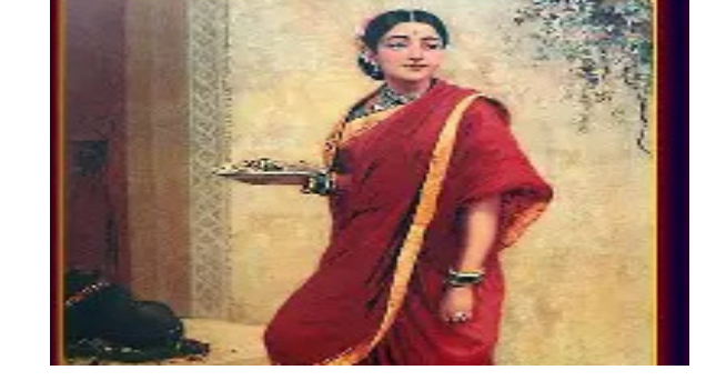
ରହିଥାଏ । ଆମ ପାଖରେ ଯେଉଁ ଧନ ରହିଛି ତାହା ଭଗବାନଙ୍କର । ଯେଉଁଠି ଦୁଃଖ, ଅଭାବ ଦେଖାଦେଇଛି, ସେଠାରେ ଆମକୁ ଆସି ଧନ ଅର୍ପଣ କରାଯିବା ଆବଶ୍ୟକ । ଧନ ଭଗବାନଙ୍କର ହୋଇଥିବାରୁ, ଏହା ସେମାନଙ୍କର ପୁଣ୍ୟ ପ୍ରସାଦ ଅଟେ । ତାହାକୁ ପ୍ରସାଦ ଭଳି ଗ୍ରହଣ କରିବା ଏବଂ ବାଣ୍ଟିବା ଉଚିତ୍ ।

ବର୍ତ୍ତକ ମଧ୍ୟରେ ଯେଉଁ ପାପଗାର ଏବଂ ଭ୍ରଷ୍ଟତାର ବହୁଛି, ତା'ର ଗୋଟିଏ କାରଣ ହେଉଛି ଅଧର୍ମ ଉପାୟରେ ଅର୍ଜିତ ଧନ । ସେଥିପାଇଁ ସାତ୍ତ୍ଵିକ ସାଧନରେ ଅର୍ଜିତ ଧନର କିଛି ଅଂଶ ଦାନ ସେବା ପରୋପକାରରେ ବିନିଯୋଗ କରିବା ଆବଶ୍ୟକ । ଦାନ, ସଦାଚାର ଏବଂ ତ୍ୟାଗବୃତ୍ତିର କାରଣରୁ ଧନର ପବିତ୍ରତା ବଳାୟ