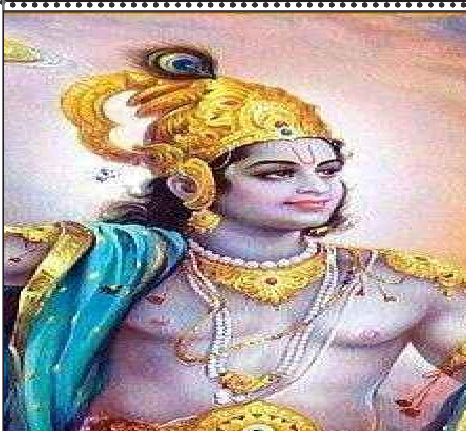
ଧର୍ମୀମାନଙ୍କୁ ବ୍ୟକ୍ତି ସର୍ବଦା ପାଳି ଧର୍ମାତରଣର ଚିହ୍ନ ଅଙ୍କିତ କରିଚାଲିବ । ସେ ବ୍ୟକ୍ତିଗତ ଜୀବନରେ ଅନ୍ୟାୟ କରିବ ନାହିଁ କିମ୍ବା ଅନ୍ୟାୟ ସହିବ ନାହିଁ । ସେ

ଧାର୍ମିକ ଜୀବନରେ ମଧ୍ୟ କୌଣସି ଅନ୍ୟାୟ କରିବ ନାହିଁ । ଯେଉଁ ଦିଗରେ ଅନ୍ନ, ବସ୍ତ୍ର, ଶିକ୍ଷା, ଚିକିତ୍ସା ବ୍ୟବସ୍ଥା ଥିବ ସେ ସେହି ଦିଗ ପ୍ରତି ଗୁରୁତ୍ୱଦେବ । ଦ୍ୱାପର ଯୁଗରେ ଭଗବାନ ଶ୍ରୀକୃଷ୍ଣ ଅବତାର ନେଇଥିଲେ । ସେ ସମୟରେ ସାରା ଭାରତ ଛୋଟ ଛୋଟ ରାଜ୍ୟରେ ବିଭକ୍ତ ହୋଇ ରହିଥିଲା । ଛୋଟ ଛୋଟ ରାଜ୍ୟ କେବଳ ପରସ୍ପର ସହ ସମତା ପାଇଁ ସଂଘର୍ଷ କରୁଥିଲେ । ଚାରିଆଡ଼େ ଅଧର୍ମ ଖେଳି ଯାଇଥିଲା । କେହି କାହାରିକୁ ସହିପାରୁନଥିଲେ । ଯୁଦ୍ଧ ଏବଂ ସଂଘର୍ଷରେ ସର୍ବଦା ବ୍ୟସ୍ତ ରହୁଥିବାରୁ ଲୋକ କଲ୍ୟାଣ ପାଇଁ ରାଜାମାନେ ଗୁରୁତ୍ୱ ଦେଉନଥିଲେ । ତତ୍କାଳୀନ ରାଜାମାନେ ସାମ୍ରାଜ୍ୟବିସ୍ତାର ଲାଳସାରେ ନାନା ଅଧର୍ମ କରୁଥିଲେ । ସର୍ବଦା ଯୁଦ୍ଧ ଲାଗି ରହୁଥିବାରୁ ଧନକାବନ ବିପନ୍ନ ହେଉଥିଲା । ବଡ଼ ରାଜାମାନେ ଅତ୍ୟାଚାରୀ ହୋଇପଡ଼ି ଥିଲେ । ଛୋଟ ରାଜାମାନେ ଆତ୍ମରକ୍ଷା କରିବାରେ ଅସମର୍ଥ ଥିଲେ, ତେଣୁ ଜନକଲ୍ୟାଣ କରିବା ମଧ୍ୟ ସେମାନଙ୍କ ସାମର୍ଥ୍ୟ ବାହାରେ ଥିଲା । ତେଣୁ ସମସ୍ତଙ୍କୁ ଏକ ଗୋଟିଏ ସୂତ୍ରରେ ବାନ୍ଧି ଧର୍ମରାଜ୍ୟ ସ୍ଥାପନ କରିବାକୁ ହୋଇପଡ଼ିଥିଲା । ଖଣ୍ଡ ଖଣ୍ଡ ହୋଇ ବିଭାଜିତ ଭାରତକୁ ଏକତ୍ର କରିବା, ଏବଂ ଏକ ସ୍ୱୟଂସମ୍ପୂର୍ଣ୍ଣ ରାଷ୍ଟ୍ର ନିର୍ମାଣ କରି ମନୁଷ୍ୟଜାତିକୁ ଏକ ନୂତନ ପଥ ଦେଖାଇବା ଉଦ୍ଦେଶ୍ୟରେ ଭଗବାନ ଶ୍ରୀକୃଷ୍ଣ ଗୁରୁଦାୟିତ୍ୱ ବହନ କରିଥିଲେ । ସେ ପ୍ରଥମେ ସମସ୍ତ ଧର୍ମଗୁଣ୍ଡି ସମ୍ପନ୍ନ ରାଜା ଏବଂ ସାଧାରଣ ଜନତାଙ୍କୁ ଏକତ୍ର କରିବାର ପ୍ରୟାସ କରିଥିଲେ । ଅଜ୍ଞ, ବଜ୍ର, କଳିଙ୍ଗ, ସୌରାଷ୍ଟ୍ର, ମଗଧ ଆଦି ଛୋଟ ଛୋଟ ରାଜ୍ୟକୁ ଗୋଟିଏ ସାମ୍ରାଜ୍ୟ ଅଧୀନକୁ ଆଣି ଏକ