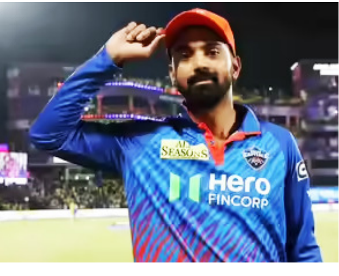
ରାହୁଲ କହିଛନ୍ତି ସେ ତାଙ୍କ କ୍ୟାରିଅରରେ ଅନେକ ଉତ୍ସାହ-ପତନ ଦେଖିଛନ୍ତି । ତାଙ୍କୁ ଯେବେ ଭାରତୀୟ ଦଳର ଅଧିନାୟକ ହେବାର ସୁଯୋଗ ମିଳିଛି ସେ ନିଜ ସର୍ବଶ୍ରେଷ୍ଠ ପ୍ରଦର୍ଶନ କରିବା ପାଇଁ ଚେଷ୍ଟା କରିଛନ୍ତି । ସେ ସେହି ଭାବେ ନିଜକୁ ପ୍ରସ୍ତୁତ କରିଛନ୍ତି, ଯେଉଁଭଳି ସେ ନିଜକୁ ସର୍ବଶ୍ରେଷ୍ଠ ଖେଳାଳି ଭାବେ ଗଢିତୋଳିବେ । ଏହି ସମୟ ମଧ୍ୟରେ ସେ ଶିଖରୁଦ୍ଧ ପାଇଛନ୍ତି କି କିଭଳି ଖରାପ ସମୟରେ ନିଜ ଦୃଷ୍ଟିକୋଣକୁ ବଳାୟ ରଖିବେ । ସେ କହିଛନ୍ତି ‘ମୁଁ ଯେତେବେଳେ ଏହି କଥାକୁ ନେଇ ଦୃଷ୍ଟି ଅନୁଭବ କଲେ ସେତେବେଳେ କଣ ନକରିପାରିଛି ତାହା ଚିନ୍ତା କରିବା ପରିବର୍ତ୍ତେ କଣ ହାସଲ କରିଛି ତାହା ଉପରେ ଅଧିକ ଗୁରୁତ୍ୱ ଦିଏ ।

ଭାବେ ଚୟନ କରାଯାଇଛି । ତେଣୁ ଏହି ଚିନ୍ତାଧାରାକୁ ବଦଳାଇବା ପାଇଁ, ମୁଁ ଧଳା ବଲ ପାଇଁ ମୋ ଖେଳରେ ଅନେକ ଉନ୍ନତି ଆଣିଛି ଓ ଏହି ସ୍ତରରେ ପହଞ୍ଚିବା ପାଇଁ ମୁଁ ଗର୍ବିତ । ଏହି ସମୟରେ ମୁଁ ଅନେକ ଭୁଲ ମଧ୍ୟ କରିଛି, ଯାହା ମୁଁ ଆହୁରି ଭଲ କରିପାରିଥାନ୍ତି ।’