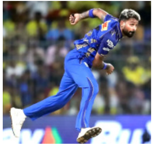
ମୁମ୍ବାଇ ଫେରିବା ଅପେକ୍ଷା ଆହୁରି ଆଶ୍ଚର୍ଯ୍ୟଜନକ ଥିଲା ଯେ ପ୍ରୋକ୍ସିଟିଭ୍ ରୋହିତ ଶର୍ମାଙ୍କ ସ୍ଥାନରେ ହାର୍ଦ୍ଦିକ ପାଣ୍ଡ୍ୟାଙ୍କୁ ଅଧିନାୟକ କରିଥିଲା । ହାର୍ଦ୍ଦିକ ଏହି ସର୍ତ୍ତରେ ମୁମ୍ବାଇ ଫେରିଥିବା ନେଇ ଚର୍ଚ୍ଚା ଜୋର ଧରିଥିଲା ଏବଂ ଏହାକୁ ବ୍ୟାପକ

ନୂଆଦିଲ୍ଲୀ, ୬: ମୁମ୍ବାଇ ଇଣ୍ଡିଆନ୍ସ ଆଇପିଏଲ ୨୦୨୬ ପାଇଁ ଚୋପାଟି ଶୁଭରୁ ପ୍ରାୟ ବାହାର ହୋଇଗଲାଣି । ସେମାନେ ସେମାନଙ୍କର ବାକି ଚାରୋଟି ମ୍ୟାଚ ଜିତିଲେ ବି, ସେମାନେ କେବଳ ୧୪ ଏଏସ ପାଇପାରିବେ । ହାର୍ଦ୍ଦିକ ପାଣ୍ଡ୍ୟାଙ୍କ ଅଧିନାୟକତ୍ୱରେ ଏମଆଇ (ମୁମ୍ବାଇ ଇଣ୍ଡିଆନ୍ସ) ର ପ୍ରଦର୍ଶନ ଭଲ ରହିନାହିଁ, ଯଦିଓ ତାଙ୍କୁ ରୋହିତ ଶର୍ମାଙ୍କ ବଦଳରେ ଅଧିନାୟକ କରାଯାଇଥିଲା ଏ ଆପାତ ଯୋଗୁଁ ରୋହିତ ସାମ୍ପ୍ରତିକ ଅନେକ ମ୍ୟାଚ ଖେଳି ନାହାଁନ୍ତି । ସେ ଶେଷ ମ୍ୟାଚ ଖେଳିଛନ୍ତି ଯେତେବେଳେ ହାର୍ଦ୍ଦିକଙ୍କ ସ୍ଥାନରେ ସୁର୍ଯ୍ୟକୂମାର ଯାଦବ ଅଧିନାୟକ ଭାବରେ ଦାୟିତ୍ୱ ନେଇଥିଲେ ।