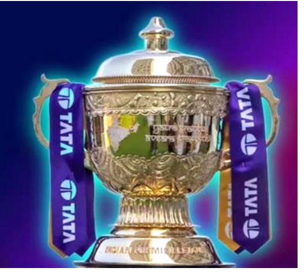
ପ୍ରତ୍ୟେକ ମଙ୍ଗଳବାର ମେ ୬ରେ ଧର୍ମଶାଳାରେ ପ୍ରଥମ କ୍ୱାର୍ଟିଫାଇନାଲ ଖେଳାଯିବ । ଏହି ମ୍ୟାଚରେ ଦଳ ସିଧାସଳଖ ଫାଇନାଲରେ ପ୍ରବେଶ କରିବ । ହାରିବା ଦଳ କ୍ୱାର୍ଟିଫାଇନାଲ ୨ ଖେଳିବ । ରୂପସାର ମେ ୬ରେ ନ୍ୟୁଡେଲିଗରେ ଏଲିମିନେଟର ମ୍ୟାଚ ଖେଳାଯିବ । ଏହି ମ୍ୟାଚ ଜିତିବା ଦଳ କ୍ୱାର୍ଟିଫାଇନାଲ ୨ରେ କ୍ୱାର୍ଟିଫାଇନାଲ ୧ରେ ପରାଜିତ ଦଳ ଖେଳିବ । ମେ ୩୧ରେ ଅହମ୍ମଦବାଦରେ ଫାଇନାଲ ମ୍ୟାଚ୍ ଖେଳାଯିବ । ଆଇପିଏଲ୍ ୨୦୨୬ର ଦଳ ସିଧାସଳଖ ଫାଇନାଲରେ ପ୍ରବେଶ କରିବ । ହାରିବା ଦଳ କ୍ୱାର୍ଟିଫାଇନାଲ ୨ ଖେଳିବ । ରୂପସାର ମେ ୬ରେ ନ୍ୟୁଡେଲିଗରେ ଏଲିମିନେଟର ମ୍ୟାଚ ଖେଳାଯିବ । ଏହି ମ୍ୟାଚ ଜିତିବା ଦଳ କ୍ୱାର୍ଟିଫାଇନାଲ ୨ରେ କ୍ୱାର୍ଟିଫାଇନାଲ ୧ରେ ପରାଜିତ ଦଳ ଖେଳିବ । ମେ ୩୧ରେ ଅହମ୍ମଦବାଦରେ ଫାଇନାଲ ମ୍ୟାଚ୍ ଖେଳାଯିବ ।