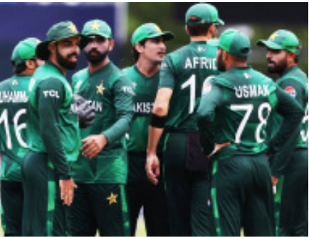
ପ୍ରତିକ୍ରିୟା ଏନେଇ ମିଳିନାହିଁ । କହି ରଖୁଛନ୍ତି କି, ଭାରତ ଏବଂ ପାକିସ୍ତାନ ସମ୍ପ୍ରତି ଦୁଇଟି ଉଦ୍ଦତ ଚୁଷ୍ଟିମେଣ୍ଟ ପାଇଁ ପରସ୍ପର ଦେଶ ଯାତ୍ରା କରିନାହାନ୍ତି । ପାକିସ୍ତାନ ଚାହୁଁଥିବା ଅଧିକାରୀଙ୍କ କହିଥିଲେ, କିନ୍ତୁ ଭାରତୀୟ ଦଳ ଚଳଣରେ ଏହାର ମ୍ୟାଚ ଖେଳିଥିଲା । ଭାରତ ଅଧିକାରୀ କହିଥିବା ୨୦୨୬ ଟି ୨୦ ବିଶ୍ୱକପ ପାଇଁ ପାକିସ୍ତାନ ଭାରତ ଯାତ୍ରା କରିନାହାନ୍ତି । ପାକିସ୍ତାନ ଚାହୁଁଥିବା ମ୍ୟାଚ ଖେଳିବାରେ ଖେଳିଥିଲା । ଭାରତୀୟ ଦଳକୁ ପାକିସ୍ତାନ ବିପକ୍ଷରେ ଖେଳିବା ପାଇଁ ଶୁଳ୍କା ଯାତ୍ରା କରିବାକୁ ପଡିଥିଲା । ତେଣୁ, ପାକିସ୍ତାନୀ ଦଳ ଭାରତ ଯାତ୍ରା କରିବ କି ନାହିଁ ତାହା ଏକ ପ୍ରଶ୍ନ ପ୍ରଶ୍ନ । ବର୍ତ୍ତମାନର ପରିସ୍ଥିତିକୁ ଦୃଷ୍ଟିରେ ରଖି, ଏହା ଅସମ୍ଭବ ।

ନୂଆଦିଲ୍ଲୀ, ୬: ଦୁଇ ପାରମ୍ପରିକ ପ୍ରତିଦ୍ୱନ୍ଦା ଭାରତ-ପାକିସ୍ତାନ ସମ୍ପର୍କ ସମସ୍ତଙ୍କୁ ବେଶ୍ ଭଲଭାବେ ଜଣା । ଉଭୟ ଦେଶ ମଧ୍ୟ ଦୀର୍ଘବର୍ଷ ହେବ ଦ୍ୱିପାର୍ଶ୍ୱିକ ସିରିଜ ଖେଳାଯାଇନାହିଁ । ଉଭୟ ଦେଶ ମଧ୍ୟରେ କେବଳ ଆଇସିସି ଚୁଷ୍ଟିମେଣ୍ଟ ଏବଂ ଏସିଆ କପରେ ଭେଟୁଛନ୍ତି । ଦୁଇ ଦେଶର ମ୍ୟାଚ ଦେଖିବା ପାଇଁ ବିଶ୍ୱ ସବୁବେଳେ ଚାହିଁ ରହିଥାଏ । ତେବେ ପାକିସ୍ତାନୀ କ୍ରିକେଟର ଭାରତରେ ଖେଳିପାରିବେ । ଏନେଇ ସରକାରଙ୍କ ପକ୍ଷରୁ ବଡ଼ ଯୋଷଣା କରାଯାଇଛି ।