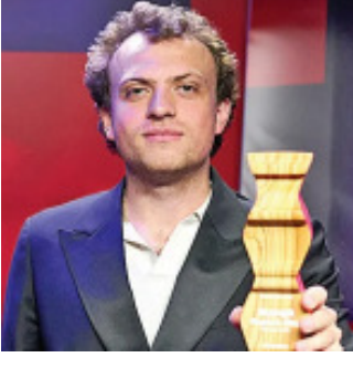
ସପ୍ତମ ସ୍ଥାନରେ ରହିଥିଲେ। ଅଧିକ ତଥା ୨୭ତମ ରାଉଣ୍ଡରେ ଆଜି ଗୁଜେଶ୍ୱର ପୋଲିଣ୍ଡର କାନ-କିର୍ଣ୍ଣୋସ୍ ଚୁଡ଼ାକ୍ତ ହୋଇଥିଲେ। ସେହିପରି ସୋ ବିଶ୍ୱ ଚାମ୍ପିୟନ୍ ସିଣ୍ଡାଗୋଭଲ୍, କାରୁଆନା ସେଲେନିଆର ଭୁବିନିର ଫେଡୋସିଭଲ୍, ପ୍ରାନ୍ତର ଅଲିଭେରା ଫିରୋକା ନିଜ ଦେଶର ମ୍ୟାଟ୍ରିକ୍ ଭିତ୍ତରେ-ଲାଗ୍ରୋଭଲ୍ ଏବଂ ନିମାନ ପୋଲିଣ୍ଡର ରାଡୋସ୍ ଉପକ୍ରମରେ ପରାସ୍ତ କରିଥିଲେ।

ଆଦିଲ୍ଲୀ, ୧୦/୦୫: ପୋଲିଣ୍ଡରେ ଆୟୋଜିତ ଗ୍ରାଣ୍ଡ ଚେମ୍ପିୟନ୍ (ସୁପର ରାପିଡ୍ ଏବଂ ବିଲ୍) ପୂର୍ଣ୍ଣାଙ୍ଗେଶ୍ୱର ଆମେରିକୀୟ ଗ୍ରାଣ୍ଡମାଷ୍ଟର ହାନ୍ଦ ନିମାନ ଚାମ୍ପିୟନ୍ ହୋଇଛନ୍ତି। ୨୭ ରାଉଣ୍ଡ ବିଶିଷ୍ଟ ପୂର୍ଣ୍ଣାଙ୍ଗେଶ୍ୱର ନିମାନ ସର୍ବାଧିକ ୨୨.୫ ପଏଣ୍ଟ ସହ ପ୍ରଥମ ସ୍ଥାନରେ ରହିଥିଲେ। ଅନ୍ୟ ଆମେରିକୀୟ ଗ୍ରାଣ୍ଡମାଷ୍ଟର ଫାବିଆନୋ କାରୁଆନା ୨୨ ପଏଣ୍ଟ ସହ ଦ୍ୱିତୀୟ, ଡେସଲି ସୋ ୨୧ ପଏଣ୍ଟ ସହ ତୃତୀୟ ସ୍ଥାନ ଅଧିକାର କରିଥିଲେ। ବିଶ୍ୱ ଚାମ୍ପିୟନ୍ ଭାରତୀୟ ଗ୍ରାଣ୍ଡମାଷ୍ଟର ଡି. ଗୁଜେଶ୍ୱର ମୋଟ ୧୭ ପଏଣ୍ଟ ସହ ତାଲିକାରେ ଷଷ୍ଠ ଏବଂ ଉଚ୍ଚବେକିଣ୍ଡାନ୍‌ର ଜାଭୋଶ୍ୱର ବିଶାରେ ୧୬.୫ ପଏଣ୍ଟ ସହ