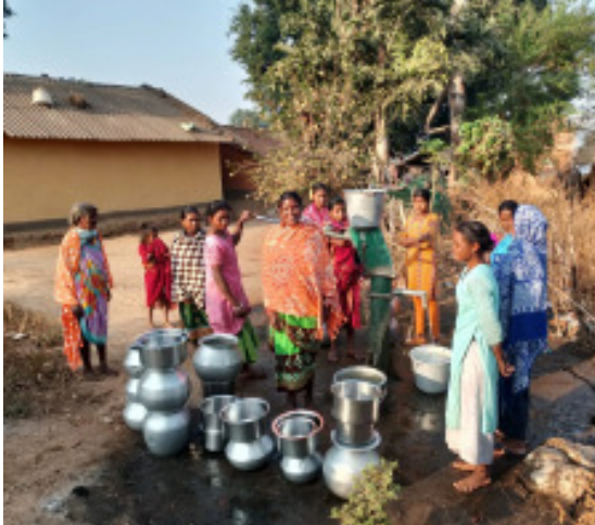
ନଥିବା ଯୋଗୁଁ ଗ୍ରାମର ଛାତ୍ରଛାତ୍ରୀମାନଙ୍କ ପାଠପଢ଼ାରେ

ଝରିଗାଁ : ନବରଞ୍ଜପୁରଜିଲ୍ଲା ଝରିଗାଁ ବୁକ୍ କୁର୍ଡ଼ିଛାପର ପଞ୍ଚାୟତ ଅନ୍ତର୍ଗତ ତେନ୍ତୁଳିପଡ଼ା ଗ୍ରାମ ସ୍ଥାପନର ୪୫ ବର୍ଷ ପରେ ମଧ୍ୟ ବିଭିନ୍ନ ସମସ୍ୟା ରହିଛି । ଝରିଗାଁ ବୁକ୍ ଠାରୁ ୭ କିଲୋମିଟର ଦୂରରେ ଥିବା ବେଳେ ପଞ୍ଚାୟତ ଠାରୁ ୫ କିଲୋମିଟର ଦୂରରେ ଅବସ୍ଥିତ । ଉକ୍ତ ଗ୍ରାମରେ ପ୍ରାୟ ୧୫ ପରିବାର ରହୁଥିବା ବେଳେ ସମସ୍ତେ ପ୍ରାୟ ଋଷ ଉପରେ ନିର୍ଭର କରୁଛନ୍ତି । ପ୍ରଶାସନ ପକ୍ଷରୁ ରେଖାମାଳ ଗ୍ରାମ ପର୍ଯ୍ୟନ୍ତ ପକ୍କା ରାସ୍ତା ନିମାଣ ହୋଇ ଥିବା ବେଳେ ରେଖାମାଳ ଗ୍ରାମ ଠାରୁ