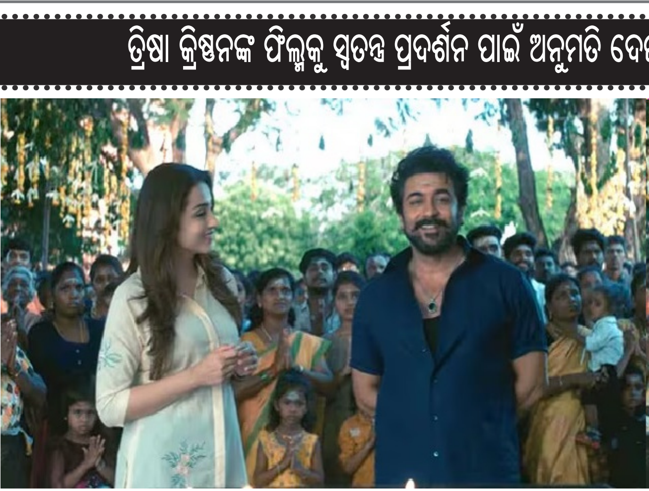
ସାଉଥ ସୁପରଷ୍ଟାର ସୂର୍ଯ୍ୟ ଏବଂ ତ୍ରିଷା କ୍ରିଷ୍ଣନଙ୍କ ଫିଲ୍ମ କରୁସ୍ତୁ ରିଲିଜ୍ ପାଇଁ ଏକ ସ୍ୱତନ୍ତ୍ର ପରମିଶନ ମିଳିବା ପରେ ମଧ୍ୟ ରିଲିଜ୍ ହୋଇପାରିଲା ନାହିଁ । ଫିଲ୍ମଟି ପୂର୍ବରୁ ଗୁରୁବାର ସ୍ୱତନ୍ତ୍ର ପ୍ରଦର୍ଶନ ପାଇଁ ଅନୁମତି ମିଳିଥିଲା । ମାତ୍ର ଅନେକ ସ୍ଥାନରେ ଏହି ନିରାଶ ହୋଇଛନ୍ତି । ପ୍ରଯୋଜନା ସଂସ୍ଥା ପକ୍ଷରୁ ଏନେଇ କ୍ଷମା

ଗୋ ଗୁଡ଼ିକ ବାଟିଲ ହୋଇଥିବା ଜଣାପଡ଼ିଛି । ସକାଳ ୯ଟାରେ ସ୍ୱତନ୍ତ୍ର ପରମିଶନ ମିଳିଥିଲା ପ୍ରଦର୍ଶନ ପାଇଁ ମାତ୍ର ଏହା ରିଲିଜ୍ ହୋଇପାରି ନଥିବା ଫିଲ୍ମର ପ୍ରଯୋଜକ ଏକ୍ସପ୍ରେସ କରି କଣିକା ଛାଡ଼ି । ତାମିଲନାଡୁରେ ଗତ ବର୍ଷଠାରୁ ସକାଳ ଶୋ ନିଷିଦ୍ଧ ରହିଛି । ମାତ୍ର ଏହି ଫିଲ୍ମ ପାଇଁ ସରକାରୀ ଅନୁମତି ମିଳିଥିଲା । ତଥାପି ଅନେକ ହଲରେ ଏହା ରିଲିଜ୍ ହୋଇପାରିନାହିଁ । ଫ୍ୟାକ୍ଟୁମାନେ ଆଗୁଆ ଟିକେଟ ବୁକ୍ କରି ଥିବା ବେଳେ ନିରାଶ ହୋଇଛନ୍ତି । ପ୍ରଯୋଜନା ସଂସ୍ଥା ପକ୍ଷରୁ ଏନେଇ କ୍ଷମା