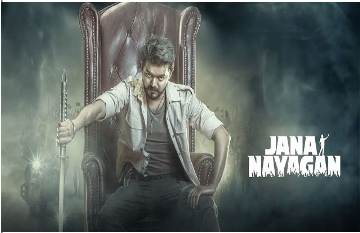
ତାମିଲନାଡୁ ନିର୍ବାଚନରେ ବିଜୟ ପରେ ବିଜୟଙ୍କ ଲୋକପ୍ରିୟତା ଶୀର୍ଷରେ ପହଞ୍ଚିଛି । ତାଙ୍କର ବହୁ ପ୍ରତୀକ୍ଷିତ ଚଳଚ୍ଚିତ୍ର 'ଜନ ନାୟକନ' ପୁଣିଥରେ ଖବରରେ ରହିଛି । ରିପୋର୍ଟ ଅନୁଯାୟୀ, ଫିଲ୍ମଟି ଖୁବ୍ ଶୀଘ୍ର ସିନେମା ହଲରେ ଆସିପାରେ ।

ଯାହାକୁ ଦର୍ଶକମାନେ ଉତ୍ସାହର ସହିତ ଅପେକ୍ଷା କରିଛନ୍ତି । ପ୍ରଥମେ ଜାନୁଆରୀରେ ମୁକ୍ତିଲାଭ କରିବାକୁ ସ୍ଥିର କରାଯାଇଥିଲା, କିନ୍ତୁ ବିଭିନ୍ନ ସମସ୍ୟା ଯୋଗୁଁ ଏହାର ସିନେମା ହଲରେ ରିଲିଜ୍ ହୋଇପାରିନଥିଲା । ଖବର ଅନୁଯାୟୀ, ନିର୍ବାଚନରେ ବିଜୟଙ୍କ ଜନ୍ମଦିନ ସହିତ ଜୁନ୍ ୨୨ ତାରିଖରେ ଜନ ନାୟକନ ରିଲିଜ୍ କରିବାକୁ ଯୋଜନା କରୁଛନ୍ତି । ଏହି ଖବର ପାଇଁ ପ୍ରଶଂସକମାନେ ବହୁତ ଉତ୍ସାହିତ ଅଛନ୍ତି । ଏହି ଫିଲ୍ମରେ ପୂଜା ହେଗଡେ, ବବି ଦେଓଲ, ମମିତା ବେକ୍ସ ଏବଂ ଗୋତମ ବାସୁଦେବ ମେନନଙ୍କ ଭଳି ବଡ଼ ବଡ଼ ତାରକା ମାନେ ନଜର ଆସିବେ । ଏବଂ ବିନୋଦଙ୍କ ନିର୍ଦ୍ଦେଶନାରେ ତିଆରି ହୋଇଥିବା ଏହି ଫିଲ୍ମକୁ ବିଜୟଙ୍କ ଶେଷ ଫିଲ୍ମ ବୋଲି ମନେ କରାଯାଉଛି । ପ୍ରଶଂସକମାନଙ୍କ ମଧ୍ୟରେ ଏହାକୁ ନେଇ ବେଶ୍ ଉତ୍ସାହ ଦେଖିବାକୁ ମିଳୁଛି । ନିର୍ବାଚନରେ ଏହା ମଧ୍ୟ କହିଛନ୍ତି ଯେ, ଜନ ନାୟକନ କେବଳ ଏକ ଚଳଚ୍ଚିତ୍ର ନୁହେଁ, ବରଂ ଏହା ତାମିଲନାଡୁର ନୂଆ ରାଜନୈତିକ ଚିନ୍ତାଧାରା ଏବଂ ପରିବର୍ତ୍ତନର ପ୍ରତୀକ ପାଲଟିଛି । ବିଭିନ୍ନ ବିଜୟ ତାରକର ରାଜନୈତିକ ଦାୟିତ୍ୱ ଉପରେ ସମ୍ପୂର୍ଣ୍ଣ ଧ୍ୟାନ ଦେଇଛନ୍ତି, ତେଣୁ ନିର୍ବାଚନ ଆଗାମୀ ସପ୍ତାହଗୁଡ଼ିକରେ ତାଙ୍କୁ ବ୍ୟକ୍ତିଗତ ଭାବରେ ଭେଟି ଫିଲ୍ମର ରିଲିଜ୍ ତେଜ ବିକ୍ଷୟରେ ଆଲୋଚନା କରିବାକୁ ଯୋଜନା କରୁଛନ୍ତି । ଫିଲ୍ମ ରିଲିଜ୍ ହେବା ପୂର୍ବରୁ ପ୍ରଶଂସକଙ୍କ ପାଇଁ ଏକ ସ୍ୱତନ୍ତ୍ର ସୁନ୍ଦର ମିନିଟର ଭିଡିଓ ବାର୍ତ୍ତା ରେକର୍ଡ କରିବାକୁ ଦଳ ବିଜୟଙ୍କୁ ଅନୁରୋଧ କରିବାକୁ ମଧ୍ୟ ଯୋଜନା କରୁଛି ।