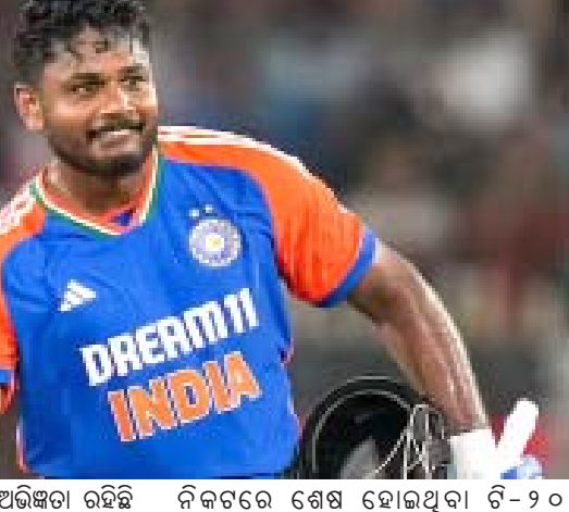
ରୟାଲ୍ ଟ୍ୱେଣ୍ଟି ଦେବଦାର ଅଭିଜ୍ଞତା ରହିଛି ଏବଂ ସେ ଏବେ ଜଣେ ପରିପକ୍ୱ ଖେଳାଳି। ଯଦି ଟିମ୍ ଇଣ୍ଡିଆ ନୂଆ ଅଧିନାୟକ ଖୋଜୁଛି, ତେବେ ସଞ୍ଜୁଙ୍କ ନାମ ସବୁଠାରୁ ଆଗରେ ରହିବ।

ନିଜକୁ ଏକ ଦକ୍ଷ କ୍ୟାପଟେନ୍ ଭାବେ ପ୍ରସ୍ତୁତ କରିସାରିଛନ୍ତି। ତାଙ୍କ ପାଖରେ ରାଜସ୍ଥାନ ଉଚିତ' ସଞ୍ଜୁଙ୍କୁ ନେଇ ଏହି ଚର୍ଚ୍ଚା ହେବାର ମୁଖ୍ୟ କାରଣ ହେଉଛି ତାଙ୍କର ନିକଟତମ ପ୍ରଦର୍ଶନ।