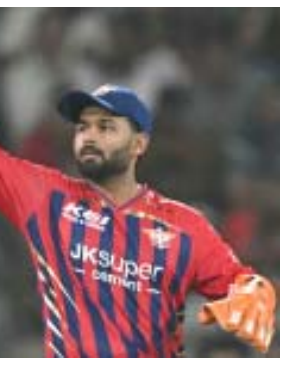
ଅଧିନାୟକଙ୍କ ଉପରେ ସାମାଜିକ ଚାଲିଯାଇଛି। ଏହି ଦଣ୍ଡକୁ ସ୍ୱୀକାର କରିବା ସହ ଦଣ୍ଡଧାରଣକୁ ଗ୍ରହଣ କରିଛନ୍ତି ଅଧିନାୟକ ପକ୍ଷ।

ଲକ୍ଷ୍ମୀ, ୧୬୫: ଶୁକ୍ରବାରର ମ୍ୟାଚରେ ଚେନ୍ନାଇ ସୁପର କିଙ୍ଗ୍ସ ବିପକ୍ଷରେ ଲକ୍ଷ୍ମୀ ସୁପର ଜାଏଣ୍ଟସ୍ ୭ ଡ୍ରେକେଟରେ ବିଜୟ ହାସଲ କରିଥିଲେ ବି ଏହାର ଅଧିନାୟକ ରକ୍ଷତ ପକ୍ଷ ଉପରେ କରମାନା ଜାରିଯାଇଛି। ତାଙ୍କ ମ୍ୟାଚ ପାରଗ୍ରାହ କୌଣସି କିମ୍ପା ୧୨୩ ଓଭରହାର ପାଇଁ ତାଙ୍କ ଉପରେ ଏହି ଦଣ୍ଡଧାରଣ କରାଯାଇଛି। ଆଇପିଏଲ୍ ଆଚରଣବିଧି ଧାରା ୨.୨୨ ଅନୁସାରେ ଧ୍ୟ ଓଭର ହାର ଲାଗି ଦଣ୍ଡିତ କରାଯାଇଥାଏ। ବାରମ୍ବାର ଏପରି ତ୍ରୁଟି କଲେ ଅଧିକ ଗୁରୁତର ଦଣ୍ଡଧାରଣ