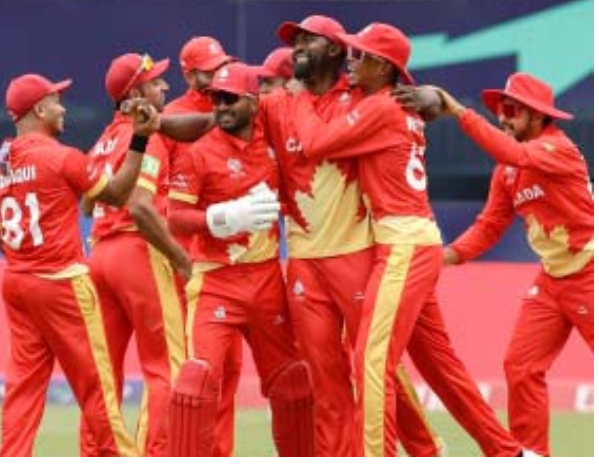
୨୦୨୪ ଶେଷରେ ଆର୍ଥିକ ରେକର୍ଡ ଦର୍ଶାଇଛି ଯେ ବୋର୍ଡର ମୋଟ ରାଜସ୍ୱର ୬୩ ପ୍ରତିଶତ ଆଇସିସିରୁ ଆସିଥିଲା। ଏହାର ମୋଟ ରାଜସ୍ୱ

ନୂଆଦିଲ୍ଲୀ, ୧୬୫: ଆନ୍ତର୍ଜାତୀୟ କ୍ରିକେଟ ପରିଷଦ କଡ଼ା କାର୍ଯ୍ୟାନୁଷ୍ଠାନ ଗ୍ରହଣ କରି କାନାଡା ଅଧିକାରୀଙ୍କୁ ଏକ ବଡ଼ ଧକ୍କା ଦେଇଛି। ଆଇସିସିର ଶାନ୍ତି ନିଶ୍ଚିତ ହେବା ଆଗାମୀ ଛଅ ମାସ ପାଇଁ କୌଣସି ପାଣି ପାଲଟି ନାହିଁ। ଏହି ନିଷ୍ପତ୍ତିର କାରଣ ଭାବରେ ପ୍ରଶାସନିକ ସମସ୍ୟାକୁ ଦର୍ଶାଯାଇଛି। ସୂଚନା ଅନୁଯାୟୀ, ଏହା କାନାଡା ଅଧିକାରୀଙ୍କୁ ବୋର୍ଡ ପାଇଁ ଏକ ବଡ଼ ଧକ୍କା, କାରଣ ଏହାର କାର୍ଯ୍ୟ ମୁଖ୍ୟତଃ ଆଇସିସି ପାଣି ଉପରେ ନିର୍ଭର କରେ। ରିପୋର୍ଟରେ କୁହାଯାଇଛି ଯେ ପାଣି ସୁଗିର ଉତ୍ତରା ଦ୍ୱାରା ଅନାମ୍ୟ କ୍ରିକେଟ-ସମ୍ପର୍କୀୟ କାର୍ଯ୍ୟକ୍ରମକୁ ପ୍ରଭାବିତ କରିବ ନାହିଁ। ଏହା କାନାଡା ଅଧିକାରୀଙ୍କୁ ବୋର୍ଡ ପାଇଁ ଏକ ବଡ଼ ଧକ୍କା କାରଣ