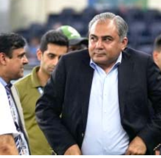
ଯେଉଁ ସ୍ତରରେ ପହଞ୍ଚିଛି, ତାକୁ ଦେଖିଲେ ମୋହମ୍ମଦ ଭାରତ ଆସିବାର ସମ୍ଭାବନା ପ୍ରାୟ ନାହିଁ କହିଲେ ଚଳେ। ସେହିଭଳି ଭାରତୀୟ

ବୋର୍ଡର ମୁଖ୍ୟମାନେ ବ୍ୟକ୍ତିଗତ ଭାବେ ଯୋଗଦେବାର ପରମ୍ପରା ରହି ଆସିଥିବା ବେଳେ ଭାରତ ସହ ପାକିସ୍ତାନର ସଂପର୍କ ଏବେ ତିକ୍ତତାର