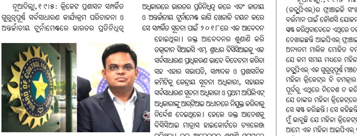
ନୂଆଦିଲ୍ଲୀ, ୧୯।୫: କ୍ରିକେଟ ପ୍ରଶାସନ ସମ୍ପର୍କିତ ଗୁରୁତ୍ୱପୂର୍ଣ୍ଣ ସର୍ବସାଧାରଣ କାର୍ଯ୍ୟକ୍ରମ ପରିଚାଳନା ଓ ଅନ୍ତର୍ଜାତୀୟ ଚୁନାବଣରେ ଭାରତର ପ୍ରତିନିଧିତ୍ୱ ହୋଇଥିଲା ।