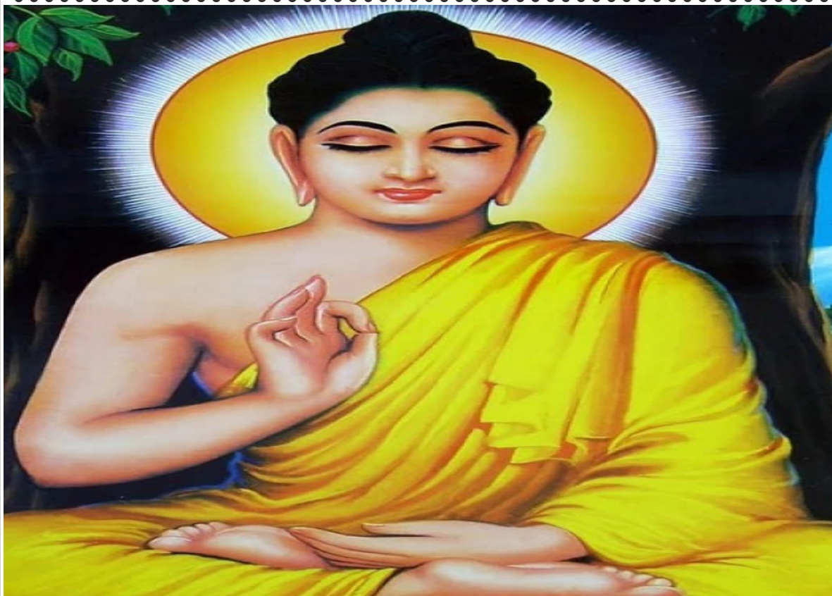
ଥରେ ଗୌତମ ବୁଦ୍ଧ ଉପଦେଶ ଦେଉଥାନ୍ତି-ମନୁଷ୍ୟ ଧରିତ୍ରୀ ମାତା ଭଳି କ୍ଷମାଶୀଳ ହେବା ଉଚିତ । କ୍ରୋଧ ଏକ ବୁଦ୍ଧଙ୍କ ପାଇଁ ତଳେ ପଡ଼ିଗଲା ଏବଂ

ପ୍ରକାରର ଅଗ୍ନି । ତା'ଠାରୁ ଦୂରେଇ ରହିବା ରହିବା ଉଚିତ୍ । ନଚେତ୍ ଏହି ଅଗ୍ନି ଅନ୍ୟକୁ ଜଳାଇବା ସହ ନିଜକୁ ମଧ୍ୟ ଜଳାଇ ଦେଇଥାଏ । ବୁଦ୍ଧଙ୍କ ଏହି ଉପଦେଶ ଜଣେ କ୍ରୋଧୀ ବ୍ୟକ୍ତି ଶୁଣୁଥିଲା । କ୍ରୋଧ ବିରୋଧରେ ଉପଦେଶ ଲୋକଚିତ୍ତ ଭଲ ଲାଗିଲା ନାହିଁ । ସେ ଛିଡ଼ା ହୋଇ କହିଲା, ହେ କପଟୀ ! ବଡ଼ ବଡ଼ କଥା କହୁଛୁ । ତୁ ଜନତାଙ୍କ ବ୍ୟବହାର ବିରୋଧରେ କଥାବାର୍ତ୍ତା କରୁଛୁ । ଲୋକଚିତ୍ତ କଥା ଶୁଣି ବୁଦ୍ଧ ଶାନ୍ତ ରହିଲେ । ଲୋକଚିତ୍ତ ଅଧିକ ରାଗିଗଲା ଏବଂ ବୁଦ୍ଧଙ୍କ ପାଖକୁ ଆସି ତାଙ୍କୁ ଛେପ ପକାଇଲା । ପରଦିନ ବୁଦ୍ଧ ନିଜ ଶିଷ୍ୟମାନଙ୍କ ସହ ଅନ୍ୟ ଏକ ଗ୍ରାମକୁ ଚାଲିଗଲେ । ଅପରପକ୍ଷରେ ଉକ୍ତ କ୍ରୋଧୀ ଲୋକଚିତ୍ତ ସେତେବେଳକୁ ଶାନ୍ତ ହୋଇ ସାରିଥିଲା । ସେ ନିଜ କର୍ମ ପାଇଁ ପଶ୍ଚାତାପ କରୁଥିଲା । ସେ ବୁଦ୍ଧଙ୍କ ସମ୍ମାନରେ ବାହାରିଗଲା । ଶେଷରେ ବୁଦ୍ଧ ଯେଉଁ ଗ୍ରାମରେ ଉପଦେଶ ଦେଉଥିଲେ, ସେଠାରେ ଲୋକଚିତ୍ତ ପହଞ୍ଚିଲା । ଲୋକଚିତ୍ତ ଯାଇ ବୁଦ୍ଧଙ୍କ ପାଦ ତଳେ ପଡ଼ିଗଲା ଏବଂ କହିଲା, ମୋତେ କ୍ଷମା କରି ଦିଅନ୍ତୁ । ବୁଦ୍ଧ କହିଲେ, କ'ଣ ହେଲା ? ତୁମେ କିଏ ? କ୍ରୋଧୀ ଲୋକଚିତ୍ତ ଆଶ୍ଚର୍ଯ୍ୟ ସହକାରେ କହିଲା, ଆପଣ ଭୁଲି ଯାଇଛନ୍ତି, ମୁଁ ସେହି ବୁଦ୍ଧ ଯିଏ ଆପଣଙ୍କ ମୁହଁରେ ଛେପ ପକାଇଥିଲା । ନିଜର ବୁଦ୍ଧ ଆଚରଣ ପାଇଁ ମୁଁ କ୍ଷମା ପ୍ରାର୍ଥନା କରୁଛି । ବୁଦ୍ଧ କହିଲେ, କାଲି କଥା ତ ମୁଁ କାଲିରେ ହିଁ ଛାଡ଼ି ଆସିଛି । କିନ୍ତୁ ତୁମେ ଏପର୍ଯ୍ୟନ୍ତ ସେଇଠି ଅଛ । ତୁମେ ଏଯାବତ୍ ଆଜିରେ ପ୍ରଦେଶ କରି ନାହିଁ କାଲି କଥା ଭାବି ବ'ତ' ତୁମର ଆଜି ନଷ୍ଟ ହୋଇଯିବ । ସବୁ ଖରାପ କଥାକୁ ଯଦି ମନେ ରଖାଯାଏ, ତେବେ ବର୍ତ୍ତମାନ ଏବଂ ଭବିଷ୍ୟତ ଅଟକି ଯିବ । ଏମିତି ଜୀବନ କିପରି ଚାଲିବ ତୁମେ ବି ଆଜିକୁ ଚାଲିଥାଏ । ଲୋକଚିତ୍ତ ବୁଦ୍ଧଙ୍କ କଥାର ମର୍ମ ବୁଝିପାରି ତାଙ୍କ ଶରଣାପନ୍ନ ହେଲା ।