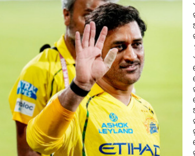
ଆଭାସ ଥିଲା ବୋଲି ବିବେଚନା କରାଯାଇଛି। ଚେନ୍ନାଇ ସହର ମଧ୍ୟରେ ପୂର୍ବତନ ଭାରତୀୟ ଦଳ ଓ

ଚେନ୍ନାଇ, ୨୦୧୫: ଆଇପିଏଲ୍ ଅନ୍ତିମ ପର୍ଯ୍ୟାୟରେ ପହଞ୍ଚିଥିଲେ ବି ମହେନ୍ଦ୍ର ସିଂ ଧୋନି ଏପର୍ଯ୍ୟନ୍ତ ଗୋଟିଏ ବି ମ୍ୟାଚ୍ ଖେଳିନାହାନ୍ତି। ସୋମବାର ହାଇଡ୍ରାବାଦ ବିପକ୍ଷ ମ୍ୟାଚ୍ ସେ ସେ ଖେଳିବେ ବୋଲି ଆଶା କରାଯାଉଥିଲେ ବି ସେ ଖେଳିନଥିଲେ। ଏହାପରେ ପୁଣିଥରେ ତାଙ୍କ ଅବସରକୁ ନେଇ ଚର୍ଚ୍ଚା ଆରମ୍ଭ ହୋଇଯାଇଛି। ଏ ସଂପର୍କରେ ତାଙ୍କର ଏକ ବୟାନ ମଧ୍ୟ ଏହି ଚର୍ଚ୍ଚାକୁ ବଳ ଯୋଗାଇଛି। ସୋମବାର ମ୍ୟାଚ୍ ମଧ୍ୟାହ୍ନରେ ପରେ ଧୋନି ସିଏସ୍‌କେର ଅନ୍ୟ ଖେଳାଳିଙ୍କ ସହ ପଡ଼ିଆକୁ ଆସି ସମସ୍ତଙ୍କୁ ଅଭିବାଦନ ଜଣାଉଥିଲେ। ସେମାନଙ୍କ ସହ ଫଟୋ ଉଠାଇଥିଲେ। ଏହି ସମୟରେ ଧୋନିଙ୍କ ମୁଖମୁଖି ଭାବ୍ୟ ଭାବ୍ୟ ଲାଗୁଥିଲା। ଯାହାକି ତାଙ୍କ ଅବସର