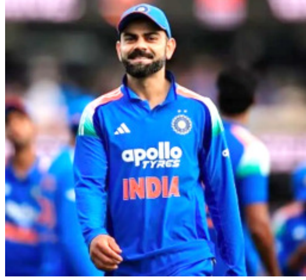
ପ୍ରଦର୍ଶନକୁ ବିଚାରକୁ ନେବା ମଧ୍ୟରେ ବିରାଟଙ୍କ ଟେଷ୍ଟ ହାରାହାରି ଆବଶ୍ୟକ। ୨୦୦୦ରୁ ୨୦୨୫ ୬୦ ପ୍ରତିଶତରୁ ୪୬.୮୫

ନୂଆଦିଲ୍ଲୀ, ୨୦୧୫: ଟେଷ୍ଟରୁ ଅବସର ଓ ୨୦୨୬ ଦିନିକିଆ ବିଶ୍ୱକପ୍ ଖେଳିବା ନେଇ ବିରାଟ କୋହଲି ରଖୁଥିବା ସର୍ତ୍ତକୁ ନେଇ ଚର୍ଚ୍ଚା ଜାରି ରହିଛି। ଏବେ ଏ ନେଇ ପ୍ରତିକୂଳା ରଖିଛନ୍ତି ପୂର୍ବତନ କ୍ରିକେଟର ସଂଜୟ ମଞ୍ଜୁରେକର। ସେ କହିଛନ୍ତି ଯେ ବିରାଟ ଯେଉଁ ‘ପରିବେଶ’ କଥା କହୁଛନ୍ତି, ତାହା ହେଉଛି ‘ଅଧିକ ଅଗରକର ଓ ଗୌତମ ଗମ୍ଭୀର’। ଗମ୍ଭୀରଙ୍କ ସହ ବିରାଟଙ୍କ ମତଭେଦକୁ ସ୍ୱୀକାର କରିବା ସହ ସେ କହିଛନ୍ତି ଯେ ବିରାଟ ଟେଷ୍ଟ୍ ରୁ ଅବସର ଲାଗି ଏହି ପରିବର୍ତ୍ତନ ପରିବେଶକୁ ଦାୟୀ କରୁଛନ୍ତି। କିନ୍ତୁ ସେ ନିଜେ ନିଜର ବିଗତ ପାଞ୍ଚ ବର୍ଷର ଟେଷ୍ଟ