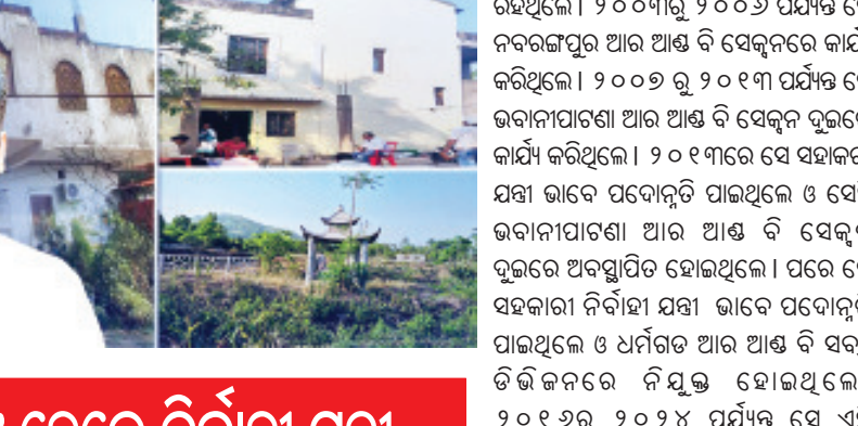
ଗିରଫ ହେଲେ ନିର୍ବାହୀ ଯତ୍ନ

କାର୍ଯ୍ୟ ଆରମ୍ଭ କରିଥିଲେ । ୧୯୯୯ ଜୁଲାଇ ୧ ତାରିଖରେ କୋରାପୁଟ ଆଉ ଆଖି ବି ଡିଭିଜନ ଅଧୀନ ସୁନାବେତା ସେକ୍ଟରରେ ସେ କନିଷ୍ଠ ଯତ୍ନ ଭାବେ ଯୋଗ ଦେଇଥିଲେ । ସେଠାରେ ସେ ୨୦୦୩ ମସିହା ପର୍ଯ୍ୟନ୍ତ ରହିଥିଲେ । ୨୦୦୩ରୁ ୨୦୦୬ ପର୍ଯ୍ୟନ୍ତ ସେ ନବରଙ୍ଗପୁର ଆଉ ଆଖି ବି ସେକ୍ଟରରେ କାର୍ଯ୍ୟ କରିଥିଲେ । ୨୦୦୭ରୁ ୨୦୧୩ ପର୍ଯ୍ୟନ୍ତ ସେ ଭବାନୀପାଟଣା ଆଉ ଆଖି ବି ସେକ୍ଟର ଦୁଇରେ କାର୍ଯ୍ୟ କରିଥିଲେ । ୨୦୧୩ରେ ସେ ସହକାରୀ ଯତ୍ନ ଭାବେ ପଦୋନ୍ନତି ପାଇଥିଲେ ଓ ସେହି ଭବାନୀପାଟଣା ଆଉ ଆଖି ବି ସେକ୍ଟର ଦୁଇରେ ଅବସ୍ଥାପିତ ହୋଇଥିଲେ । ପରେ ସେ ସହକାରୀ ନିର୍ବାହୀ ଯତ୍ନ ଭାବେ ପଦୋନ୍ନତି ପାଇଥିଲେ ଓ ଧର୍ମଗତ ଆଉ ଆଖି ବି ସବ-ଡିଭିଜନରେ ନିଯୁକ୍ତ ହୋଇଥିଲେ । ୨୦୧୬ରୁ ୨୦୨୪ ପର୍ଯ୍ୟନ୍ତ ସେ ଏହି ପଦରେ ରହି କାର୍ଯ୍ୟ କରିଥିଲେ । ୨୦୨୪ ମାର୍ଚ୍ଚରେ ସେ ନିର୍ବାହୀ ଯତ୍ନ ଭାବେ ପଦୋନ୍ନତି ପାଇଥିଲେ ଓ ଧର୍ମଗତ ଆଉ ଆଖି ବି ସବ-ଡିଭିଜନରେ କାର୍ଯ୍ୟ ଜାରି ରଖିଥିଲେ । ଏବେ ସେ ସେଠାରେ କାର୍ଯ୍ୟରେ ଥିବା ବେଳେ ୨୦୨୫ ଜାନୁଆରୀରୁ ଭବାନୀପାଟଣା ଆଉ ଆଖି ବି ଡିଭିଜନର ନିବାହୀ ଯତ୍ନ ଭାବେ ଅତିରିକ୍ତ ଦାୟିତ୍ୱ ମଧ୍ୟ ଚୁଲାଇ ଆସୁଛନ୍ତି ।