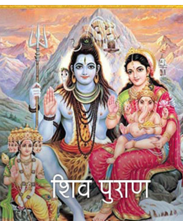
ଶିବ ପୁରାଣ ସଂହିତାକୁ ପାଞ୍ଚ ଖଣ୍ଡରେ ବିଭକ୍ତ କରାଯାଇଥିବା ବେଳେ ବାୟବ୍ୟ ସଂହିତାକୁ ଦୁଇ ଖଣ୍ଡରେ ବିଭକ୍ତ କରାଯାଇଛି ।

ଭଗବାନ ଶଙ୍କରଙ୍କ ବିଷୟରେ ବର୍ଣ୍ଣନା ଥିବା ଅନେକ ଧର୍ମଗ୍ରନ୍ଥ ପ୍ରଚଳିତ ରହିଛି । ତେବେ ଶିବପୁରାଣକୁ ଅଧିକ ପ୍ରାମାଣିକ ବୋଲି ବିବେଚନା କରାଯାଇଥାଏ । ଏଥିରେ ଦେବ ଦେବ ମହାଦେବଙ୍କ ଅପାର ଲୀଳା ସମ୍ବନ୍ଧରେ ଚମତ୍କାରୀ ବର୍ଣ୍ଣନା ରହିଛି । ଶିବ ପୁରାଣକୁ ଶୈବ ସମ୍ପ୍ରଦାୟର ଅତି ପୂଜନୀୟ ଗ୍ରନ୍ଥ ଭାବେ ବିବେଚନା କରାଯାଇଥାଏ । ଏଥିରେ ଭଗବାନ ଶିବଙ୍କ କଲ୍ୟାଣକାରୀ ରୂପ ସମ୍ପର୍କରେ ବର୍ଣ୍ଣନା ରହିଛି । ଶିବ ପୁରାଣରେ ମୋଟ ୨୪ ହଜାର ଶ୍ଳୋକ ଥିବା ବେଳେ ଏହାକୁ ୭ଟି ସଂହିତାରେ ଭାଗ ଭାଗ କରାଯାଇଛି । ଏହି ସଂହିତାଗୁଡ଼ିକ ହେଉଛି ବିଦେଶର ସଂହିତା, ଗୁପ୍ତ ସଂହିତା, ଶତରୁଦ୍ର ସଂହିତା, କୋଟିଗୁପ୍ତ ସଂହିତା, ଉମା ସଂହିତା, କୈଳାଶ ସଂହିତା, ବାୟବ୍ୟ ସଂହିତା । ଏହି ସଂହିତା ମଧ୍ୟରୁ ରୁଦ୍ର