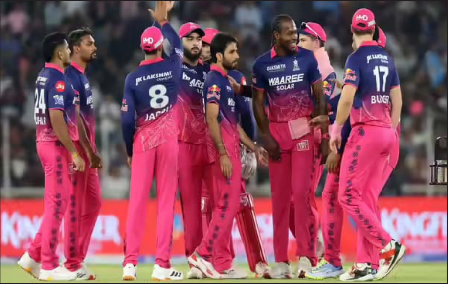
ରାଜସ୍ଥାନ ଦଳର ଖେଳାଳିମାନେ ମୁମ୍ବାଇରେ ପ୍ରଦର୍ଶନ କରିବା ପରେ ଖୁସି ହୋଇଛନ୍ତି।

ମୁମ୍ବାଇ, ୨୫ ମଇ: ଆଜିଠିକି ୨୦୨୬ରେ ନିଜ ପାଇଁ କିଛି ନିମ୍ନ ପ୍ରକାଶନ କିଛି ନେଇ ରାଜସ୍ଥାନ ଦଳର ପ୍ରଦର୍ଶନ ଉପରେ ଆଶ୍ଚର୍ଯ୍ୟ ହୋଇଛନ୍ତି। ବିକେଟ୍ ହରାଇବା ପରେ ମଧ୍ୟ ଦଳର ପ୍ରଦର୍ଶନ ଉପରେ ଆଶ୍ଚର୍ଯ୍ୟ ହୋଇଛନ୍ତି। ମୁମ୍ବାଇ ପରାଜୟ ସହ ନିଜର ଅଧିକାଂଶ ଶେଷ କରିଛନ୍ତି। ରାଜସ୍ଥାନର ଫ୍ଲୋ ଅଫରେ ପ୍ରଦର୍ଶନ ସହ ପଞ୍ଚାବ-କୋଲକାତା ବାହାରି ଯାଇଛନ୍ତି। ଆଜିଠିକି ୨୦୨୬ରେ ଶେଷ ଲିଗ୍ ମ୍ୟାଚ୍ କୋଲକାତା ନାଜର୍ ରାଜସ୍ଥାନ ବନାମ ବିଲ୍ଲୀ କ୍ୟାପିଟାଲ୍ ମ୍ୟାଚ୍ କେବଳ ଉପଚାରିକତା ରହିଛି ଯାଇଛି।