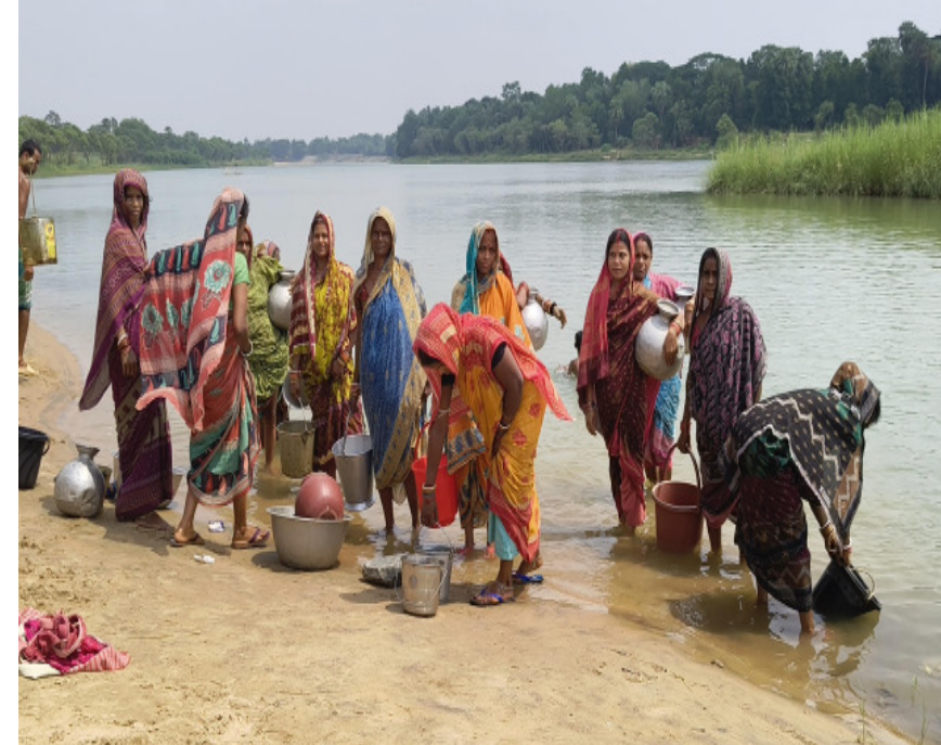
ଠୁ ଆରମ୍ଭ କରି ପିଇବା ପାଇଁ ପାଣିର ଆବଶ୍ୟକତା ଥିବାରୁ କୁମ୍ଭୀରୀ ଅନାଦୁ ଜୀବନକୁ ବାକି ଲଗାଇ ପାଣି କରୁଛନ୍ତି ଗ୍ରାମବାସୀ । ପାଣି ସମସ୍ୟା ନେଇ ଗ୍ରାମବାସୀ ଜଳ