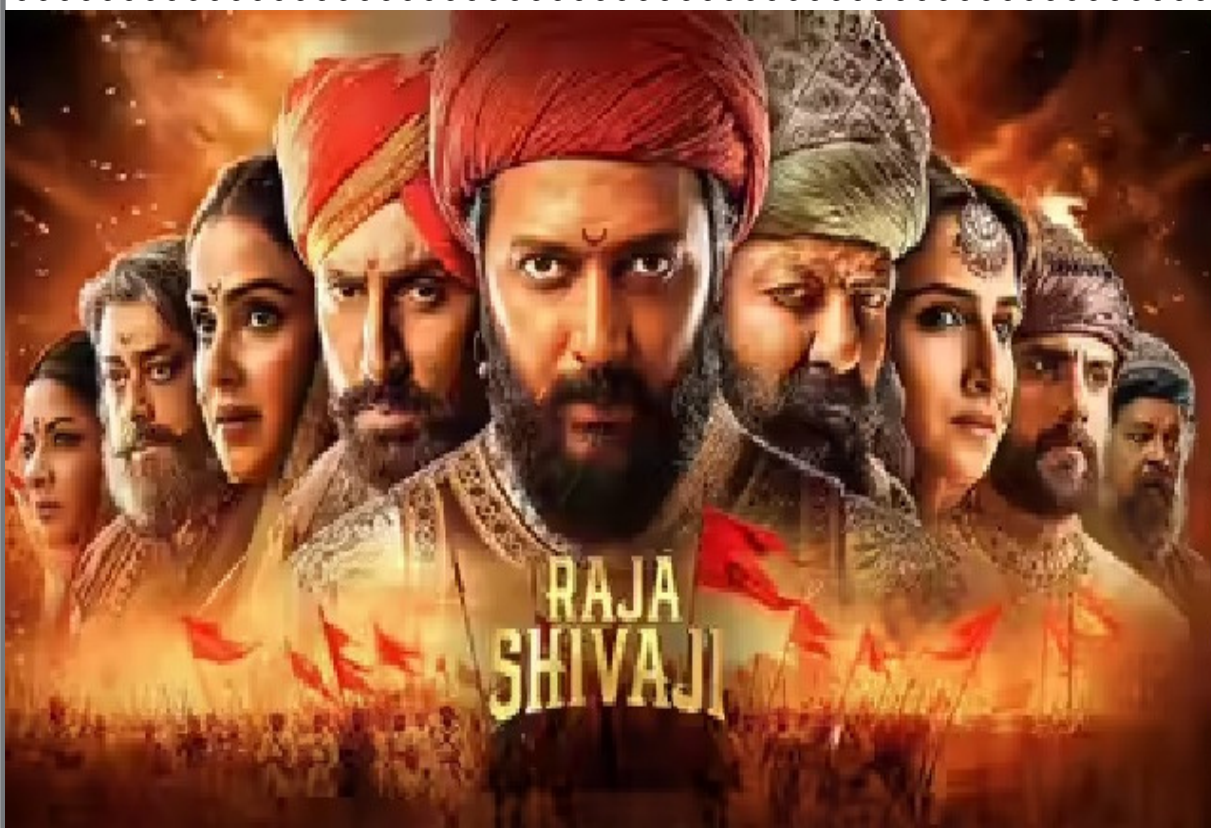
ରିଡେଶ ଦେଶମୁଖଙ୍କ ଦ୍ଵାରା ନିର୍ଦ୍ଦେଶିତ ଫିଲ୍ମ ରାଜା ଶିବାଜୀ ବକ୍ସ ଅଫିସରେ ବର୍ତ୍ତମାନ ଧମାଳ କରୁଛି । ଏହି ଐତିହାସିକ ଆକ୍ସନ

ଫିଲ୍ମ ଏବେ ପର୍ଯ୍ୟନ୍ତ ସବୁଠାରୁ ଅଧିକ ରୋଜଗାର କରି ମରାଠୀ ଫିଲ୍ମର ରେକର୍ଡ଼ ସୃଷ୍ଟି କରିଛି । ପାଞ୍ଚ ସପ୍ତାହ ଧରି ସିନେମା ହଲରେ ଏଣୁ କରି ବଡ଼ ସଫଳତା ହାସଲ କରିପାରିଛି । ରିଡେଶ ଦେଶମୁଖଙ୍କ ନିର୍ଦ୍ଦେଶିତ ଏବଂ ଅଭିନୀତ ରାଜା ଶିବାଜୀର ବକ୍ସଓଫିସ୍ କୋଟି ବୋଲି ରିପୋର୍ଟ କରାଯାଇଛି । ରାଜା ଶିବାଜୀ ରିଲିଜ୍ ହେବାର ୨୯ତମ ଦିନରେ ଭାରତରେ ୩.୫ ମିଲିୟନ୍ ରୋଜଗାର କରି ଥିବାବେଳେ ୨୮ତମ ଦିନରେ ୪.୫ ମିଲିୟନ୍ ରୋଜଗାର କରିଥିଲା । ରାଜା ଶିବାଜୀ ଏବେ ଦେଉଳ ବନ୍ଦ ୨ ସହିତ କଞ୍ଚା ଟକ୍କର ଦେଉଛି । ଭାରତରେ ରାଜା ଶିବାଜୀ ରିଲିଜ୍ ହେବାର ୪ ସପ୍ତାହ ମଧ୍ୟରେ ମୋଟ୍ ନେଟ୍ କଲେଜ୍ ୧୦୩.୧୫ କୋଟି ଟଙ୍କା ହୋଇଥିବା ଜଣାପଡ଼ିଛି । ହେଲେ ଏହାର ଟୋଟାଲ କଲେଜ୍ ୧୨୧.୭୧ କୋଟି ଟଙ୍କାରେ ପହଞ୍ଚିଛି । ବକ୍ସ ଅଫିସରେ ସର୍ବାଧିକ କଲେଜ୍ କରି ରେକର୍ଡ଼ କରିବା ସହ ସିନେମା ହଲରେ ଧମାଳ କରୁଛି । ଯଦି ଏହି ଫିଲ୍ମର ଖାର କାଷ୍ଟ ସମ୍ପର୍କରେ କୁହାଯାଏ ତେବେ ରିଡେଶ ଦେଶମୁଖ ରାଜା ଶିବାଜୀରେ ଛତ୍ରପତି ଶିବାଜୀ ମହାରାଜଙ୍କ ମୁଖ୍ୟ ଭୂମିକାରେ ନଜର ଆସିଛନ୍ତି । ତାଙ୍କ ବ୍ୟତୀତ ସଞ୍ଜୟ ଦତ୍ତ, ଅଭିଷେକ ବଚ୍ଚନ, ବିଦ୍ୟା ବାଲାନ, ମହେଶ ମାଞ୍ଜରକର, କେନେଲିଆ ଡିଭୁଜା ଏବଂ ବୋମାନ ଇରାନୀଙ୍କ ସମେତ ଅନ୍ୟ ଖାରଙ୍କୁ ମଧ୍ୟ ଦେଖିବାକୁ ମିଳିଛି । ଫିଲ୍ମରେ ସଲମାନ ଖାନଙ୍କର ଏକ ସ୍ଵତନ୍ତ୍ର କ୍ୟାମିଓର ଝଲକ ଦେଖିବାକୁ ମିଳିଛି ।