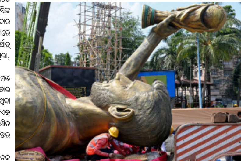
କରିଥିଲେ ଯେ ଷ୍ଟାଡିୟମ ଫାଉଣ୍ଡେସନ ଅର୍ଥାତ୍ ମୂଳଦୁଆରେ କିଛି କ୍ଷତ ତଥା ତ୍ରୁଟି ଦେଖିବାକୁ ମିଳିଥିଲା । ଅଧିକାରୀମାନଙ୍କୁ ସତର୍କ କରାଯାଇଥିଲା ଯେ ଗଠନଟି ବର୍ତ୍ତମାନ ଅତ୍ୟନ୍ତ ବିପଦପୂର୍ଣ୍ଣ ଅବସ୍ଥାରେ ଅଛି ଏବଂ ଯେକୌଣସି ମୁହୂର୍ତ୍ତରେ ଭୁଲ୍ଲି ପଡ଼ିପାରେ; ଫଳସ୍ୱରୂପ, ପ୍ରଶାସନିକ ମହଲରେ ଗୁଜବ ଏବଂ ଆଲୋଚନା ଜୋର ଧରିଛି ଯେ, ରାଜ୍ୟ ସରକାରଙ୍କ ରୂପାନ୍ତ ନିଷ୍ପତ୍ତି ପରେ, ଏହାକୁ ରବିନ୍ଦ୍ର ସରୋବର କିମ୍ବା ଇକୋ ପାର୍କ ଭଳି ଏକ ସୁରକ୍ଷିତ ଏବଂ ଖୋଲା ସ୍ଥାନରେ ପୁନଃସ୍ଥାପିତ କରାଯାଇପାରେ ।

କୋଲକାତା, ୦୨/୦୬: କୁନ୍ ୧୧ ତାରିଖରୁ ଆରମ୍ଭ ହେବାକୁ ଯାଉଛି ପୁସ୍ତକ ମହାକୁସ 'ଫିଫା ବିଶ୍ୱକପ' । ଠିକ୍ ଏତିକିବେଳେ ପଶ୍ଚିମବଙ୍ଗର କୋଲକାତାରେ, କିମ୍ବଦନ୍ତୀ ପୁସ୍ତକ ଖେଳାଳି ଲିଭେନେଲ୍ ମେସିଙ୍କ ଏକ ବିଶାଳ ପ୍ରତିମୂର୍ତ୍ତିକୁ ଭାଙ୍ଗି ଦିଆଯାଇଛି । କୋଲକାତାର ଲେକ୍ ଟାଉନ ଅଞ୍ଚଳରେ ସ୍ଥାପିତ ଆର୍ଦ୍ଧଶତାବ୍ଦୀ କିମ୍ବଦନ୍ତୀ ପୁସ୍ତକ ଖେଳାଳି ଲିଭେନେଲ୍ ମେସିଙ୍କ ୭୦ ପୁସ୍ତକ ଉତ୍ତର ପ୍ରତିମୂର୍ତ୍ତିକୁ ସୁରକ୍ଷା ଦୃଷ୍ଟିରୁ ସାମାଜିକ ହତ୍ୟା ଦିଆଯାଇଛି । ନିକଟରେ ହୋଇଥିବା କାଳବୈଶାଖୀରେ ପ୍ରତିମୂର୍ତ୍ତିର ଛାଗଡ଼ ସତ୍ତ୍ୱେନ ନଷ୍ଟ ହୋଇଯାଇଥିଲା ଅର୍ଥାତ୍ ଷ୍ଟାଡିୟମ କିଛି ସ୍ଥାନରେ ଭଙ୍ଗାଗୁଡ଼ା ଦେଖିବାକୁ ମିଳିଥିଲା, ଯାହାକି ଏକ ବଡ଼ ଦୁର୍ଘଟଣାର ଆଶଙ୍କା ସୃଷ୍ଟି କରିଥିଲା ।