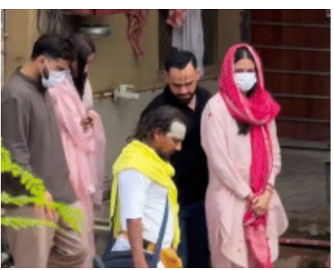
ଏହି ଆଧ୍ୟାତ୍ମିକ ଗସ୍ତର ଠିକ୍ ଦୁଇ ଦିନ ପୂର୍ବରୁ ଅର୍ଥାତ୍ ରବିବାର ଦିନ ଅହମଦାବାଦ ନଗରରୁ ମୋଟା ଷ୍ଟାଣ୍ଡିଂରେ ଖେଳାଯାଇଥିବା ଆଇପିଏଲ୍ ମହାସମରରେ ବିରାଟ କୋହଲି ନିଜ ବ୍ୟାଟିଂର ଯାଦୁ ଦେଖାଇଥିଲେ । ଗୁଜରାଟ ଗାଙ୍ଗରୁ ବିପକ୍ଷ ଗାଙ୍ଗଲ୍ ପ୍ରଭାବରେ ମାତ୍ର ୪୨ଟି ବଲ୍ରେ ୬୫ ରନ୍ ଏକ ଅପରାଧକେୟ ଇନିଂସ ଖେଳି ସେ ଦଳକୁ ବିଜୟୀ କରାଇଥିଲେ । ଚାକର ଏହି ଦମ୍ପତିର ଇନିଂସରେ ୯ଟି ଚୋକା ଓ ୩ଟି ଗରନରୁମ୍ପା ଛକା ସମିଳି ଥିଲା । ଏହି ମ୍ୟାଚରେ ସେ ମାତ୍ର ୨୫ଟି ବଲରେ ନିଜର ଅର୍ଦ୍ଧଶତକ ପୁରଣ କରିଥିଲେ, ଯାହା ଆଇପିଏଲ୍ ଇତିହାସରେ ଚାକର ସବୁଠାରୁ ଦ୍ରୁତତମ ଅର୍ଦ୍ଧଶତକ ।

ବୃନ୍ଦାବନସ୍ଥିତ ଖ୍ୟାତନାମା 'ରାଧା କେଲି କୁଞ୍ଜ ଆଶ୍ରମ'ରେ ପହଞ୍ଚି ବିରାଟ ଓ ଅନୁଷ୍ଠା ଦମ୍ପତିଙ୍କୁ ବୃନ୍ଦାବନ ଏବଂ ଅନ୍ୟାନ୍ୟ ଧର୍ମିକ ସ୍ଥଳରେ ସମ୍ପାଦକ ଆଶୀର୍ବାଦ ନେଉଥିବା ଦେଖାଯାଇଛି । ବିରାଟ ସେହିଠାରେ ମିଆଁଆରେ ଚାକର ଏହି ଗସ୍ତ ସମୟର ଅନେକ ଫଟୋ ଓ ଭିଡିଓ ବେଶ ଭାଇଭାଇ ହେବାର ଲାଗିଛି, ଯାହାକୁ କ୍ରିକେଟ୍ ଓ ସିନେ ପ୍ରେମୀମାନେ ଖୁବ୍ ପସନ୍ଦ କରୁଛନ୍ତି । ବୃନ୍ଦାବନ ଗସ୍ତ ସମୟରେ ଉଭୟଙ୍କ ପାଖେ 'ଏବଂ ସାଧାରଣ ଚେହେରା ସମସ୍ତଙ୍କ ଦୃଷ୍ଟି ଆକର୍ଷଣ କରିଥିଲା । ଲାଙ୍ଗୁଳାଳରେ ପୁରୁଣାରେ ରହି ବିରାଟ ଏକ ଗୁରୁତର ଗଙ୍ଗା ସର୍ତ୍ତ କରିବା ଏବଂ ଅପ୍-ହାଲ୍-ଫୋର୍-ସିମ୍ପିଲି ଚଳେଇବା ସାଧନା ସମସ୍ତଙ୍କ ମନ ଜିତିଥିଲା । ଅନୁଷ୍ଠା ଏକ ସାଲ୍ମା ଗୋଲ୍‌ପା ଚଳେଇ ପାରମ୍ପରିକ କୁର୍ତ୍ତା ସହ ଗୋଲାପୀ ଚଢ଼ା ଓ ଚୁଟିଆ ପକାଇଥିଲେ । ଚେହେରାରେ ଧଳା ମାଝ ଏବଂ କପାଳରେ ସୁନ୍ଦର ଚିକା ଚାକ ପାରମ୍ପରିକ ଭାରତୀୟ ସାର ରୂପକୁ ଆହୁରି ମନେହର କରୁଥିଲା ।