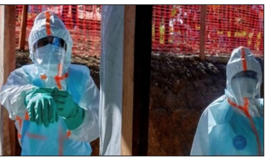
ରାଷ୍ଟ୍ର ଦେଇ ଯାତ୍ରା କରିଛନ୍ତି, ଏବଂ ତାହାରିଆ ଭଳି ଲକ୍ଷଣ କର୍ତ୍ତୃପକ୍ଷଙ୍କୁ ଅବଗତ କରନ୍ତୁ । ଆପଣଙ୍କଠାରେ କୂର, ମୁଣ୍ଡବିନ୍ଦା, ଦେଖାଦେଉଛି ?ତେବେ ପୃଥକ୍ କୋଣସି ପ୍ରକାର ସହଯୋଗ ପାଇଁ ବାନ୍ଧି, ମାଂସପେଶୀରେ ଯନ୍ତ୍ରଣା, ରୁହନ୍ତୁ ଏବଂ ସ୍ଥାନୀୟ ସ୍ୱାସ୍ଥ୍ୟ କର୍ତ୍ତୃପକ୍ଷମାନଙ୍କୁ ଯୋଗାଯୋଗ

ନୂଆଦିଲ୍ଲୀ : ଇବୋଲା ଭାଇରସକୁ ନେଇ ସାରା ବିଶ୍ୱରେ ଆତଙ୍କ ଦେଖାଦେଇଥିବାବେଳେ ସରକାର ଏହି ଭାଇରସକୁ ନେଇ ପୁଣି ଏକ ସଦ୍ୟ ନିର୍ଦ୍ଦେଶାବଳି ଜାରି କରିଛନ୍ତି । ଏକ ବିଶ୍ୱତ୍ ବିଦ୍ୟୁତ୍‌ରେ ସାମ୍ନା ଏବଂ ପରିବାର କଲ୍ୟାଣ ମନ୍ତ୍ରାଳୟ ସହ କରିଛି ଯେ ଦେଶରେ ଏଯାବତ୍ ଇବୋଲା ମାମଲା ଚିହ୍ନଟ ହୋଇନାହିଁ । ତେବେ ଯେଉଁମାନେ ଇବୋଲା ପ୍ରଭାବିତ ରାଷ୍ଟ୍ରକୁ ଗସ୍ତ କରିଛନ୍ତି ଏବଂ ସେମାନଙ୍କଠାରେ କିଛି ନିର୍ଦ୍ଦିଷ୍ଟ ଲକ୍ଷଣ ଦେଖାଦେଉଛି ସେମାନେ ସ୍ଥାନୀୟ ସ୍ୱାସ୍ଥ୍ୟ କର୍ତ୍ତୃପକ୍ଷଙ୍କୁ ଅବଗତ କରନ୍ତୁ । ନିର୍ଦ୍ଦେଶାବଳିରେ କୁହାଯାଇଛି, ଯଦି ଆପଣ ଗତ ୨୧ ଦିନ ମଧ୍ୟରେ ଇବୋଲା ପ୍ରଭାବିତ ରାଷ୍ଟ୍ରରୁ ଏବଂ ଇବୋଲା ପ୍ରଭାବିତ