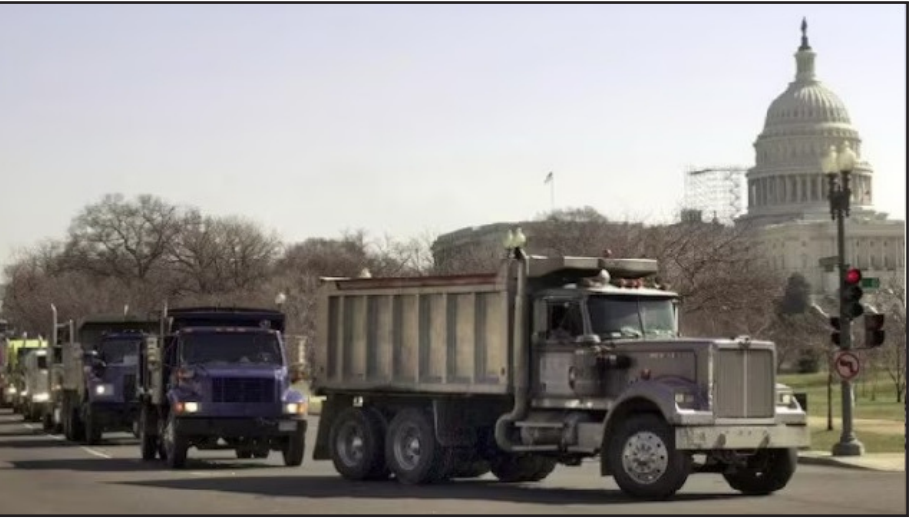
ଏହି ୩୨ ଜଣ ଟ୍ରକ୍ ଚାଳକଙ୍କ ମଧ୍ୟରୁ ୩୦ ଜଣ ଭାରତର ହୋଇଥିବା ବେଳେ ବାକି ୨ ଜଣ ମେକ୍ସିକୋ, ଏଲ୍ ସାଲଭାଡୋର ଏବଂ ରୁଷିଆର ବୋଲି ଚିହ୍ନଟ କରାଯାଇଛି । ତେବେ ତଦନ୍ତରୁ ଜଣାପଡିଛି ଯେ, ଏହି ଚାଳକମାନଙ୍କ ମଧ୍ୟରୁ ଅଧିକାଂଶ ପୂର୍ବତନ ରାଷ୍ଟ୍ରପତି କୋ ବାଇଡେନ ପ୍ରଶାସନ ସମୟରେ ରୋଜଗାର ଅନୁମତି ପତ୍ର ହାସଲ କରିଥିଲେ ।

ନୂଆଦିଲ୍ଲୀ : ଆମେରିକୀୟ ଏଜେନ୍ସୀ ଅବୈଧ ଭାବେ ରହୁଥିବା ୩୦ରୁ ଅଧିକ ଭାରତୀୟ ଟ୍ରକ ଡ୍ରାଇଭର ଗିରଫ କରିଛି । ଏମାନେ ବେଆଇନ ଭାବେ ରହି ବ୍ୟବସାୟିକ ଟ୍ରକ୍ ଚଳାଉଥିଲେ । ଆମେରିକା ଫେଡେରାଲ୍ ଏଜେନ୍ସି ପକ୍ଷରୁ ଚଳାଉଯାଇଥିବା ଏକ ବଡ଼ ଧରଣର ସ୍ୱତନ୍ତ୍ର ଅଭିଯାନ ସମୟରେ ଏହି ଗିରଫଦାରୀ ହୋଇଛି । ଖବରରୁ ଏମାନଙ୍କୁ ଭାରତ ଡିପୋର୍ଟ କରାଯିବ ବୋଲି ଜଣାପଡିଛି । ଆମେରିକା କମ୍ପ୍ୟୁ ଆଣ୍ଡ ବୋର୍ଡର ପ୍ରୋଟେକ୍ସନ ଜାରି କରିଥିବା ଏକ ବିଦ୍ୟୁତ୍ ଅନୁଯାୟୀ, ଗତ ମେ ୧୧ ରୁ ୧୫ ତାରିଖ ମଧ୍ୟରେ ଏରିଜୋନାର ସ୍ଥାନୀୟ ସେକ୍ଟରର ସାମା ସୁରକ୍ଷା ବାହିନୀ ପକ୍ଷରୁ ଅପରେସନ ଚଳେଇଥିଲା । ଏହି ଅପରେସନ ଜାରିଆରେ ଆମେରିକାରେ ବେଆଇନ ଭାବେ ରହୁଥିବା ୫୨ ଜଣଙ୍କୁ ଗିରଫ କରାଯାଇଥିବା ବେଳେ, ସେମାନଙ୍କ ମଧ୍ୟରୁ ୩୨ ଜଣ ବେଆଇନ ଭାବେ ବଡ଼ ବଡ଼ ସେମି-ଟ୍ରକ୍ ଚଳାଉଥିବା ବେଳେ ଧରାପଡିଥିଲେ ।