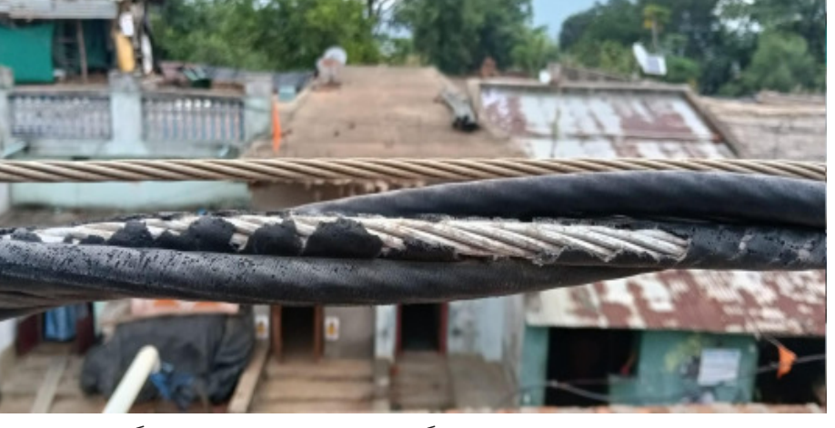
ଦିନ ଧରି ଜରାଜୀର୍ଣ ଅବସ୍ଥାରେ ରହିଥିବା ବେଳେ ବର୍ତ୍ତମାନ ଚାହାର ଆବରଣ ଛିଣ୍ଡିଯାଇ ଭିତରର ତାର

ରା - ଉଦୟଗିରି (ମହାଭାରତ) : ରାଜ୍ୟରେ ବିଦ୍ୟୁତ ବିଭାଗର ସୁପରିଚାଳନା ପାଇଁ ସରକାର ଚାଟା ପାଖର କମ୍ପାନୀକୁ ଦାୟିତ୍ୱ ଦେଇଛନ୍ତି କିନ୍ତୁ ଚାଟାପାଖର କମ୍ପାନୀର କର୍ମଚାରୀ ମାନଙ୍କ ବେପରୁଆ ଓ ମନମୁଖୀ କାର୍ଯ୍ୟପାଇଁ ଦୁର୍ଗମରେ ନିରାହ ଲୋକେ ଅକାଳରେ ମୃତ୍ୟୁ ବରଣକରୁଥିବା ଅଧିକାଂଶ ସମୟରେ ବିଦ୍ୟୁତ ଦେଖିବାକୁ ମିଳୁଛି । ଗଜପତି ଜିଲ୍ଲା ରା - ଉଦୟଗିରି ବ୍ଲକ ଅନ୍ତର୍ଗତ ମହେନ୍ଦ୍ରଗଡ଼ ପଞ୍ଚାୟତର କୁଶପଲ୍ଲୀ ଗାଁରେ ଏକ ଚିତ୍ତାଜନକ ଦୁର୍ଘଟଣା ଘଟିଛି । ଗାଁକୁ ଯାଇଥିବା ବିଦ୍ୟୁତ ଲାଇନର ପୁରୁଣା ତାର ବାସ୍ତି