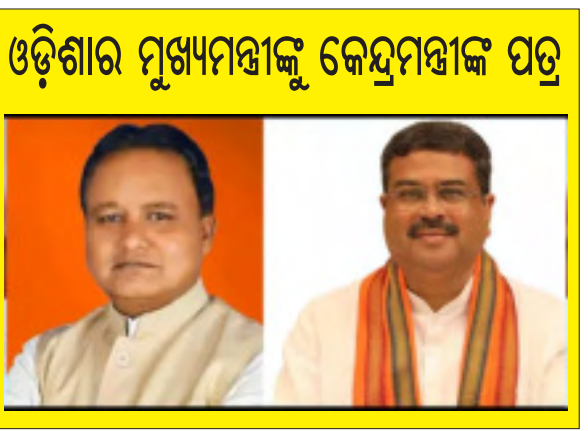
ଓଡ଼ିଶାର ମୁଖ୍ୟମନ୍ତ୍ରୀଙ୍କୁ କେନ୍ଦ୍ରମନ୍ତ୍ରୀଙ୍କ ପତ୍ର

ଆଇଜିଆଇଟି ସରାଞ୍ଜ, ତେଜାନଳ ଏବଂ ଅନୁଗୋଳର ଦ୍ରୁତ ଶିକ୍ଷାକ୍ଷେତ୍ର ମଧ୍ୟରେ ଅବସ୍ଥିତ ଥିବାରୁ ଏହା ଶିକ୍ଷା ଆଧାରିତ ଜ୍ଞାନ, ରବେକ୍ଷଣା, ଜନୋତ୍ସେଧନ ମାଧ୍ୟମରେ ସ୍ଥାନୀୟ ଶିକ୍ଷା ପରିସଂସ୍ଥାନକୁ ଅଧିକ ବ୍ୟାପକ କରାଯାଇବାର ମଧ୍ୟ ସମ୍ଭାବନା ରଖୁଛି । ଏହାକୁ ଏକକ ବିଶ୍ୱବିଦ୍ୟାଳୟ ରୂପେ ଗଢ଼ିବା ପାଇଁ କେନ୍ଦ୍ର ଅନୁଷ୍ଠାନର ଏକାଡେମିକ ସ୍ୱାଧୀନତା ବୃଦ୍ଧି ପାଇବ, ଉନ୍ନତ ରବେକ୍ଷଣା ଓ ଜନୋତ୍ସେଧନକୁ ପ୍ରୋତ୍ସାହନ ମିଳିବ । ବହୁମୁଖୀ ଶିକ୍ଷାକୁ ପ୍ରୋତ୍ସାହନ ମିଳିବ ସହ ଦକ୍ଷ ପ୍ରୋଫେସନାଲକୁ ଏଠାକୁ ଆସିବା ପାଇଁ ଆକୃଷ୍ଟ କରିବ, ଅନୁଷ୍ଠାନକୁ ଅଧିକ ପୂର୍ଣ୍ଣମିଳିତ ସହ ଭଗିନୀ ମଧ୍ୟ ବଢ଼ିବର ସମ୍ଭବନା ରହିଛି । ଆଇଜିଆଇଟି, ସରାଞ୍ଜକୁ ଏକକ ବିଶ୍ୱବିଦ୍ୟାଳୟ ଭାବେ ଉନ୍ନତ କଲେ, ଏହା କେବଳ ଓଡ଼ିଶାର ଦୈନିକ ଶିକ୍ଷା ଦୁର୍ଗମକୁ ମଜବୁତ କରିବ ନାହିଁ, ବରଂ ରାଜ୍ୟର ଶିକ୍ଷା ଅଭିବୃଦ୍ଧି, ରବେକ୍ଷଣା ଏବଂ ଉତ୍ତରାଧିକାର ମଧ୍ୟ ଗୁରୁତ୍ୱପୂର୍ଣ୍ଣ ଯୋଗଦାନ ଦେବ । ‘ବିଜକ୍ଷେତ୍ର ୨୦୩୬’ର ସଫଳ ଅନୁଯାୟୀ ଏହି ଅନୁଷ୍ଠାନକୁ ଅନ୍ତର୍ଜାତୀୟ ଦୈନିକ ଶିକ୍ଷାର ଏକ ପ୍ରମୁଖ କେନ୍ଦ୍ର ଭାବେ ପ୍ରତିଷ୍ଠିତ କରାଯାଇପାରିବ ବୋଲି ଶ୍ରୀ ପ୍ରଧାନ ପତ୍ରରେ ଉଲ୍ଲେଖ କରିଛନ୍ତି ।