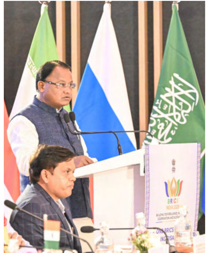
ସହକାରିତା କରିଆଣେ ବିପର୍ଯ୍ୟୟର ପ୍ରଭାବକୁ ଦୈନିକ କ୍ଷମତାର ଆବଶ୍ୟକତା ରହିଛି ।” ଯଥେଷ୍ଟ ହ୍ରାସ କରାଯାଇ ପାରିବ । ତେବେ, ଆଗାମୀ ଦିନର ଆହୁନଗୁଡ଼ିକ ପାଇଁ ଆହୁରି ଅଧିକ ପ୍ରୟାସ, ସୁଦୃଢ଼ ସହକାରିତା ଏବଂ ଉନ୍ନତ ବିଶ୍ୱସରୀୟ କ୍ଷମତାର ଆବଶ୍ୟକତା ରହିଛି ।

ବାତ୍ୟା, ଗ୍ରୀଷ୍ମ ପ୍ରବାହ, ବଜ୍ରପାତ, ଉପକୂଳ କ୍ଷୟ ଏବଂ ଜଳବାୟୁ ପ୍ରତିବଦ୍ଧତା ଆଶଙ୍କା ପ୍ରତି ଓଡ଼ିଶାର ଆଶଙ୍କା ବିଷୟରେ ଉଲ୍ଲେଖ କରି ଶ୍ରୀ ମାଝୀ ପ୍ରତିରୋଧ-ନିର୍ମାଣ ପଦକ୍ଷେପଗୁଡ଼ିକରେ ନିରନ୍ତର ନୂତନ ପଦକ୍ଷେପର ଆବଶ୍ୟକତା ଉପରେ ଆଲୋଚନା କରିଛନ୍ତି । ସେ କହିଛନ୍ତି, “ପୂର୍ବ ପ୍ରସ୍ତୁତି, ଦ୍ରୁତ ଅନୁଷ୍ଠାନ ଏବଂ କମ୍ପ୍ୟୁଟି