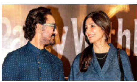
ପୁଣି ବିବାହ କରିବେ ଆମିର