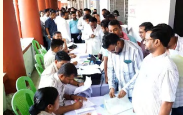
ପାଇଁ ଯୋଗ୍ୟ ବିବେଚିତ ହେଉଛି । ତେବେ ଗୋଟିଏ ମଦ ଦୋକାନ ପାଇଁ ହେଉଥିବା ଲଠେରୀ ଉଠାଇବା ପାଇଁ କିନ୍ତୁ ବେଶ୍ ଚତୁର୍ବତା ଲକ୍ଷ୍ୟ କରାଯାଉଛି ।

ସ୍ଥଳ ବିଶେଷରେ ଏଥିପାଇଁ ହୋଇଥିବା ଆଉ ୧୫ ଲକ୍ଷ ୩୦ ହଜାର ଆବେଦନକାରୀଙ୍କ ନାମ ଲଠେରୀରେ ଆସୁନାହିଁ । ସର୍ବ ମୁତାବକ ଲଠେରୀରେ ନାମ ଉଠି କି ନଠୁ ଏହି ୨ ଲକ୍ଷ ୩୦ ହଜାର ଆବେଦନ ଫି ସୁଦ୍ଧା ସେମାନେ ଆସିବ ନାହିଁ ଓ ତାହା ସରକାରୀ ତହସିଲରେ ହିଁ ରହିଯିବ । ଫଳରେ ସେମାନଙ୍କର ଲଠେରୀ ଉଠିଛି ସେମାନଙ୍କ ଆଉ ୫୧୦ ଟଙ୍କା ଆବେଦନ ନାମସ୍ତର ହେଲେ ବି ଲୁଚି ନାହିଁ । କିନ୍ତୁ ସେମାନଙ୍କ ନାମ ଲଠେରୀରେ ଉଠୁନାହିଁ ସେମାନଙ୍କ ସଂପୂର୍ଣ୍ଣ ଅର୍ଥ ଚାଲିଯିବ । ଏଠାରେ ଉଲ୍ଲେଖନୀୟ ଯେ ଓଡ଼ିଶାରେ ନିର୍ବାଚିତ ହାର ଜାତୀୟ ହାର ତୁଳନାରେ ଏମିତିକି ଗୁଜରାଟ, ବିହାର, ମହାରାଷ୍ଟ୍ର, ପଶ୍ଚିମବଙ୍ଗ, ଦିଲ୍ଲୀ ଆଦି ବହୁ ରାଜ୍ୟ ତୁଳନାରେ କେବଳ ଅଧିକ ରହିଛି । ଓଡ଼ିଶାରେ ବି ତମାଖୁ ସେବନକାରୀଙ୍କ ହାର ଅଧିକ । ନିର୍ବାଚିତ ହାରୀ ଦା ମେଖାଇବା ପାଇଁ ବିପୁଳ ପରିମାଣର ଟୋରା ନିଶା କାରବାର ମଧ୍ୟ ବନ୍ଦକରାଯାଇଛି । ଏ ପରିପ୍ରେକ୍ଷ୍ୟରେ ଲୋକେ ମନସ୍ତୁ ପଛ ମଦ ବେପାରରୁ ପାଇବା ଉଠାଇବା ପାଇଁ କିନ୍ତୁ ବେଶ୍ ଚତୁର୍ବତା ଲକ୍ଷ୍ୟ କରାଯାଉଛି ।