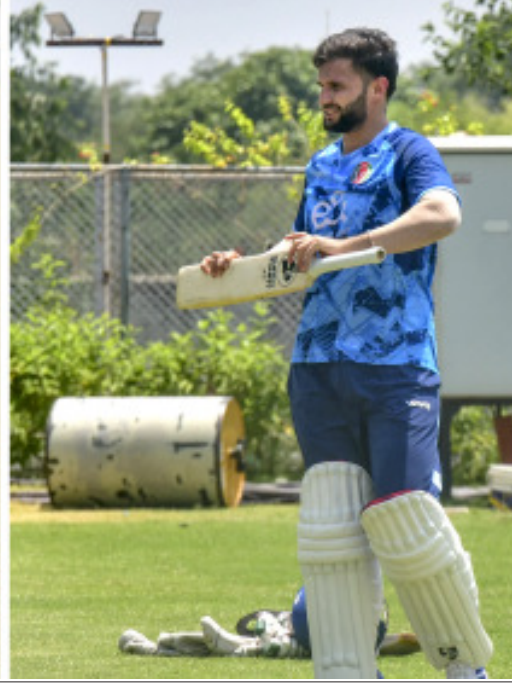
ଚାହେଁ, ତେବେ ଧ୍ରୁବ କୁରେଲ ଏକ ଭଲ ବିକେଟ ହୋଇପାରିବ । ଯଦି ଦଳ ଅତିରିକ୍ତ ବୋଲିଂ ବିକେଟ ଚାହୁଁଛି, ତେବେ ନାଟିଶ କ୍ରମରେ ରେଣୁ ଏକ ଭଲ ପସନ୍ଦ ହୋଇପାରିବ । ଭାରତ ୨