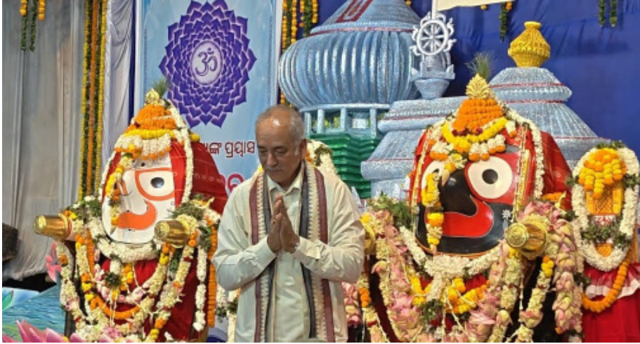
ଅଧରଙ୍ଗ(ମହାରାଜତ): ପୁରୀ ଜିଲ୍ଲା ଅଧରଙ୍ଗ ବ୍ଲକ ଆଳମ୍ପୁର ପଞ୍ଚାୟତ ବରପଦା ଗ୍ରାମ ଭାଗବତ ପଠିଆରେ