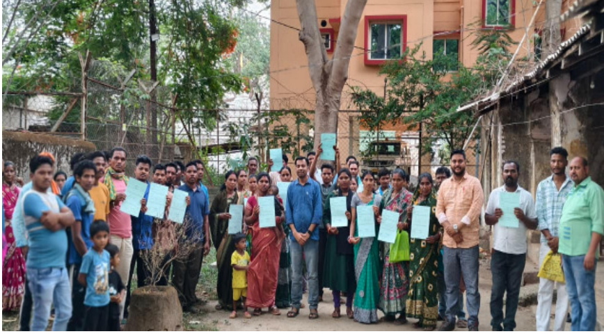
ଲେଖାଏଁ ସ୍ଵାଧୀନ ଘରକୁ ପଞ୍ଜୀକୃତ ମୁଖ୍ୟ ସ୍ତ୍ରୋତରେ ସାମିଲ ଠି ପରିବାର ଏବେ 'ପ୍ରଧାନମନ୍ତ୍ରୀ ଆବେଦନ' କରିଛନ୍ତି। ଏହା ଫଳରେ ଏହି ୯୨ ଆବାସ ଯୋଜନା' (ପିଏଏଏଆଇ) ସେବାରେ ନିଯୋଜିତ ରହିବାକୁ ପ୍ରତିଶ୍ରୁତିବଦ୍ଧ।

ଲାଞ୍ଜିଗଡ଼(ମହାଭାରତ): ସାମାଜିକ ସୁରକ୍ଷା ଏବଂ ସମ୍ମାନଜନକ ଜୀବନଯାପନର ମୂଳଦୁଆ ଉପରେ ହିଁ ପ୍ରକୃତ ବିକାଶର ସୌଧ ଗଢ଼ିଉଠେ। କେବଳ ଭୌତିକ ପ୍ରଗତି ନୁହେଁ, ବରଂ ପ୍ରତ୍ୟେକ ନାଗରିକଙ୍କୁ ସେମାନଙ୍କର ସାମ୍ବିଧାନିକ ଅଧିକାର ଏବଂ ସ୍ଵାଧୀନ ଠିକଣା ପ୍ରଦାନ କରିବା ହେଉଛି ପ୍ରଶାସନର ପ୍ରକୃତ ସମ୍ପର୍କ। ଏକ ନିର୍ଦ୍ଦିଷ୍ଟ ଠିକଣା କେବଳ ମାଟିର ଖଣ୍ଡିତ କାଗଜ ନୁହେଁ, ଏହା ବ୍ୟକ୍ତିର ଆତ୍ମବିଶ୍ଵାସର ପ୍ରତୀକ ଏବଂ ତା'ର ଭବିଷ୍ୟତ ଗଢ଼ିବାର ପ୍ରଥମ ପାହାଚ। ଦୀର୍ଘ ଦିନ ଧରି ଭୂମିହୀନ ହୋଇ ଅବହେଳିତ ଜୀବନ ବିତାଉଥିବା ୯୨ ଟି ପରିବାରଙ୍କୁ ୪ ଡେସିମିଲ