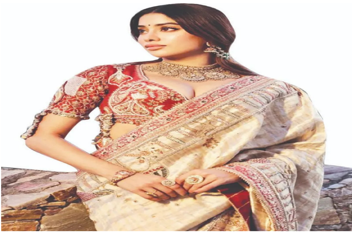
ନିଅନ୍ତି ଜାହ୍ନବୀ । ଆଉ ଭିଆଇପିଙ୍କ ପାଇଁ ଭବିଷ୍ୟ ଧାଡ଼ିରେ ନୟାଲ ସେ ପ୍ରତି ଥର ସାଧାରଣ ଲୋକଙ୍କ ପରି

ସିନେମା ହଲରେ ମଲିକାଭ କରିସାରିଛନ୍ତି ଅଭିନେତା ରାମ ଚରଣଙ୍କ ଅଭିନୀତ 'ପେଦି' । ତେଣେ ସିନେମାର ସଫଳତା ପାଇଁ ତିରୁପତିରେ ପହଞ୍ଚିଛନ୍ତି ନାୟିକା ଜାହ୍ନବୀ କପୁର । ସେ ଖାଲି ପାଦରେ ୩୫୫୦ ପାହାଚ ଚଢ଼ି ମନ୍ଦିରରେ ପୂଜାର୍ଚ୍ଚନା କରିଛନ୍ତି । ଏହି ସମୟର ଭିଡିଓ ଏବେ ଭାଇରାଲ୍ ହୋଇଛି । ତେବେ ଜାହ୍ନବୀ ଯେବେ ବି ତିରୁପତି ବାଲାଜୀଙ୍କ ଦର୍ଶନ କରିବାକୁ ଯାଆନ୍ତି, ପ୍ରତିଥର ଖାଲି ପାଦରେ ଯାଇଥାନ୍ତି । ଶ 1 ବର୍ଷ । ଦ ନିଅନ୍ତି । ଜୀବନର ପ୍ରତ୍ୟେକ ବଡ଼ କାମରେ ତିରୁପତି ଯାଇ ବାଲାଜୀଙ୍କ ଆଶୀର୍ବାଦ