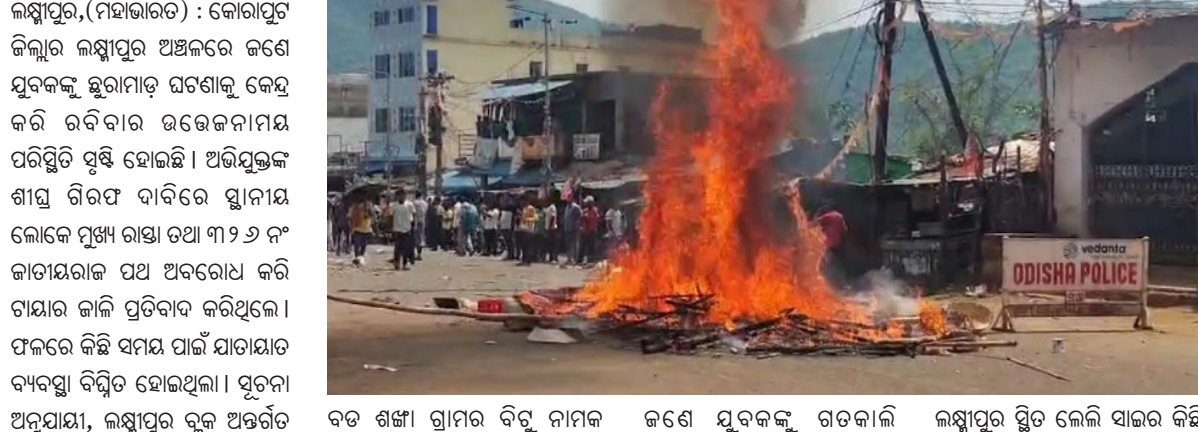
ବଡ଼ ଶଙ୍ଖା ଗ୍ରାମର ବିଦୁ ନାମକ ଜଣେ ଯୁବକଙ୍କୁ ଗତକାଳି ଲକ୍ଷ୍ମୀପୁର ସ୍ଥିତ ଲେଲି ସାଇର କିଛି