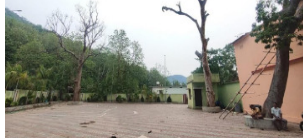
ଗଣିଆ (ମହାଭାରତ): ଗଣିଆ ବସଷାଣ୍ଡ ପରିସର ମଧ୍ୟରେ ଦୁଇଟି ଶୁଖିଲା ଗଛ ଏବେ ସ୍ଥାନୀୟ ଲୋକ ଓ ଯାତ୍ରୀମାନଙ୍କ ପାଇଁ 'ମରଣଯନ୍ତ୍ର' ପାଲଟିଛି । ଗଛ ଦୁଇଟି ସମ୍ପୂର୍ଣ୍ଣ ରୂପେ ଶୁଖିଯାଇ ମୃତ ଅବସ୍ଥାରେ ଠିଆ

ହୋଇଥିବାରୁ, ଏହା ଯେକୌଣସି ସମୟରେ ଭାଙ୍ଗି ପଡ଼ି ଏକ ବଡ଼ ଧରଣର ଅଘଟଣ ଘଟାଇବାର ଆଶଙ୍କା ସୃଷ୍ଟି କରିଛି । ଏହି ବସଷାଣ୍ଡ ପ୍ରତିଦିନ ଯାତ୍ରୀ, ଗାଡ଼ି ଚଳକ ଏବଂ ସ୍ଥାନୀୟ ଲୋକେ ଆସିଥାନ୍ତି । ଗଛଟି ଲୋକମାନେ ଯାତାଯାତ ସହ ଅନେକ ସମୟରେ ଗାଡ଼ି ମଧ୍ୟ ପାର୍ଶ୍ୱ କରାଯାଇଛି । ବିଭିନ୍ନ ସମୟରେ କାଳବୈଶାଖୀ ଯୋଗୁଁ ଶୁଖିଲା ଚାଳ ଭାଙ୍ଗି ଲୋକଙ୍କ ଉପରେ ପଡ଼ିବାର ସମ୍ପୂର୍ଣ୍ଣ ସମ୍ଭାବନା ରହିଛି । ଗୋଟିଏ ଗଛର ତାଳ ଏକ କୋଠା ଆଡ଼କୁ ଜଳି ରହିଥିବାରୁ ତାହା ଅଧିକ ବିପଦଜନକ ମନେହେଉଛି । ସ୍ଥାନୀୟ ଲୋକଙ୍କ କହିବା ଅନୁସାରେ, ଗଛ ଦୁଇଟି ଦୀର୍ଘ ଦିନ ହେବ ଏଭଳି ଶୁଖିଲା ଓ ଦୁର୍ବଳ ଅବସ୍ଥାରେ ରହିଛି । କୌଣସି ଧନକାନ୍ଦନ ହାରି ହେବା ପୂର୍ବରୁ ପ୍ରଶାସନ ଏହି ସମସ୍ୟା ପ୍ରତି ଦୃଷ୍ଟି ଦେବା କରୁରା ଏବଂ ପ୍ରଶାସନ ପକ୍ଷରୁ ତୁରନ୍ତ ପଦକ୍ଷେପ ନିଆଯାଇ ଏହି ବିପଦ ସଙ୍କୁଳ ଶୁଖିଲା ଗଛ ଦୁଇଟିକୁ କଟାଯିବାର ନିମନ୍ତେ ଅଞ୍ଚଳ ବାସୀ କ ପକ୍ଷରୁ ଦାବୀ ହେଉଅଛି ।