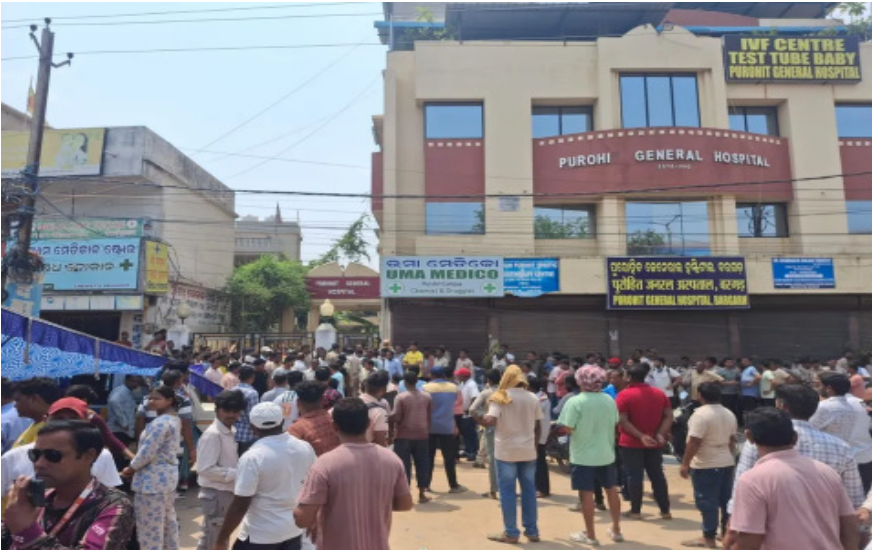
ପ୍ରତିବାଦରେ ଆଜି ଗୋଶାଳା ଛକରେ ଆୟୋଜନ କାରୀମାନେ ଦୋଷୀ ମୃତଦେହ ରଖି ଆୟୋଜନ କରାଯାଇଛି । ଉକ୍ତର ଓ ହସ୍ପିଟାଲ ବିରୋଧରେ କଡ଼ା କାର୍ଯ୍ୟାନୁଷ୍ଠାନ ଦାବି କରିଛନ୍ତି ।

ବରଗଡ଼: ବରଗଡ଼ରେ ଚିକିତ୍ସା ଅବହେଳାରୁ ରୋଗୀ ମୃତ୍ୟୁ ଅଭିଯୋଗ ହୋଇଥିବା ବେଳେ ରାଷ୍ଟ୍ରାବରୋଧ କରାଯାଇଛି । ଏଭଳି ଅଭିଯୋଗ ଆସିବା ପରେ ସ୍ଥାନୀୟ ଅଞ୍ଚଳରେ ଉତ୍ତେଜନା ପ୍ରକାଶ ପାଇଛି । ତୃତୀୟ ଚିକିତ୍ସା କାରଣରୁ ଜଣେ ଗର୍ଭବତୀ ମହିଳାଙ୍କ ମୃତ୍ୟୁ ହୋଇଥିବା ଅଭିଯୋଗ ଉଠିଛି । ସୂଚନା ଅନୁସାରେ, ମୃତ ମହିଳାଙ୍କ ଘର ଭଟଲି ବ୍ଲକ୍ ଅନ୍ତର୍ଗତ ହାତୀସର ଗାଁରେ । ସେ ଗତ ମେ ୧୩ ତାରିଖରେ ଚିକିତ୍ସା ପାଇଁ ଏକ ଘରୋଇ ହସ୍ପିଟାଲକୁ ଆସିଥିଲେ । ତାଙ୍କ ସ୍ଥିତି ଅନୁମତି ହୋଇ ଶେଷରେ ମୃତ୍ୟୁ ଘଟିଛି । ପରିବାର ଲୋକଙ୍କ ଅଭିଯୋଗ ଅନୁସାରେ, ଚିକିତ୍ସାରେ ତ୍ରୁଟି ହେବାରୁ ତାଙ୍କ ସ୍ଥିତିରେ ଅନୁମତି ହୋଇ ଶେଷରେ ମୃତ୍ୟୁ ଘଟିଛି । ଏହି ଘଟଣା ପରେ ପରିବାର ଲୋକେ ଚିକିତ୍ସାଳୟ ବିରୋଧରେ ଗୁରୁତର ଅଭିଯୋଗ ଆଣିଛନ୍ତି । ଘଟଣାର