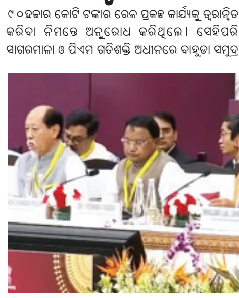
କେନ୍ଦ୍ରର ଓଡ଼ିଶା ସହାୟତା ପ୍ରକଳ୍ପ ଉପରେ ମଧ୍ୟ ମୁଖ୍ୟମନ୍ତ୍ରୀ ଶ୍ରୀ ମୋଦି ଗୁରୁତ୍ୱ ଦେଇଛନ୍ତି । ମୁଖ୍ୟମନ୍ତ୍ରୀ ଆହୁରି ମଧ୍ୟ କହିଛନ୍ତି ଯେ, କେନ୍ଦ୍ର ସରକାରଙ୍କ ପ୍ରସ୍ତାବିତ 'ପିଏମ୍ ସେଡୁ' ଯୋଜନା ଅଧୀନରେ ପ୍ରାୟ ୯୦କୋଟି ଟଙ୍କା ବ୍ୟୟରେ ୪ଟି କୁଣ୍ଡର

ନୂଆଦିଲ୍ଲୀ, ୧୧।୬: ପ୍ରଧାନମନ୍ତ୍ରୀ ନରେନ୍ଦ୍ର ମୋଦିଙ୍କ ଅଧିକାରୀଙ୍କ ଅନୁଷ୍ଠିତ ନିତି ଆୟୋଗର ୧୧ତମ ପରିଚାଳନା ପରିଷଦ ବୈଠକରେ ଓଡ଼ିଶା ନିଜର ବଳିଷ୍ଠ ପ୍ରସ୍ତାବ ଓ ଦାବି ଉପସ୍ଥାପନ କରିଛି । ବିଶେଷକରି ରେଳ ପ୍ରକଳ୍ପ କାର୍ଯ୍ୟକୁ ଦ୍ୱିଗୁଣିତ କରିବା, ନୂଆ ସେମିକଣ୍ଡକ୍ଟର ଶିଳ୍ପ ସ୍ଥାନ ଓ ସୁବିକଳ ବୈଷୟିକ ଚାଲିମ ପାଇଁ କେନ୍ଦ୍ରୀୟ 'ପିଏମ୍ ସେଡୁ' ଯୋଜନାର ଦ୍ରୁତ କାର୍ଯ୍ୟକାରୀତା ଓ ଗଞ୍ଜାମରେ ବାହୁଡ଼ା ବନ୍ଦରର ବିକାଶ ଉପରେ ଗୁରୁତ୍ୱ ଦେଇ କେନ୍ଦ୍ରୀୟ ସହାୟତା ଲୋଡ଼ିଛି ଓଡ଼ିଶା ।