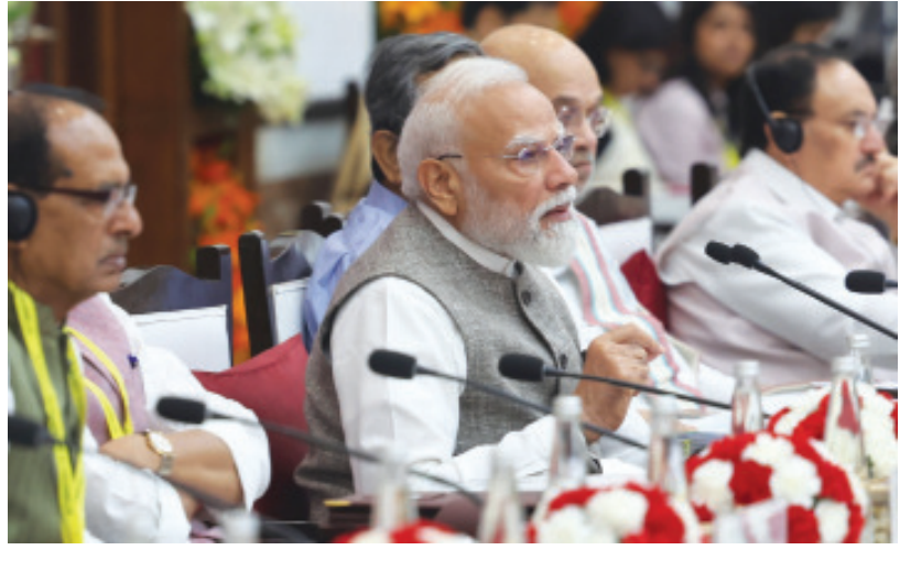
ପ୍ରଧାନମନ୍ତ୍ରୀ ଉଲ୍ଲେଖ କରିଛନ୍ତି ଯେ, ଏଭଳି ଏକ ସମୟରେ ଯେତେବେଳେ ଅନେକ ପ୍ରମୁଖ ଅର୍ଥନୀତି ଅନୁଷ୍ଠିତ ଏବଂ ଅର୍ଥନୈତିକ ଆହ୍ୱାନର ସାମ୍ନା କରୁଛନ୍ତି, ଭାରତର ବିକାଶ କାହାଣୀ ସମଗ୍ର ବିଶ୍ୱକୁ ପ୍ରେରିତ କରିପାରିବ । ସେ ଆତ୍ମନିର୍ଭରଶୀଳତା ଦିଗରେ ଦେଶର ସଂକଳ୍ପ ଆହୁରି ସୁଦୃଢ଼ କରିବାର ଆବଶ୍ୟକତା ଉପରେ ଗୁରୁତ୍ୱାରୋପ କରିଛନ୍ତି ଏବଂ ବିଶେଷ କରି ଅଧ୍ୟୟନ ଶକ୍ତି କ୍ଷେତ୍ରରେ ବିଶ୍ୱର ସର୍ବୋତ୍ତମ ଅଭିଯୋଗକୁ ଗ୍ରହଣ ଓ କାର୍ଯ୍ୟକାରୀ କରିବାର ଗୁରୁତ୍ୱ ଉପରେ ଆଲୋଚନା କରିଛନ୍ତି । ସହଭାଗୀ ସଂସାଧନ ବ୍ୟବସ୍ଥାର ଗୁରୁତ୍ୱ ଉପରେ ଆଲୋଚନା କରି ପ୍ରଧାନମନ୍ତ୍ରୀ କହିଛନ୍ତି ଯେ, ଏକ 'ବିକଶିତ ଭାରତ'ର ଲକ୍ଷ୍ୟ ହାସଲ କରିବା ପାଇଁ କେନ୍ଦ୍ର ଏବଂ ରାଜ୍ୟଗୁଡ଼ିକୁ ମିଳିମିଶି କାର୍ଯ୍ୟ କରିବାକୁ ହେବ । ସେ ଗୁରୁତ୍ୱ ଦେଇ କହିଛନ୍ତି ଯେ ବିକଶିତ ଭାରତର ସଂକଳ୍ପ ପ୍ରତ୍ୟେକ ରାଜ୍ୟ, ଜିଲ୍ଲା, ବ୍ଲକ୍

ନୂଆଦିଲ୍ଲୀ, ୧୧।୬(ପିଆଇବି): ପ୍ରଧାନମନ୍ତ୍ରୀ ନରେନ୍ଦ୍ର ମୋଦି ଆଜି ପୂର୍ବାହ୍ନରେ ନୂଆଦିଲ୍ଲୀର ରାଷ୍ଟ୍ରପତି ଭବନ ସାଂସ୍କୃତିକ କେନ୍ଦ୍ରରେ ନାଚି ଆୟୋଗର ୧୧ତମ ଗଭର୍ଣ୍ଣ କାଉନସିଲ୍ ବୈଠକରେ ଅଧିକାରୀଙ୍କୁ କହିଛନ୍ତି । 'ବିକଶିତ ଭାରତ ୨୦୪୭ ପାଇଁ ସମାବେଶୀ ମାନବ ବିକାଶ' ଚଳିତ ବର୍ଷ ବୈଠକର ମୁଖ୍ୟ ବିଷୟ ଥିଲା । ଏଥିରେ ୨୮ଟି ରାଜ୍ୟ ଏବଂ ୫ଟି କେନ୍ଦ୍ରଶାସିତ ଅଞ୍ଚଳକୁ ପ୍ରତିନିଧିତ୍ୱ କରୁଥିବା ମୁଖ୍ୟମନ୍ତ୍ରୀ, ଉପରାଜ୍ୟପାଳ ଏବଂ ପ୍ରଶାସକମାନେ ଯୋଗ ଦେଇଥିଲେ । ନାଚି ଆୟୋଗର ଗଭର୍ଣ୍ଣ କାଉନସିଲ୍ ବୈଠକରେ ସମସ୍ତ ୨୮ଟି ରାଜ୍ୟର ମୁଖ୍ୟମନ୍ତ୍ରୀ ଅଂଶଗ୍ରହଣ କରିବା ସ୍ୱୟଂ ଏକ କିର୍ତ୍ତୀମୁଖ୍ୟ ସୃଷ୍ଟି କରିଛି ।