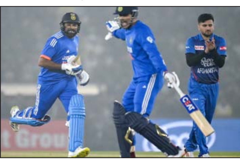
ସାମାରେ ପହଞ୍ଚିଥିଲା । ଅନେକ ପ୍ରଶଂସକ ଶୁବମନ ଗିଲଙ୍କୁ 'ସ୍ୱାର୍ଥପର' ଆଖ୍ୟା ଦେଇଛନ୍ତି । କାରଣ ଏହା ପ୍ରଥମ ଥର ନୁହେଁ । ୨୦୨୪ରେ ଆଫଗାନିଷ୍ଟାନ ବିରୋଧରେ ଏକ ଟି-୨୦ ମ୍ୟାଚ୍‌ରେ ମଧ୍ୟ ସମାନ ଢଙ୍ଗରେ ରୋହିତ ରନ

ଧର୍ମଶାଳା, ୧୫.୬: କୁନ୍ ୧୩ ତାରିଖ । ଭାରତୀୟ କ୍ରିକେଟ୍ ପ୍ରୋମାଙ୍କ ପାଇଁ ଏହା କେବଳ ଏକ ସାଧାରଣ ଦିନିକିଆ ମ୍ୟାଚ୍ ନଥିଲା, ବରଂ ଏହା ଯେଉଁ ଟିମ୍ ଲକ୍ଷ୍ମଣର ପୂର୍ବତନ ଅଧିନାୟକ ତଥା 'ହିଟମ୍ୟାନ୍' ରୋହିତ ଶର୍ମା ପୁଣିଥରେ ନାକ ଜର୍ସି ପିନ୍ଧି ମିଡ଼ାନ୍ କୁ ଓହ୍ଲାଇଥିଲେ । କିନ୍ତୁ କିଏ ଜାଣିଥିଲା, ଯେଉଁ ପ୍ରତ୍ୟାବର୍ତ୍ତନକୁ ନେଇ କ୍ରିକେଟ୍ ଜଗତରେ ଏତେ ଉତ୍ସାହ ଥିଲା, ତାହା ଏକ ଅପ୍ରତ୍ୟାଶିତ ଓ ଦୁଃଖଦ ମୋଡ଼ରେ ଶେଷ ହେବ । ମ୍ୟାଚ୍ ଆରମ୍ଭରୁ ରୋହିତ ବେଶ୍ ଆତ୍ମବିଶ୍ୱାସୀ ଦେଖାଯାଉଥିଲେ । ମାତ୍ର ଷଷ୍ଠ ଓଭରର ଚତୁର୍ଥ ବଲ୍ ସବୁକ୍ରିକ୍ ଓଲଟପାଲଟ କରିଦେଲା । ରୋହିତ ଏକ ସୁନ୍ଦର ଶର୍ଟ ଖେଳି ରନ ପାଇଁ ବୋଲିବାକୁ ଚେଷ୍ଟା କରିଥିଲେ । ସେ ନନ-ଷ୍ଟ୍ରାଇକର ଏଣ୍ଡରେ ଥିବା ଶୁବମନ ଗିଲଙ୍କୁ ସଙ୍କେତ ଦେଇ ସାରିଥିଲେ । ରୋହିତ ଥିବା ବାଟକୁ ଗାଳି ଆସିଥିଲେ ମଧ୍ୟ ଗିଲ୍ ନିଜ କ୍ରିକ୍ ଛାଡ଼ି ନଥିଲେ । ଏହି ତାଳମେଳର ଅଭାବ ଯୋଗୁଁ ରୋହିତ ଶେଷରେ ରନ ଆଉଟ୍ ହୋଇଥିଲେ । ମାତ୍ର ୧୬ ରନରେ ତାଙ୍କ ପାରି