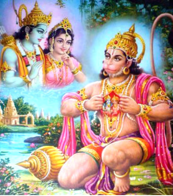
ପ୍ରଭୁ ଶ୍ରୀରାମଙ୍କ ଭକ୍ତ ହନୁମାନ ନିଜ ଭକ୍ତମାନଙ୍କ ଦୁଃଖ ଦୁର୍ଦ୍ଦଶା ସହି ପାରନ୍ତି ନାହିଁ । କାରଣ ହନୁମାନ ଖୁବ୍ ଦୟାଳୁ ବୋଲି ଶାସ୍ତ୍ରରେ ବର୍ଣ୍ଣନା କରାଯାଇଛି । ନିଷୀର ସହ ହନୁମାନଙ୍କ ପୂଜା କଲେ ସେ

ପ୍ରସନ୍ନ ହୋଇଥାନ୍ତି । ତେବେ ଆସନ୍ତୁ ଜାଣିବା କେଉଁ ସମୟରେ ହନୁମାନଙ୍କ ପୂଜାର୍ଚ୍ଚନା କରାଯାଏ । ଶାସ୍ତ୍ର ବର୍ଣ୍ଣନା ଅନୁସାରେ ପ୍ରଭୁ ହନୁମାନ ଦିନସାରା ଭଗବାନ ଶ୍ରୀରାମଙ୍କ ସେବାରେ ଲାଗିଥାନ୍ତି । ତେଣୁ ରାତି କିମ୍ବା ସଂଧ୍ୟାରେ ପ୍ରଭୁ ଶ୍ରୀରାମ ବିଶ୍ରାମ ନେବା ସମୟରେ ହନୁମାନ ତାଙ୍କ ସେବା କରି ନ ଥାନ୍ତି । ଏହି ସମୟରେ ସେ ନିଜ ଭକ୍ତଙ୍କର ଦ୍ଵାକ ସହକରେ ଶୁଣି ଥାଆନ୍ତି । ତେଣୁ ସଂଧ୍ୟା ଅଥବା ରାତିରେ ଶ୍ରଦ୍ଧାର ସହ ହନୁମାନଙ୍କ ପୂଜାର୍ଚ୍ଚନା କଲେ ଭକ୍ତ ସମସ୍ତ ମନବାଞ୍ଛିତ ଫଳ ପ୍ରାପ୍ତି ହୋଇଥାଏ । ଶାକ୍ତ ପରିବେଶରେ ଏକାଗ୍ରତାର ସହ ସଂଧ୍ୟାରେ ପ୍ରଭୁଙ୍କୁ ପୂଜା କଲେ ଆଶୀର୍ବାଦ ମିଳିବା ସହ ଜୀବନରେ ଥିବା ବାଧାବିଘ୍ନ ଦୂର ହୋଇଥାଏ । ହନୁମାନଙ୍କ ପୂଜାର୍ଚ୍ଚନା ସହ ହନୁମାନ ଚାଳିଶା ପାଠ କଲେ ହନୁମାନ ପ୍ରସନ୍ନ ହୋଇଥାନ୍ତି ଓ ଶ୍ରଦ୍ଧାଳୁଙ୍କୁ ମନବାଞ୍ଛିତ ଫଳ ପ୍ରାପ୍ତି ହୋଇଥାଏ ।