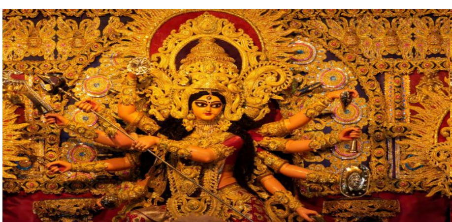
ହାତପରାକ୍ରିୟା ଏବଂ ଇଚ୍ଛା) ଯ ଶଙ୍ଖ- ଶଙ୍ଖ ଶବ୍ଦ ଓମ୍ ନାମକ ଶୁଦ୍ଧ ଏବଂ ପବିତ୍ର ଧ୍ଵନିର ପ୍ରତୀକ ଅଟେ ଯେଉଁଠାରୁ ବ୍ରହ୍ମାଣ୍ଡର ସମସ୍ତ ସୃଷ୍ଟି ହୋଇଥିଲା । ଏହାକୁ ଭଗବାନ ବରୁଣ ଉପହାର ଦେଇଥିଲେ । ସୁଦର୍ଶନ ଚକ୍ର -ଚକ୍ର ହେଉଛି ଭଗବାନ ବିଷ୍ଣୁଙ୍କ ଏକ ଉପହାର ଯାହାର ପ୍ରତୀକ ଅଟେ ଯେ ଜଗତ ଦୁର୍ଗାଙ୍କ ଦ୍ଵାରା ନିୟନ୍ତ୍ରିତ, ଯିଏ ସୃଷ୍ଟି କେନ୍ଦ୍ର ଅଟେ ଏବଂ ବ୍ରହ୍ମାଣ୍ଡ ତାଙ୍କ ଚରିତ୍ରାଗରେ ଚାଲି ଚାଲୁଛି । ଏହା ମଧ୍ୟ ଧାର୍ମିକତା କିମ୍ବା ଧର୍ମର ପ୍ରତୀକ ଅଟେ ଯେହେତୁ ଏହା ଦେବୀଙ୍କ ଆକୃତିରେ ରୂପିତ କରେ । ଏହି ଅସ୍ତ୍ର ସମସ୍ତ ମୟକୁ ନଷ୍ଟ କରିବା ଏବଂ ଧାର୍ମିକମାନଙ୍କୁ ସୁରକ୍ଷା ଦେବା ପାଇଁ ବ୍ୟବହୃତ ହୁଏ । ପଦ୍ମ- ପଦ୍ମ ହେଉଛି ଭଗବାନ ବ୍ରହ୍ମାଣ୍ଡର ପ୍ରତୀକ ଯାହା ଜ୍ଞାନର ପ୍ରତୀକରୂପେ କରେ । ଅନ୍ଧକାର ସମୟରେ ମନରେ ଆଧ୍ୟାତ୍ମିକ

ଦେବୀ ଦୁର୍ଗା ସବୁଠାରୁ ଶକ୍ତିଶାଳୀ । ତାଙ୍କୁ ପୃଥିବୀର ସମସ୍ତ ରାକ୍ଷାସ ମାନଙ୍କୁ ହଟାଇବା ପାଇଁ ଅନେକ ଲକ୍ଷ୍ମରକ ମିଳିତ ଶକ୍ତି ପ୍ରଦାନ କରାଯାଇଛି । ଦେବୀଙ୍କ ସୁରକ୍ଷାକୁ ସୁରକ୍ଷିତ କରେ, ଯାହା ଆକାଶରୁ ପୃଥିବୀ ଯାଏଁ । ବାସ୍ତବରେ, ଦେବୀଙ୍କର ଶକ୍ତି ତାଙ୍କ ଦଶ ହାତରେ ଅସ୍ତ୍ର ଭାବରେ ଚିତ୍ରିତ ହୋଇଛି । ଅସ୍ତ୍ରଶସ୍ତ୍ର ପ୍ରତୀକ ଏବଂ ଅର୍ଥ ଜାଣନ୍ତୁ-ତ୍ରିଶୂଳ-ଭଗବାନ ଶିବଙ୍କ ଦ୍ଵାରା ଉପହାର ପ୍ରାପ୍ତ ତ୍ରିଶୂଳ ରେ ତିନୋଟି ତାଞ୍ଜ ଧାର ଅଛି ଯାହା ତିନୋଟି ସୁଖର ପ୍ରତୀକ ଅଟେ- ଚନ୍ଦ୍ରମାସ (ଶାନ୍ତି, ନିଶ୍ଚିନ୍ତା), ସତ୍ୟ (ପରିପ୍ରାଣ), ସକରାତ୍ମକତା ଏବଂ ଶୁଦ୍ଧତା) ଏବଂ ରାଜା (ଶାନ୍ତି,