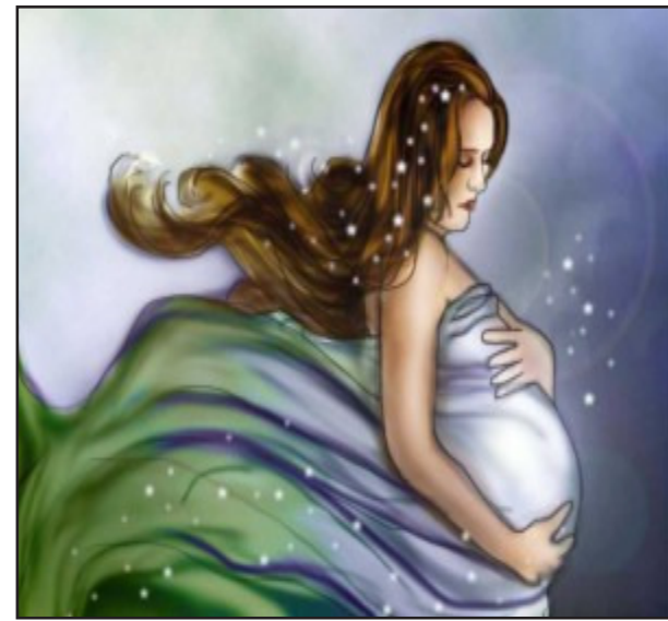
ଦୃଷ୍ଟି ମାନସିକତା ପ୍ରଭୃତିର ପ୍ରଭାବ ଶିଶୁ ଉପରେ ପଡ଼ିଥାଏ । ବାମ୍ବନୀ ଜୀବନର ଶ୍ରେଷ୍ଠ ଉଦ୍ଦେଶ୍ୟ ସର୍ବ ଗୁଣାବଳୀ, ସ୍ୱାସ୍ଥ୍ୟବାନ, ଚରିତ୍ରବାନ ଏବଂ ଯଶଶ୍ରୀ ସନ୍ତାନ ପ୍ରାପ୍ତ କରିବା । ଏଥିପାଇଁ ଗର୍ଭାଧାନ ସଂସ୍କାର

ପ୍ରସ୍ତୁତି ବୋଧ ଦୂର ହୋଇଥାଏ । ଯାହାଫଳରେ ଉତ୍ତମ ସନ୍ତାନ ପ୍ରାପ୍ତି ହୋଇଥାଏ । ମାତା-ପିତାଙ୍କ ସଂଯୋଗରେ ସନ୍ତାନର ଉତ୍ପତ୍ତି ହୋଇଥାଏ ଏବଂ ଏହି ସଂଯୋଗକୁ ଗର୍ଭାଧାନ ସଂସ୍କାର ବୋଲି ହିନ୍ଦୁ ଧର୍ମର ସଂସ୍କାର ପର୍ବରେ ପ୍ରାରମ୍ଭରେ କୁହାଯାଇଛି । ଗର୍ଭସ୍ଥାପନ ପରେ ଅନେକ ପ୍ରକାର ପ୍ରାକୃତିକ ପ୍ରକୃତି ଆକ୍ରମଣ କରିଥାଏ, ଯେଉଁଥିରୁ ରକ୍ଷା ପାଇବା ପାଇଁ ଏହି ସଂସ୍କାର ବ୍ୟବସ୍ଥା ରହିଛି । ମାତା-ପିତାଙ୍କ ବିଚାରଧାରା ସହିତ ଗର୍ଭସ୍ଥ ଶିଶୁ ଉପରେ ପ୍ରଭାବ ପକାଇଥାଏ । ମାତା-ପିତାଙ୍କ ମାଦକ ଦ୍ରବ୍ୟ ସେବନ,