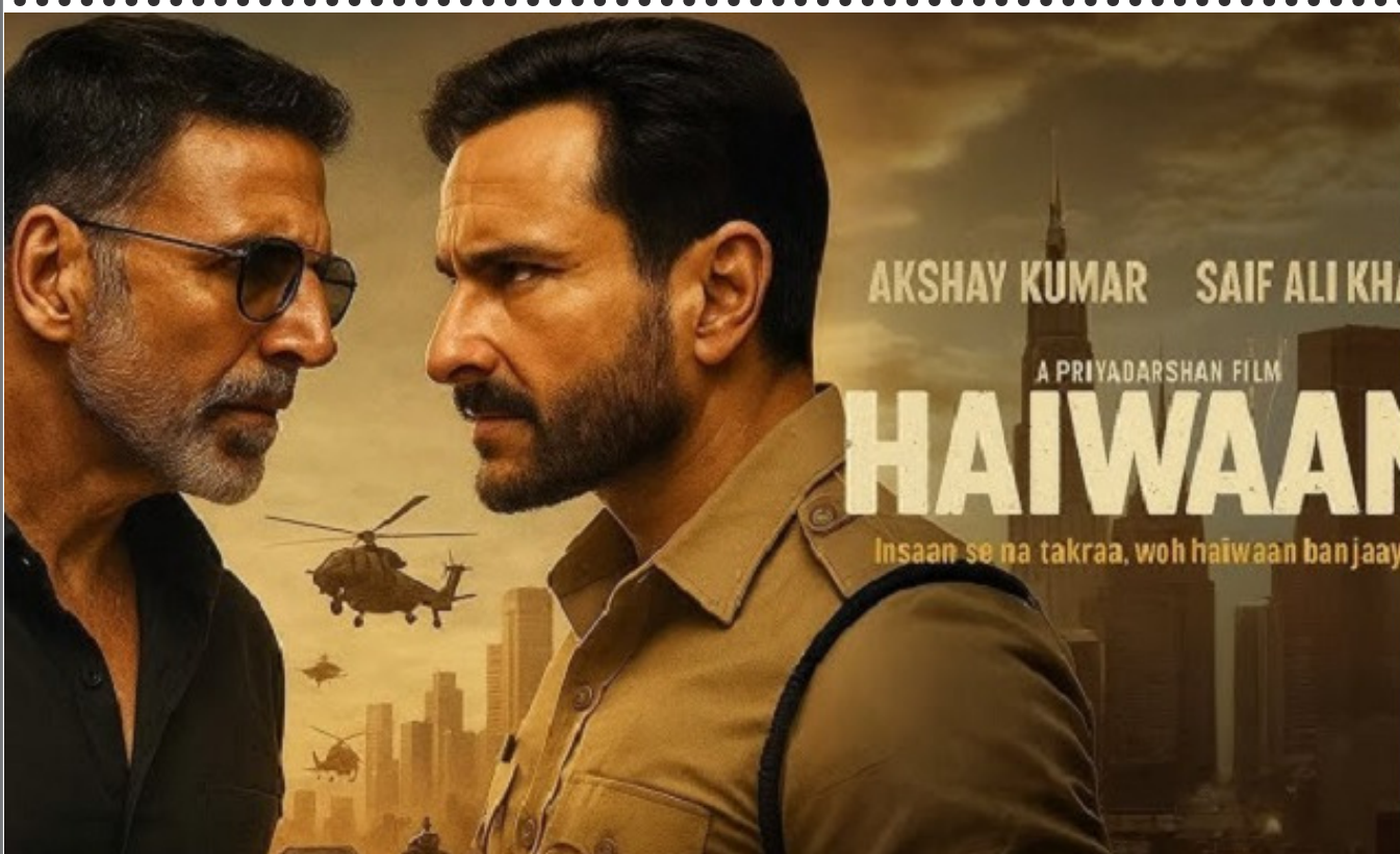
ଫିଲ୍ମ ଭୂତ ବଙ୍ଗଳାକୁ ସଫଳତା ମିଳିବା ପରେ ନିର୍ଦ୍ଦେଶକ ପ୍ରିୟଦର୍ଶନ ଆଗାମୀ ଫିଲ୍ମ ହେବା ନିଲିକ କରିବା ପାଇଁ ପ୍ରସ୍ତୁତ ରହିଛନ୍ତି । ଫିଲ୍ମ ସେପ୍ଟେମ୍ବରରେ ରିଲିଜ୍ ହେବ । ଏହି ଫିଲ୍ମରେ ବଲିଉଡର ଫ୍ୟାନ୍ସ ଖୁସି ରହିଛନ୍ତି । କିନ୍ତୁ ଏଥର ଏ ଦୁହେଁ ଯୋଡି ଭାବେ ନୁହେଁ ବିଲକୁଲ ଅଲଗା ଅନ୍ତରାଳରେ ନଜର ଆସିବେ ଯଶବର ମୁତାବକ, ଏହି ଫିଲ୍ମରେ ଅକ୍ଷୟ କୁମାର ଖଳନାୟକ ଭୂମିକାରେ ନଜର ଆସିବେ । ଏହି ଫିଲ୍ମରେ କାମ କରିବା ବହୁତ ମଜାଦାର ରହିବ ବୋଲି ସୈଫ କହିଛନ୍ତି । ଅକ୍ଷୟଙ୍କୁ ଏଭଳି ଭୂମିକାରେ ଦେଖି ବହୁତ ଉତ୍ସାହିତ ରହିଛନ୍ତି ସୈଫ । ସୈଫ କହିଛନ୍ତି ଯେ ଦର୍ଶକମାନେ ଏହି ଫିଲ୍ମରେ ତାଙ୍କ ଏବଂ ଅକ୍ଷୟଙ୍କ ପୁରୁଣା କମିକ୍ କମେଡି ଆଶା କରୁଥିବା ବେଳେ ଏଥର କିଛି ଭିନ୍ନ ହେବ । ହେବାନ ଆମର କମିକ୍ କମେଡି ଉପରେ ଆଧାରିତ ଫିଲ୍ମ ନୁହେଁ, ଏବଂ ମୁଁ ଭାବୁଛି ଏହା ଏକ ଭଲ କଥା । ଏପରି ଫିଲ୍ମଗୁଡ଼ିକର ସମୟ ଥିଲା । ଯଦି ଭବିଷ୍ୟତରେ ଏକ ଭଲ କମେଡି ସ୍କ୍ରିପ୍ଟ ଆସେ, ତେବେ ନୁହେଁ ପୁଣି ଏକାଠି ଦେଖାଯାଇପାରିବ ।