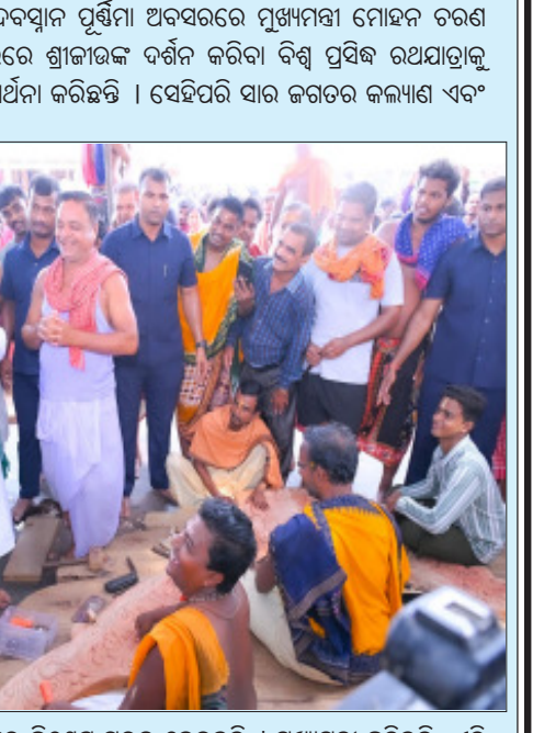
ଏହା ପରେ ମୁଖ୍ୟମନ୍ତ୍ରୀ ବଡ଼ଦାଣ୍ଡ ସ୍ଥିତ ରଥଖଳାରେ ପହଞ୍ଚି ପବିତ୍ର ଶ୍ରୀଜଗନ୍ନାଥ ରଥଯାତ୍ରା ପାଇଁ ଚାଲିଥିବା ରଥ ନିର୍ମାଣ କାର୍ଯ୍ୟର ଅଗ୍ରଗତି ସମୀକ୍ଷା କରିଛନ୍ତି । ରଥ ସମାପନ ପାଇଁ ମହାପ୍ରଭୁଙ୍କୁ ସମ୍ମାନ ଜଣାଇବା ପାଇଁ ଆଲୋଚନା କରି ସେମାନଙ୍କ ମତାମତ ଓ ଆବଶ୍ୟକତା ବିଷୟରେ ଜାଣିବା ସହ ରଥ ନିର୍ମାଣ କାର୍ଯ୍ୟକୁ ଆଧିକାରୀଙ୍କୁ

ପୁରୀ, ୨୯।୬(ମହାଭାରତ): ମହାପ୍ରଭୁଙ୍କ ଦେବସ୍ନାନ ପୂର୍ଣ୍ଣିମା ଅବସରରେ ମୁଖ୍ୟମନ୍ତ୍ରୀ ମୋହନ ଚରଣ ମାଝୀ ପୁରୀ ଗସ୍ତ କରିଛନ୍ତି । ମୁଖ୍ୟମନ୍ତ୍ରୀ ଶ୍ରୀମନ୍ଦିରରେ ଶ୍ରୀରାଜଙ୍କ ଦର୍ଶନ କରିବା ବିଶ୍ୱ ପ୍ରସିଦ୍ଧ ରଥଯାତ୍ରାକୁ ସୁରୁଖୁରେ ସମାପନ ପାଇଁ ମହାପ୍ରଭୁଙ୍କ ନିକଟରେ ପ୍ରାର୍ଥନା କରିଛନ୍ତି । ସେହିପରି ସାର ଜଗତର କଳ୍ୟାଣ ଏବଂ ସମୃଦ୍ଧ ଓଡ଼ିଶା ପାଇଁ ପ୍ରାର୍ଥନା କରିଛନ୍ତି ।