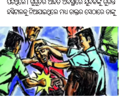
ପୂର୍ତ୍ତ ଘୋଷଣା କରିଥିଲେ । ପ୍ରାଥମିକ ତଦନ୍ତରୁ ଜଣାପଡ଼ିଛି ବିବାଦକୁ କେନ୍ଦ୍ର କରି ଏହି ହତ୍ୟାକାଣ୍ଡ ଘଟିଥିବା ସନ୍ଦେହ କରାଯାଇଛି । ଏହା ପଛରେ ସୁପାରି କିଲରଙ୍କ ହାତ

ଭୁବନେଶ୍ୱର, ୨୯।୬(ମହାଭାରତ): : ରାଜଧାନୀ ଭୁବନେଶ୍ୱରରେ ଘଟିଛି ଏକ ଲୋମହର୍ଷଣକାରୀ ହତ୍ୟାକାଣ୍ଡ । ଖଣ୍ଡଗିରି ଥାନା ଅନ୍ତର୍ଗତ କୋଳଧୁଆ ଛକ ନିକଟରେ ବିକାଶିତ ରିଭିଟିଙ୍ଗ ଉପକ୍ରମ ପୂର୍ଣ୍ଣାପନା ପୂର୍ବରୁ ଜଣେ ଯୁବକଙ୍କୁ ଡାକ ପରିବାର ଲୋକଙ୍କ ସାମ୍ମୁଖେ ଅତି ନିର୍ଦା ଭାବେ ପିଟିପିଟି ହତ୍ୟା କରିଥିବା ଅଭିଯୋଗ ହୋଇଛି । ଘଟଣାକୁ ନେଇ ସମଗ୍ର ଅଞ୍ଚଳରେ ଚାଞ୍ଚଳ୍ୟ ଖେଳିଯାଇଛି । ପୁରୀ ଅଞ୍ଚଳରେ ବିକାଶିତ ରିଭିଟିଙ୍ଗ ପୂର୍ଣ୍ଣାପନା ପୂର୍ବରୁ ହତ୍ୟା ଯୁବକଙ୍କ ଘର ନିକଟରେ ପହଞ୍ଚି ଡାକୁ ଚାଟୋଟି କରିଥିଲେ । ପରିବାର ଲୋକେ ବାଧ୍ୟ ଦେବାକୁ ଚେଷ୍ଟା କରିଥିଲେ ମଧ୍ୟ ପୁରୁଣାମାନେ ସେମାନଙ୍କୁ ଧମକ ଦେଇ ଯୁବକଙ୍କୁ ଲୁହା ରତ୍ନ ଓ ଅନ୍ୟାନ୍ୟ ମାରଣାସ୍ତ୍ରରେ ନିରକ୍ଷୟ ଭାବେ