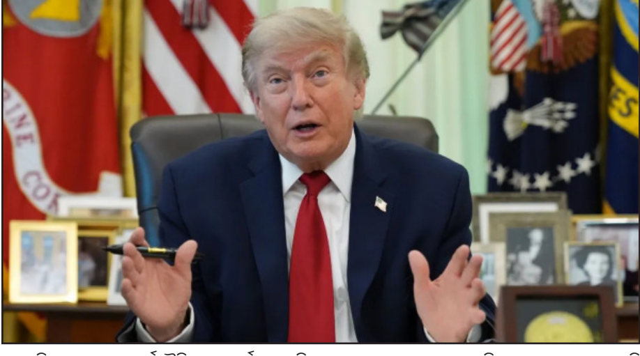
ନ୍ୟୁଆଦିଲ୍ଲୀ: ଭାରତର ଅର୍ଥନୈତିକ ବିକାଶକୁ ଆମେରିକା ରାଷ୍ଟ୍ରପତି ଡୋନାଲ୍ଡ୍ ଟ୍ରମ୍ପ ପ୍ରଶଂସା କରିଛନ୍ତି । ଭାରତ ଅତ୍ୟନ୍ତ ଭଲ ପ୍ରଦର୍ଶନ କରୁଛି ବୋଲି ସେ କହିଛନ୍ତି । ଗତବର୍ଷ ଜୁଲାଇ ମାସରେ ସେ ଭାରତକୁ ଏକ ପୂର୍ତ୍ତ ଅର୍ଥନୀତି ବୋଲି କହିବା ପରେ ଏବେ ତାଙ୍କ ମତ ବଦଳାଇଛନ୍ତି । ଆମେରିକାର ସ୍ୱାଧୀନତା ଦିବସ ପୂର୍ବରୁ ସିଏଏସ୍‌ସିକୁ ଦେଇଥିବା ସାକ୍ଷାତକାରରେ ଟ୍ରମ୍ପ କହିଛନ୍ତି କେତେକ ଦେଶ ଅଛନ୍ତି ଯେଉଁମାନଙ୍କର ଅର୍ଥନୀତି ଭଲ ପ୍ରଦର୍ଶନ କରୁଛି । ସେଥିରେ ଭାରତ ଅନ୍ୟତମ । ଭାରତର ଅଭିବୃଦ୍ଧି ୭ରୁ ୮ ପ୍ରତିଶତ ରହିଛି । ଆମେରିକାକୁ ଅଧିକ ଧରଣରେ ବୃଦ୍ଧିକୁ ଦିଆଯିବା ଆବଶ୍ୟକ ବୋଲି ସେ ମତ ଦେଇଛନ୍ତି । ସାକ୍ଷାତକାର ସମୟରେ ସେ ଆମେରିକା ଅର୍ଥନୀତିର ସାମର୍ଥ୍ୟକୁ ଦର୍ଶାଇବା ସହିତ ସୁଧ ହାର ସମ୍ପର୍କରେ ଫେଡ଼େରାଲ୍ ରିଜର୍ଭର ଆଭିମୁଖ୍ୟକୁ ସମାଲୋଚନା କରିଥିଲେ । ଏଥିପାଇଁ ଭାରତର ଉଦାହରଣ ଦେଇଥିଲେ । ଭଲ ଅର୍ଥନୈତିକ ଅଭିବୃଦ୍ଧି ହାସଲ କରୁଥିବା ଦେଶଗୁଡ଼ିକରେ କଠୋର ପ୍ରତ୍ୟାହତ ଗ୍ରହଣ କରି ତାହାକୁ ବ୍ୟାହତ ପହଞ୍ଚାଇବା ଆବଶ୍ୟକ ବୋଲି ସେ ମତ ଦେଇଛନ୍ତି । ଆମେରିକାର ଅର୍ଥନୈତିକ ଅଭିବୃଦ୍ଧି ୪ ପ୍ରତିଶତରେ ରହିବାର କୌଣସି କାରଣ ନାହିଁ । କିଛି ଅଭିବୃଦ୍ଧି ୧୨ରୁ ୧୩ ପ୍ରତିଶତ ହେବା ଆବଶ୍ୟକ । ତଥାପି ଆମେରିକା ସୁଦୂର୍ଗ ସ୍ତରରେ ରହିଛି । ପୂର୍ବପେକ୍ଷା ଏବେ ଦେଶରେ ଅଧିକ କଳ୍ପନା ନିର୍ମାଣ ହେଉଛି । ନିୟୁଜି ରେକର୍ଡ ସ୍ତରରେ ରହିଛି ।