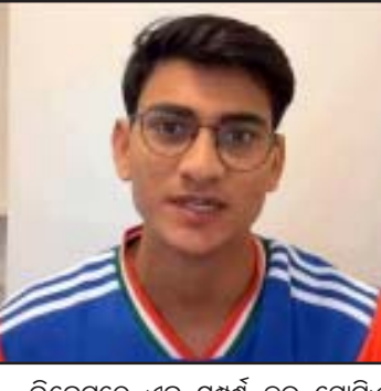
କ୍ରିକେଟରେ ଏକ ସମ୍ପୂର୍ଣ୍ଣ ଦଳ ଗୋଟିଏ ମ୍ୟାଚରେ ତେରୁ କରିବା ବିରଳ । ଭାରତୀୟ ୧୯ ବର୍ଷରୁ କମ୍ ବୟସ୍କ ନାମ ଶ୍ରୀଲଙ୍କା