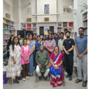
କଟକ:ଓଡ଼ିକ୍ ବୁକଫେୟାର୍ସ (Walking BookFairs) କଟକ ପକ୍ଷରୁ ଆୟୋଜିତ

ପାରଳାଖେମୁଣ୍ଡି, ଗଜପତି ଜିଲ୍ଲାରେ ଗୁଣି ସନ୍ଦେହରୁ ଏକ ଗ୍ରାମର ମଝିରେ ଜଣେ ବୃଦ୍ଧଙ୍କୁ ମରଣାନ୍ତକ ଆକ୍ରମଣ କରି ବାନ୍ଧି ରଖିଥିବା ବେଳେ ପୋଲିସ ଖବର ପାଇ ଘଟଣା ସ୍ଥଳରେ ପହଞ୍ଚି ଗୁରୁତର ବୃଦ୍ଧଙ୍କୁ ଉଦ୍ଧାର କରି ଡାକ୍ତରଖାନାରେ ଭର୍ତ୍ତି କରିଥିବା ଜଣାପଡିଛି । ଏହି ଘଟଣାରେ ପୋଲିସ ୩ ଜଣଙ୍କୁ ଗିରଫ କରିଛି । ଘଟଣା ଘଟିଛି ଗଜପତି ଜିଲ୍ଲା ଗୁମ୍ଫା ବ୍ଲକ୍ ଅନ୍ତର୍ଗତ ଗାଜପା ପଞ୍ଚାୟତ ରୁମ୍ଫାଟିନ ଗ୍ରାମରେ । ଏନେଇ ସେରଞ୍ଚ ଆନାରେ ଅଭିଯୋଗ ପରେ ପୁଲିସ ୩ ଜଣଙ୍କୁ ଗିରଫ କରିଛି । ଅଭିଯୋଗ ଅନୁଯାୟୀ, ଜନୈକ ବ୍ୟକ୍ତିଙ୍କ ମାଆ ଏବଂ ପୁଅର ଦାସି ଦିନ ଧରି ଅସୁସ୍ଥ ରହିଥିଲେ । ଚିକିତ୍ସା ପାଇଁ ବିଭିନ୍ନ ଡାକ୍ତରଖାନା ନେଇଥିଲେ ପରିବାର ଲୋକ । ମାତ୍ର ସାମ୍ବ୍ୟବସ୍ଥାରେ ସୁଧାର ଆସିଲା ନାହିଁ । ଏନେଇ ପରିବାର ଲୋକ ପଡ଼ିଶା ଘରେ ରହୁଥିବା ଜଣେ ବୃଦ୍ଧଙ୍କୁ ଗୁଣିଗାରେଡି କରିଥିବା ସନ୍ଦେହରେ ମରଣାନ୍ତକ ଆକ୍ରମଣ କରି ଏକ ଖୁଣ୍ଟରେ ବାନ୍ଧି ଦେଇଥିଲେ । ଖବର ପାଇ ସେରଞ୍ଚ ସେ ଆନା ପୁଲିସ ଘଟଣା ସ୍ଥଳରେ ପହଞ୍ଚି ଆକ୍ରମଣକାରୀଙ୍କ କବଳରୁ ତାଙ୍କୁ ଉଦ୍ଧାର କରି ଡାକ୍ତରଖାନାରେ ଭର୍ତ୍ତି କରିଥିଲେ ।