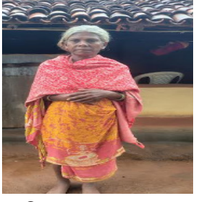
ଯୋଡ଼ିକା ପଞ୍ଚାୟତ ଅଧିନରେ ଥିବା

ରାଜଘର ବୁକ୍ (ମହାଭାରତ)ସରକାରଙ୍କ ବିଭିନ୍ନ ସାମାଜିକ ସୁରକ୍ଷା ଯୋଜନା ଥିବା ସତ୍ତ୍ୱେ ଯୋଗ୍ୟ ହିତାଧିକାରୀମାନେ ଏପର୍ଯ୍ୟନ୍ତ ସୁବିଧା ରୁ ବଞ୍ଚିତ । ପଞ୍ଚାୟତ ଓ ବ୍ଲକ୍ ପ୍ରଶାସନିକ ଅଧିକାରୀ ମାନଙ୍କ କାର୍ଯ୍ୟ ଅବହେଳା ଯୋଗୁଁ ବହୁ ଗରିବ ଅସହାୟ ଯୋଗ୍ୟ ହିତାଧିକାରୀ ଭଉଁ ପାଇବାକୁ ବଞ୍ଚିତ ହୋଇ ରହିଥିବା ଦେଖିବାକୁ ମିଳିଛି । ଏହାର କ୍ଷମ୍ପକ ଉଦ୍ଧାରଣ ଦେଖିବାକୁ ମିଳିଛି ରାଜଘର ବୁକ୍ ଅନ୍ତର୍ଗତ