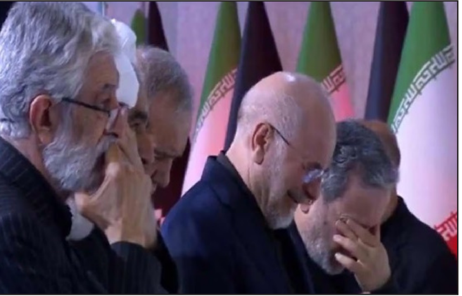
ସର୍ବୋଚ୍ଚ ନେତାଙ୍କ ହତ୍ୟାର ପ୍ରତିଶୋଧ ନେବା ପାଇଁ ଲୋକମାନଙ୍କୁ ବହୁ ସଂଖ୍ୟାରେ କାର୍ଯ୍ୟକ୍ରମରେ ଯୋଗଦେବାକୁ ଗାଳିବାଫ୍ ନିବେଦନ କରିଥିଲେ । ସେ କହିଥିଲେ, ପ୍ରତିଶୋଧ ପାଇଁ ଦେଶର ଆହ୍ଲାନ୍ ସମଗ୍ର ବିଶ୍ୱ ଶୁଣିବାକୁ ପଡ଼ିବ । ତେହେରାନର ଗ୍ରାଣ୍ଡ ମୋସ୍କୁକୁ ଖାମେନିକ୍ ୬ ଦିନିଆ ଅନ୍ତିମ ବିଦାୟ କାର୍ଯ୍ୟକ୍ରମରେ ପ୍ରାୟ ୧୫ ରୁ ୨୦ କୋଟି ଲୋକଙ୍କ ସମାଗମ ହେବାର ଆଶା କରାଯାଇଛି । ଯାହା ଦ୍ୱାରା ସାରା ଦେଶରେ ବିଶେଷ କରି ରାଜଧାନୀ ତେହେରାନରେ ଭକ୍ତ ସୁରକ୍ଷା ସତର୍କତା ଜାରି କରାଯାଇଛି । ସେମାନଙ୍କ ଦିନ ଏକ ଶୋଭାଯାତ୍ରା ଅନୁଷ୍ଠିତ ହେବ । ଏହା ପରେ ଭରାନର ସ୍ତ୍ରୀ ଇସଲାମିକ୍ ଶିକ୍ଷାର ପ୍ରମୁଖ କେନ୍ଦ୍ର ତେହେରାନରୁ ପ୍ରାୟ ୧୪୦ କିଲୋମିଟର ଦକ୍ଷିଣ-ପଶ୍ଚିମରେ ଅବସ୍ଥିତ ପବିତ୍ର କୋମ ସହରଠାରେ ଆଉ ଏକ ଶୋଭାଯାତ୍ରା ହେବ । ଜୁଲାଇ ୯ ତାରିଖରେ, ଶୋଭାଯାତ୍ରାଟି ଖାମେନିକ୍ ଜନ୍ମସ୍ଥାନ ପବିତ୍ର ସହର ମାଶାଦକୁ ଯିବ । ଯେଉଁଠାରେ ତାଙ୍କୁ ଲମ୍ବା ରେଜା ମଠାରେ କବର ଦିଆଯିବ । ପଡ଼ୋଶୀ ଭରାନର ଐତିହାସିକ ପବିତ୍ର ସହର ନଜଫ ଏବଂ କାରବାଲାରେ ମଧ୍ୟ ସ୍ମାରକୀ ସେବା ଅନୁଷ୍ଠିତ ହେବ ।

ଭରାନ୍ : ଭରାନର ଲୋକପ୍ରିୟ ସର୍ବୋଚ୍ଚ ନେତା ଆୟାତୋଲୁ ଅଲ୍ଲି ଖାମେନିକ୍ ବିଦାୟକାଳୀନ ସଭାରେ ବାଚସ୍ପତି ମହମ୍ମଦ ବାସେର ଗାଳିବାଫ୍ ଅଖିରେ ଲୁହ ଦେଖିବାକୁ ମିଳିଥିଲା । ଅନ୍ତିମ ବିଦାୟ ସମୟରେ ଗାଳିବାଫ୍ ହାତ ଯୋଡ଼ି ପ୍ରାର୍ଥନା କରିଥିଲେ ଭାବପ୍ରବଣ ହୋଇଯାଇଥିଲେ । ଆମେରିକା ସହିତ ଆଲୋଚନାରେ ଭରାନର ମୁଖ୍ୟ ଆଲୋଚକ ଗାଳିବାଫ୍ଙ୍କୁ ବୈଦେଶିକ ମନ୍ତ୍ରୀ ସେୟଦ ଆବାସ୍ ଆରାଘଟି ଏବଂ ଅନ୍ୟାନ୍ୟ ବରିଷ୍ଠ ଅଧିକାରୀଙ୍କ ସହିତ ଠିଆ ହୋଇଥିବାର ଦେଖାଯାଇଥିଲା । ଖାମେନିକ୍ ବିଦାୟକାଳୀନ ସଭା ପାଇଁ ଲୋକମାନେ ଏକାଠି ହେବା ସମୟରେ ଆରାଘଟି ମଧ୍ୟ ଭାବପ୍ରବଣ ହୋଇଥିବା ଦେଖିବାକୁ ମିଳିଥିଲା । ଖାମେନିକ୍ ପ୍ରାୟ ୩୬ ବର୍ଷ ଧରି ଇସଲାମିକ୍ ଗଣରାଜ୍ୟ ଭରାନରେ ଶାସନ କରିଥିଲେ । ଶୁକ୍ରବାର ଦିନ ଖାମେନିକ୍ କଫିନକୁ ତେହେରାନର ଗ୍ରାଣ୍ଡ ମୋସ୍କୁକୁ ଅଣାଯାଇଥିଲା । ତାଙ୍କ କଫିନକୁ ରିପବ୍ଲିକ ରଙ୍ଗରେ ଘୋଡ଼ାଯାଇଥିଲା । ସର୍ବୋଚ୍ଚ ନେତାଙ୍କ ହତ୍ୟାର ପ୍ରତିଶୋଧ ନେବା ପାଇଁ ଲୋକମାନଙ୍କୁ ବହୁ ସଂଖ୍ୟାରେ କାର୍ଯ୍ୟକ୍ରମରେ ଯୋଗଦେବାକୁ ଗାଳିବାଫ୍ ନିବେଦନ କରିଥିଲେ । ସେ କହିଥିଲେ, ପ୍ରତିଶୋଧ ପାଇଁ ଦେଶର ଆହ୍ଲାନ୍ ସମଗ୍ର ବିଶ୍ୱ ଶୁଣିବାକୁ ପଡ଼ିବ । ତେହେରାନର ଗ୍ରାଣ୍ଡ ମୋସ୍କୁକୁ ଖାମେନିକ୍ ୬ ଦିନିଆ ଅନ୍ତିମ ବିଦାୟ କାର୍ଯ୍ୟକ୍ରମରେ ପ୍ରାୟ ୧୫ ରୁ ୨୦ କୋଟି ଲୋକଙ୍କ ସମାଗମ ହେବାର ଆଶା କରାଯାଇଛି । ଯାହା ଦ୍ୱାରା ସାରା ଦେଶରେ ବିଶେଷ କରି ରାଜଧାନୀ ତେହେରାନରେ ଭକ୍ତ ସୁରକ୍ଷା ସତର୍କତା ଜାରି କରାଯାଇଛି । ସେମାନଙ୍କ ଦିନ ଏକ ଶୋଭାଯାତ୍ରା ଅନୁଷ୍ଠିତ ହେବ । ଏହା ପରେ ଭରାନର ସ୍ତ୍ରୀ ଇସଲାମିକ୍ ଶିକ୍ଷାର ପ୍ରମୁଖ କେନ୍ଦ୍ର ତେହେରାନରୁ ପ୍ରାୟ ୧୪୦ କିଲୋମିଟର ଦକ୍ଷିଣ-ପଶ୍ଚିମରେ ଅବସ୍ଥିତ ପବିତ୍ର କୋମ ସହରଠାରେ ଆଉ ଏକ ଶୋଭାଯାତ୍ରା ହେବ । ଜୁଲାଇ ୯ ତାରିଖରେ, ଶୋଭାଯାତ୍ରାଟି ଖାମେନିକ୍ ଜନ୍ମସ୍ଥାନ ପବିତ୍ର ସହର ମାଶାଦକୁ ଯିବ । ଯେଉଁଠାରେ ତାଙ୍କୁ ଲମ୍ବା ରେଜା ମଠାରେ କବର ଦିଆଯିବ । ପଡ଼ୋଶୀ ଭରାନର ଐତିହାସିକ ପବିତ୍ର ସହର ନଜଫ ଏବଂ କାରବାଲାରେ ମଧ୍ୟ ସ୍ମାରକୀ ସେବା ଅନୁଷ୍ଠିତ ହେବ ।