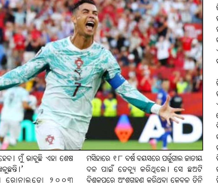
ଏହା ଖୁବ୍ ଶୀଘ୍ର ହେବ । ମୁଁ ଭାବୁଛି ଏହା ଶେଷ ପର୍ଯ୍ୟନ୍ତ ରୋନାଲ୍‌ଡୋ ୨୦୦୩ ମସିହାରେ ୧୮ ବର୍ଷ ବୟସରେ ପର୍ତ୍ତୁଗାଲ ଜାତୀୟ ଦଳ ପାଇଁ ତେରୁ କରିଥିଲେ । ସେ ଛଅଟି ବିଶ୍ୱକପରେ ଅଂଶଗ୍ରହଣ କରିଥିବା କେବଳ ତିନି