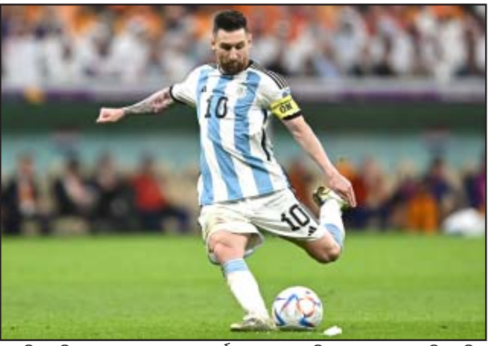
ଲିଏନେଲ ମେସିଙ୍କୁ ବିଶ୍ୱକପ ଉପରେ ୨୦୦୭ ମସିହାରୁ ଆରମ୍ଭ ହୋଇଥିଲା । ଏହା ପରେ ୨୦୧୦, ୨୦୧୪, ୨୦୧୮, ୨୦୨୨ ଓ ୨୦୨୬ ସଂସ୍କରଣରେ ସେ ଆକର୍ଷଣର ପ୍ରତିନିଧିତ୍ୱ କରି ଆସୁଛନ୍ତି ।

କୋର୍ଡାନ ବିପକ୍ଷରେ ଗୋଟିଏ ଗୋଲ ଦେଇଥିଲେ । ଶୁକ୍ରବାର ରାତିର କେପ୍‌ବର୍ଡେ ବିପକ୍ଷ ମ୍ୟାଚରେ ମଧ୍ୟ ଆଉ ଗୋଟିଏ ଗୋଲ ଦେଇଛନ୍ତି । ଚଳିତ ବିଶ୍ୱକପର ରାଉଣ୍ଡ ଅଫ୍ ୩୨ ସୁଦ୍ଧା ସର୍ବାଧିକ ଗୋଲ ଦେଇଥିବା ମେସିଙ୍କୁ ବିଶ୍ୱକପ ଉପରେ ମଧ୍ୟ ସର୍ବାଧିକ ୨୦ ଗୋଲ ଦେବାର କାର୍ତ୍ତିମାନ କରିଛନ୍ତି । ମେସିଙ୍କୁ ବିଶ୍ୱକପ ଉପରେ ୨୦୦୭ ମସିହାରୁ ଆରମ୍ଭ ହୋଇଥିଲା । ଏହା ପରେ ୨୦୧୦, ୨୦୧୪, ୨୦୧୮, ୨୦୨୨ ଓ ୨୦୨୬ ସଂସ୍କରଣରେ ସେ ଆକର୍ଷଣର ପ୍ରତିନିଧିତ୍ୱ କରି ଆସୁଛନ୍ତି । ସଂପ୍ରତି ସେ ନିଜ ଶ୍ରେଷ୍ଠ ବିଶ୍ୱକପ ଖେଳୁଛନ୍ତି । ମୋଟ ଉପରେ ୨୯ଟି ବିଶ୍ୱକପ ମ୍ୟାଚ ଖେଳି ୨୦ ଗୋଲ ଦେଇଛନ୍ତି । ୮ଟି ଗୋଲରେ ସାହାଯ୍ୟ କରିଛନ୍ତି । ବିଶ୍ୱକପ ଅଧିକାରରେ ପୁରସ୍କାର ପଡିଆରେ ରେକର୍ଡ ୨୬୩୪ ମିନିଟ୍ କରାଯାଇଛି । ଗତ ଉପରେ ୩୯ତମ କନୁକ୍ଟିବସ ପାଇଥିବା ମେସିଙ୍କୁ ପ୍ରତିଭାକୁ ସେନ୍ଦ୍ର ବାସିଲୋନା କୁଡ଼ି ? ତିନି ଡାକ ଗୋଟିଏ ହର୍ମୋନ ଚିକିତ୍ସାର ସମସ୍ତ ଖର୍ଚ୍ଚ ବହନ କରିଥିଲା ।